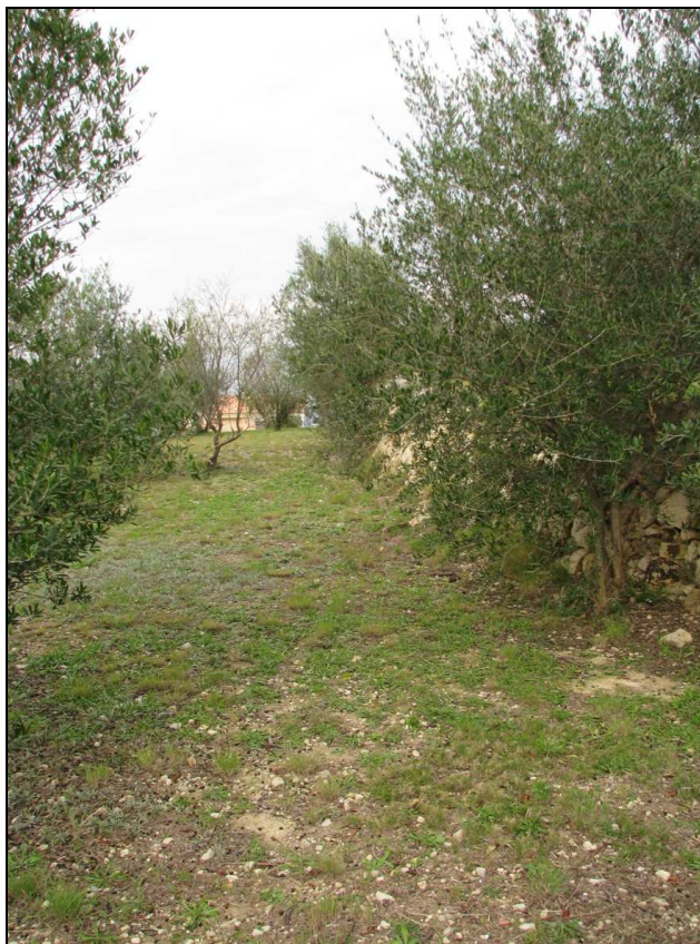
Vista parcial del área de intervención.