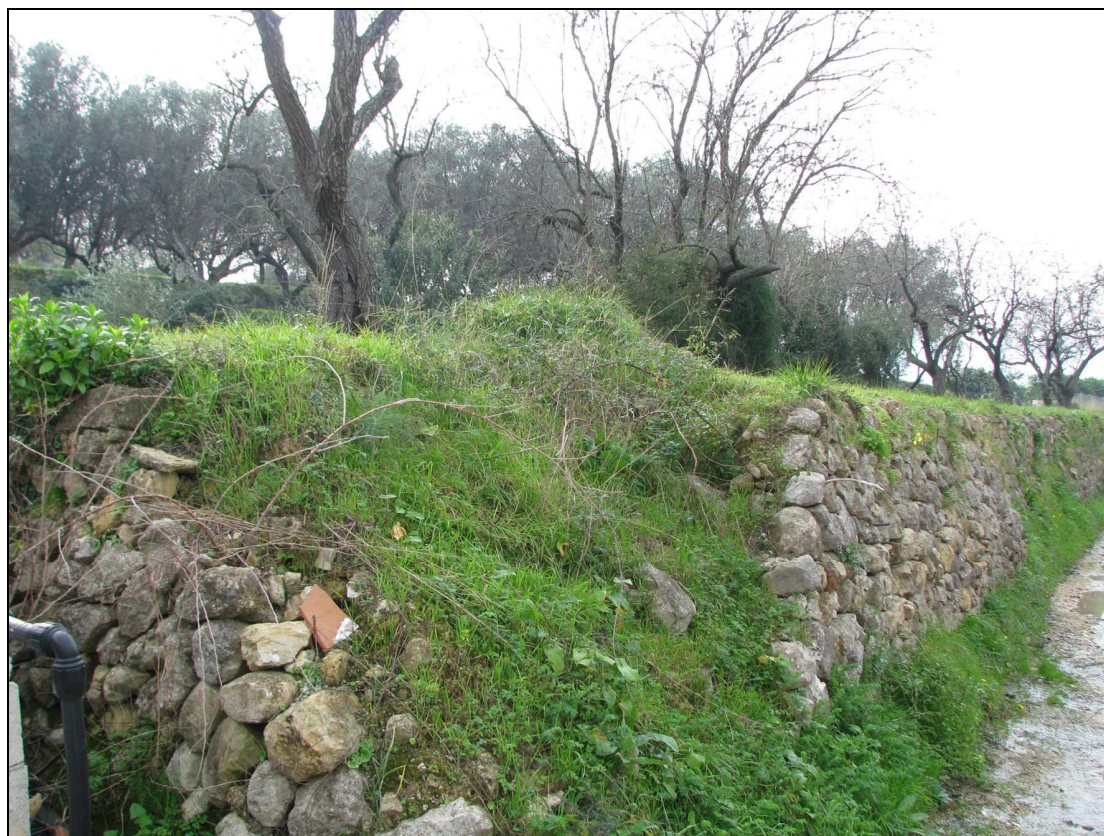
Detalle de uno de los bancales localizados.