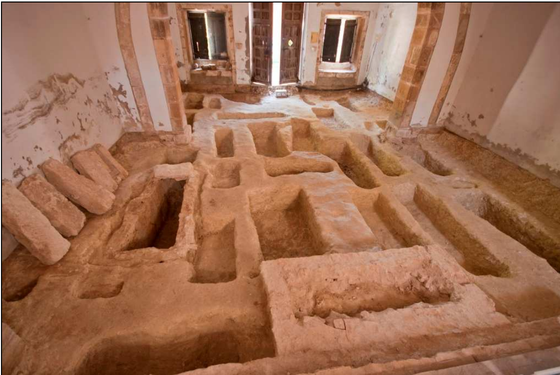
Vista del àrea excavada des de l'oest.