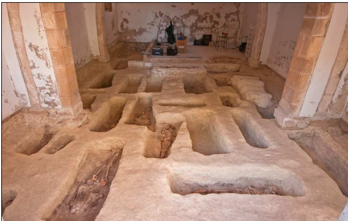
Vista del àrea excavada des de l'est.