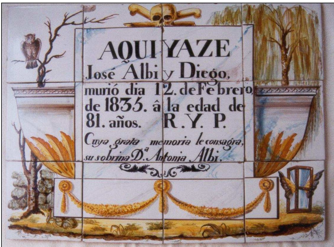
Vista d'un dels plafons funeraris de taulelleria valenciana de l'ermita de Sant Joan.