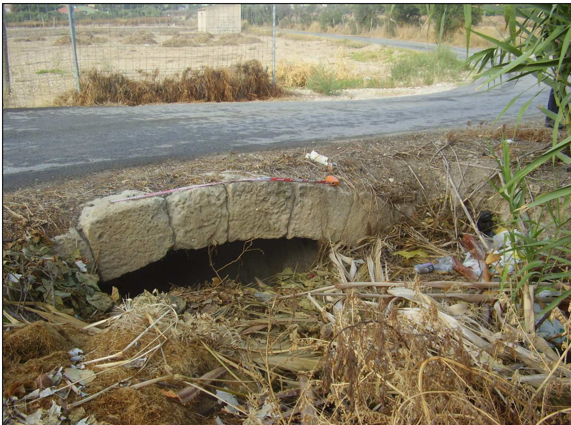
Detalle de la acequia del Gualeró.