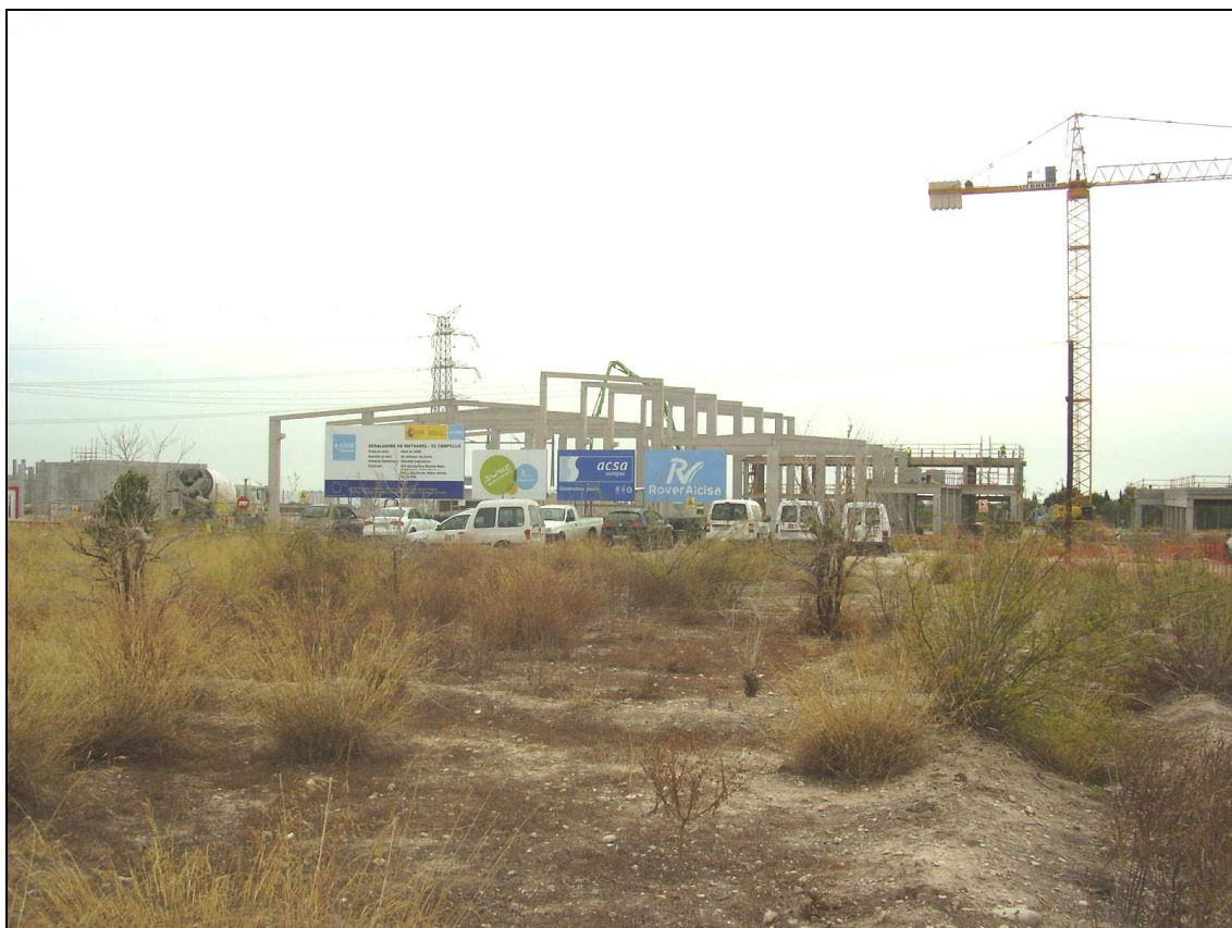
Panorámica de la desaladora de Mutxamel.