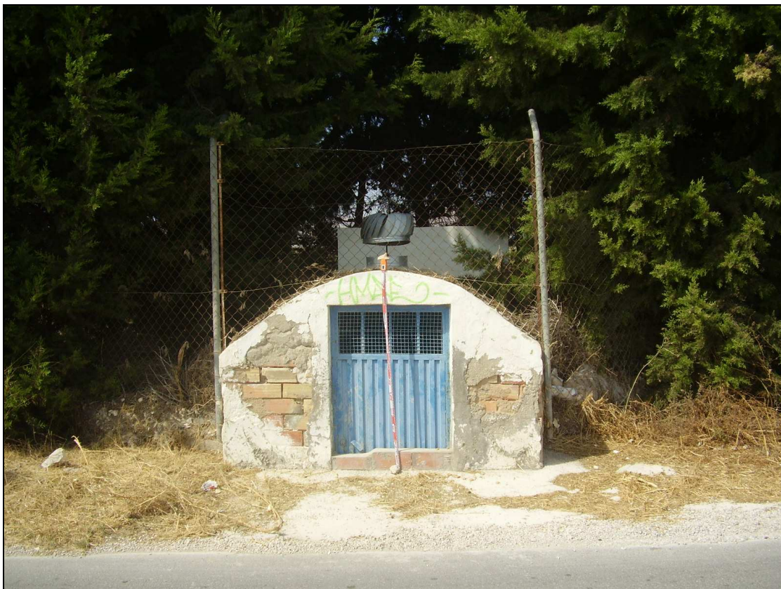
Vista del aljibe del camí de la Torreta.