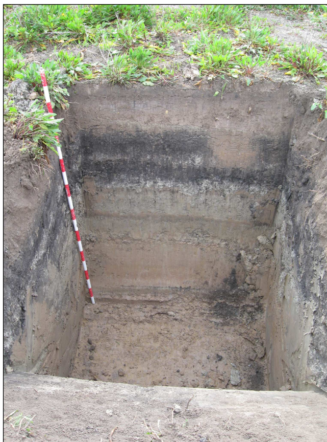
Vista de uno de los sondeos practicados.