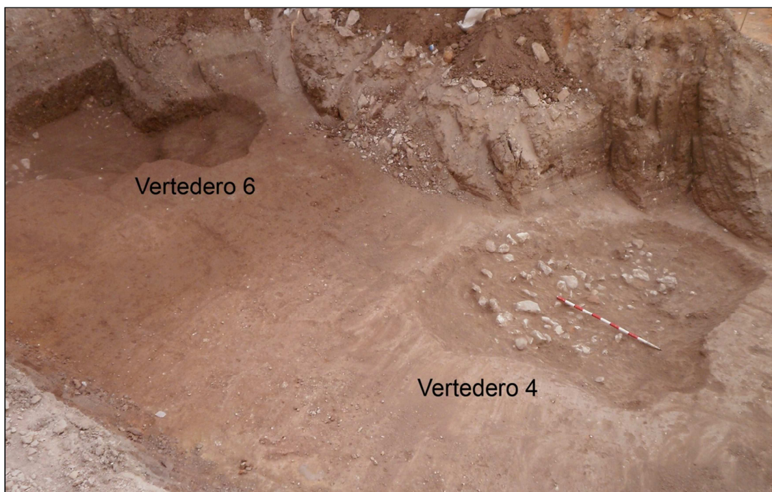
Vista desde la calle Luis Chorro de los vertederos 4 y 6.