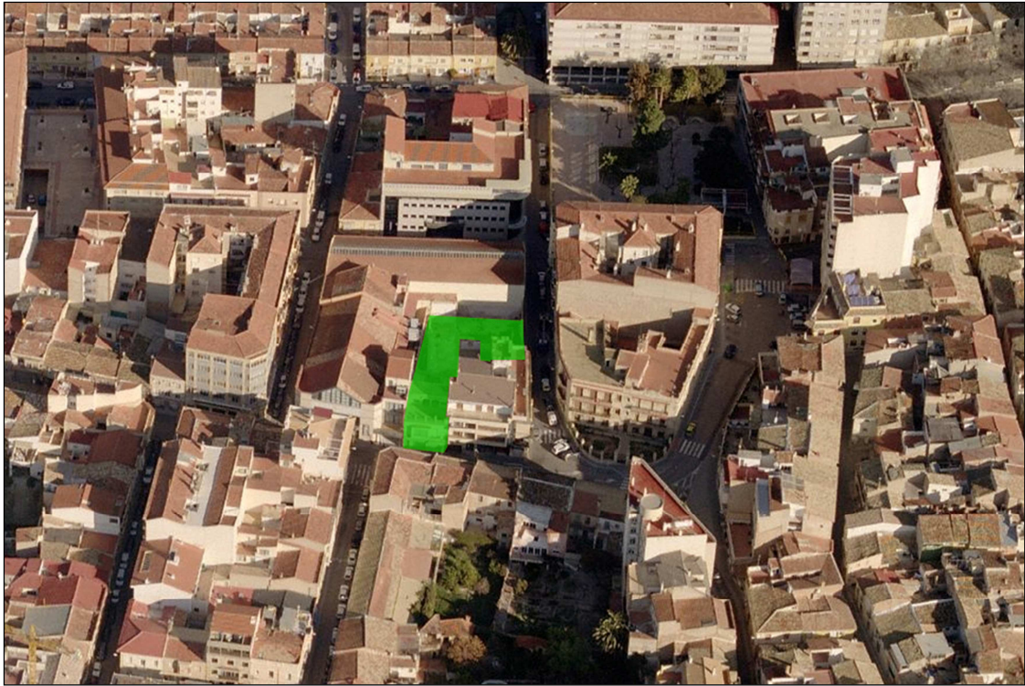
Vista aérea del centro de Petrer. En verde, la ampliación del Centro Cultural.