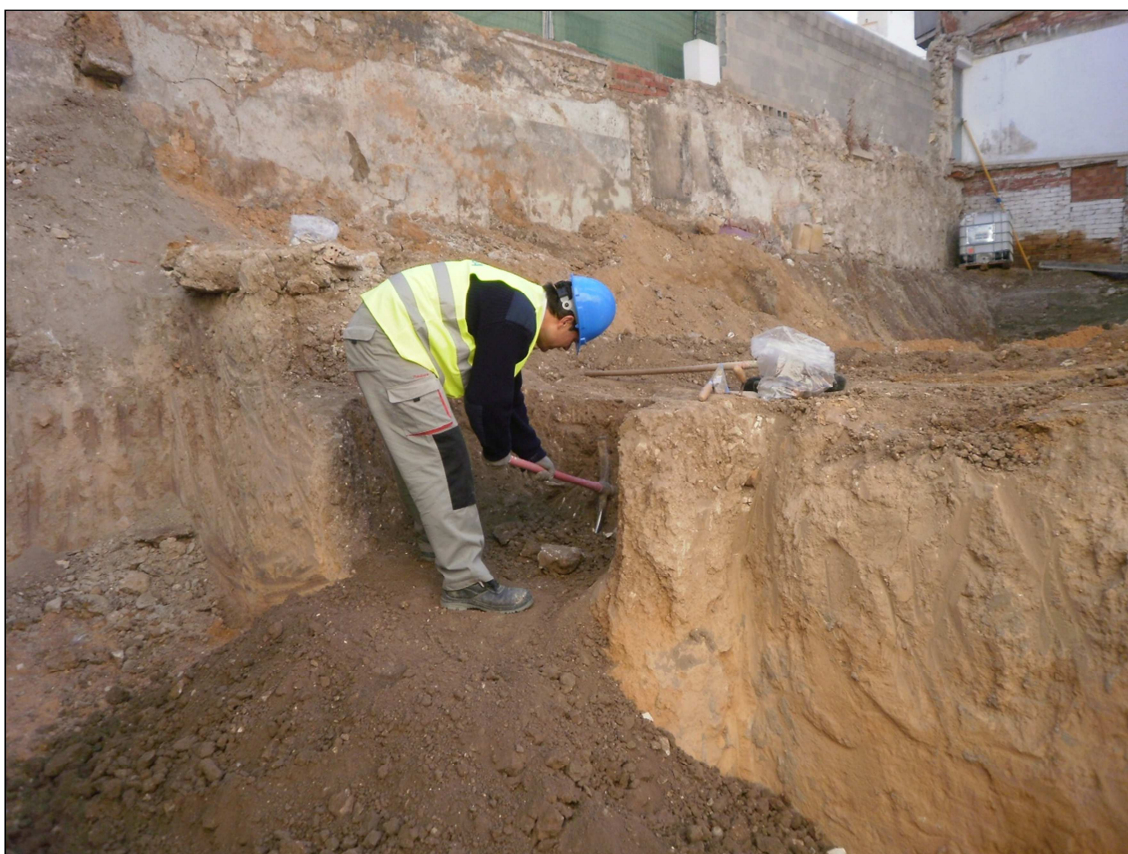
Detalle del proceso de excavación del vertedero 2.