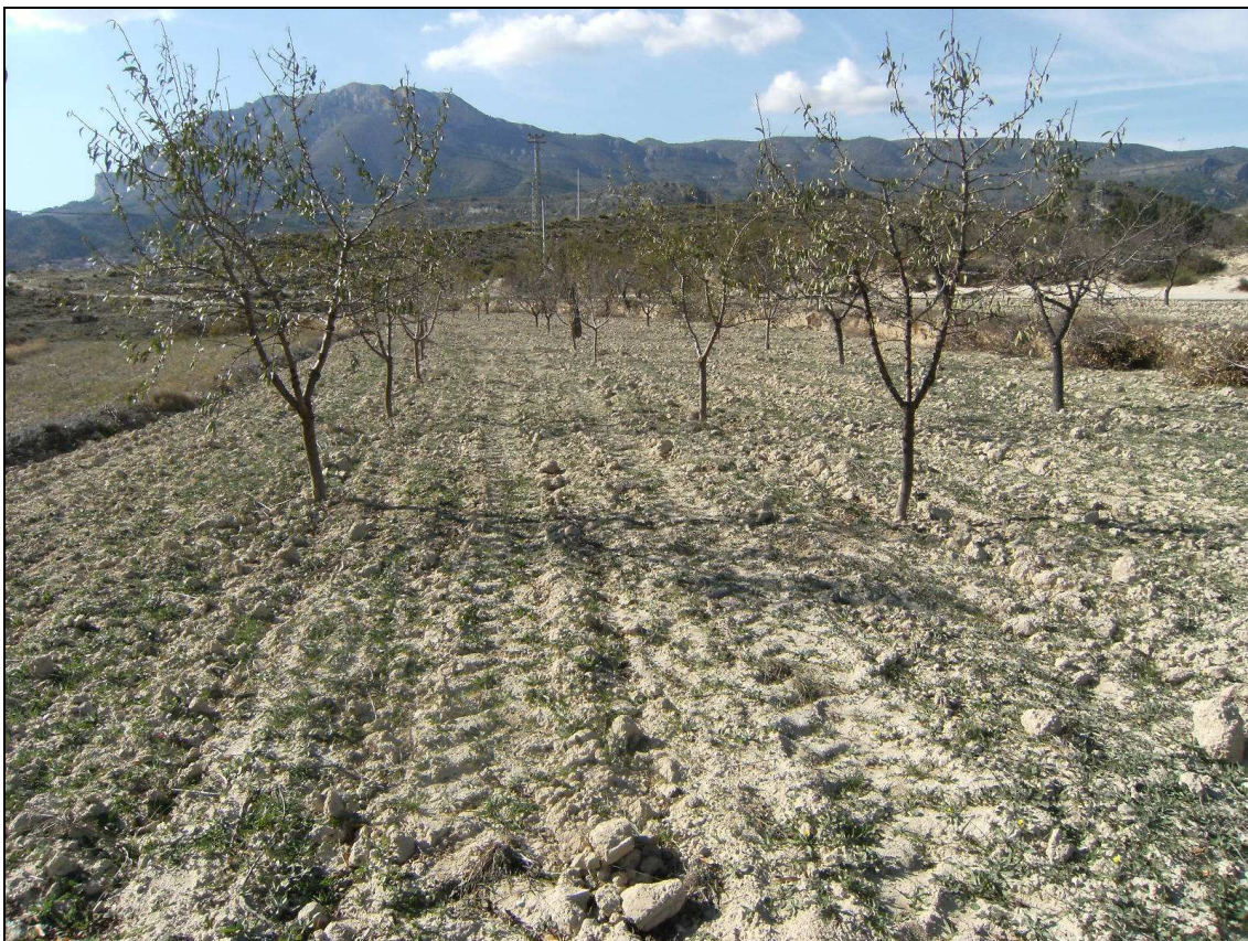
Panorámica parcial del área reconocida.