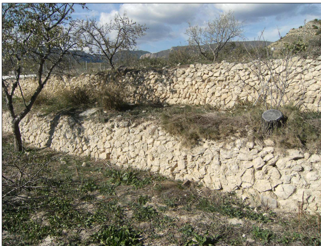
Detalle del tipo de aterrazamientos.