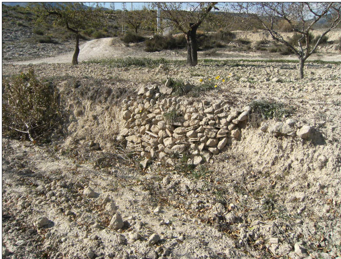
Panorámica parcial de los cultivos de la zona.