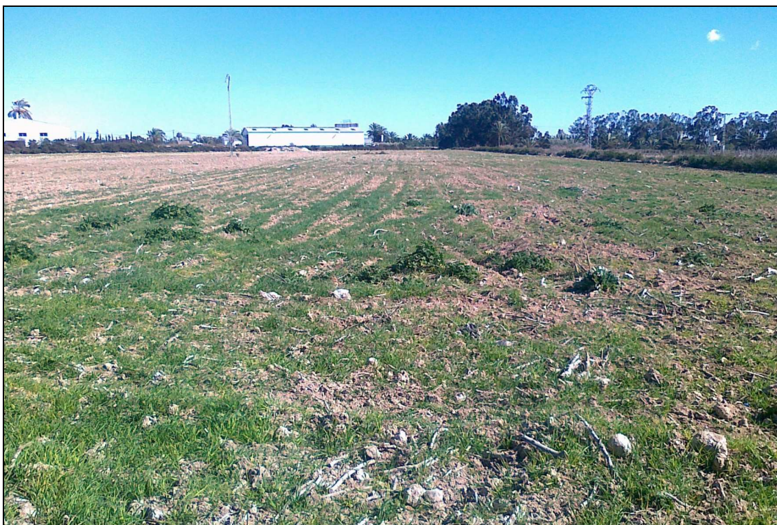
Panorámica del área prospectada.