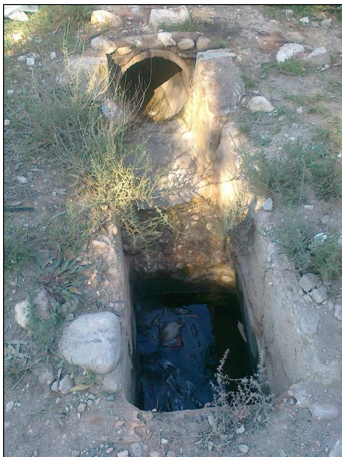
Vista del partidor localizado en el área exterior de la zona prospectada.