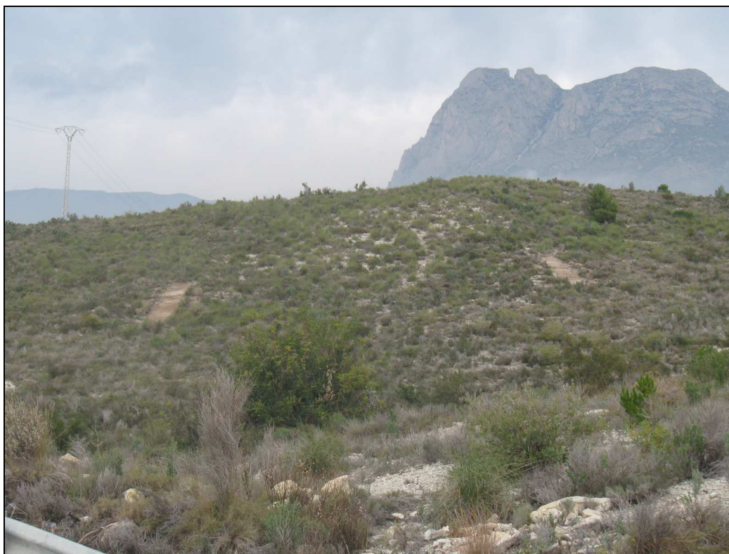
Vista general del área Carquendo IV al final de la intervención.