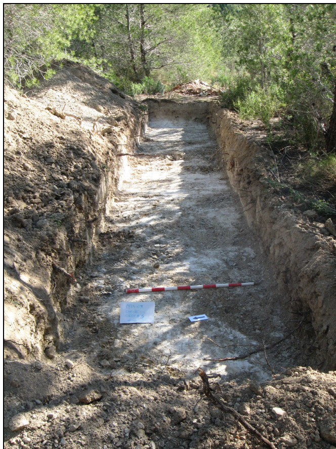
Vista del sondeo 5 en el área Carquendo III.