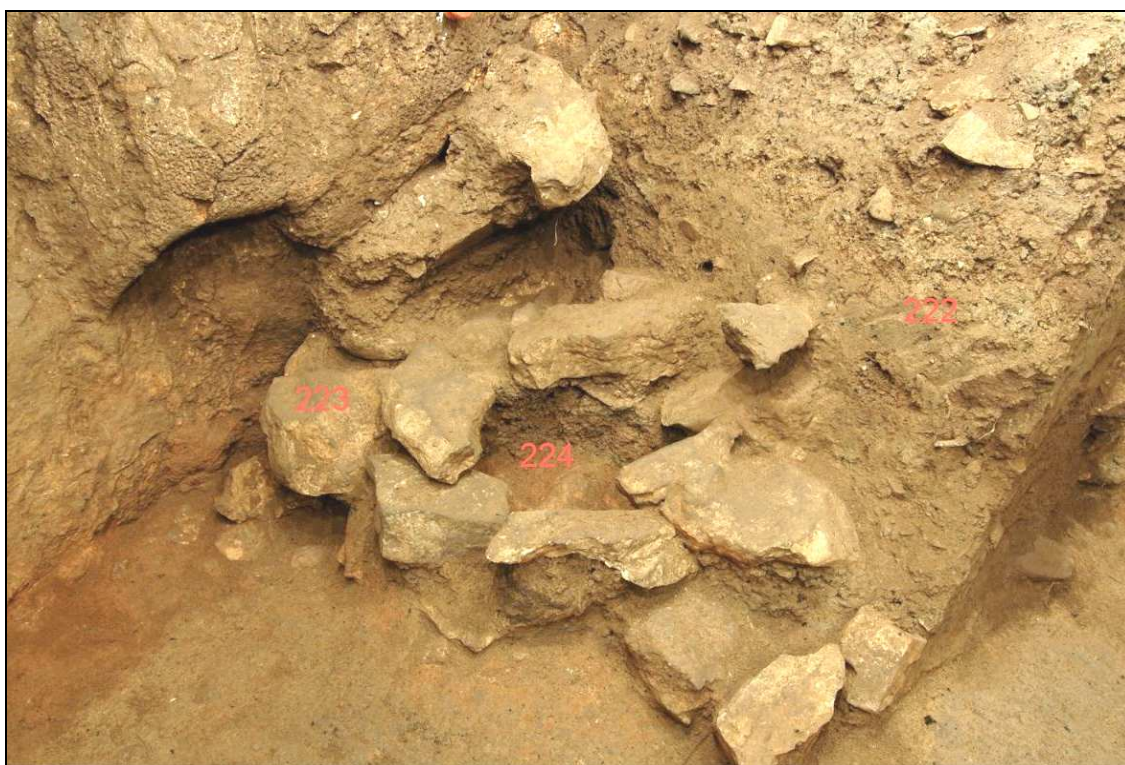
Detalle de las UU.EE. 222, 223 y 224.