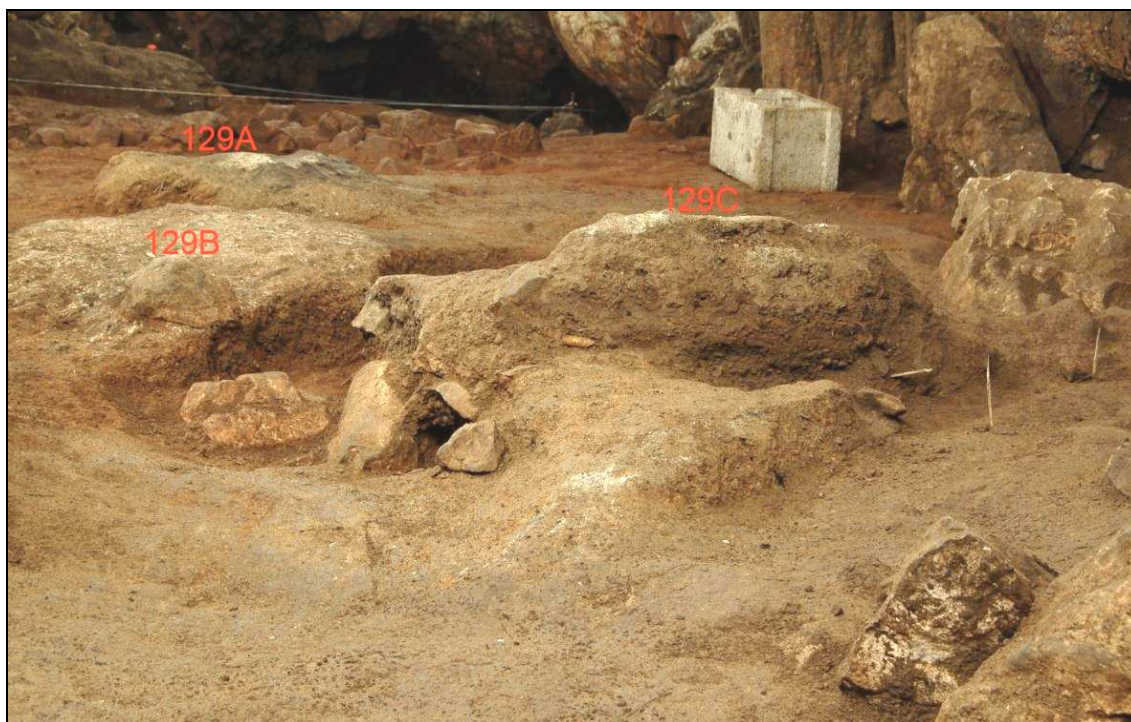
Vista de la UE 129.