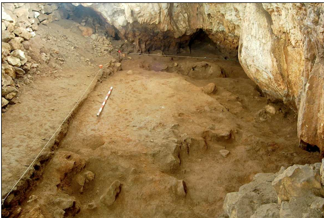
Vista de la UE 601.