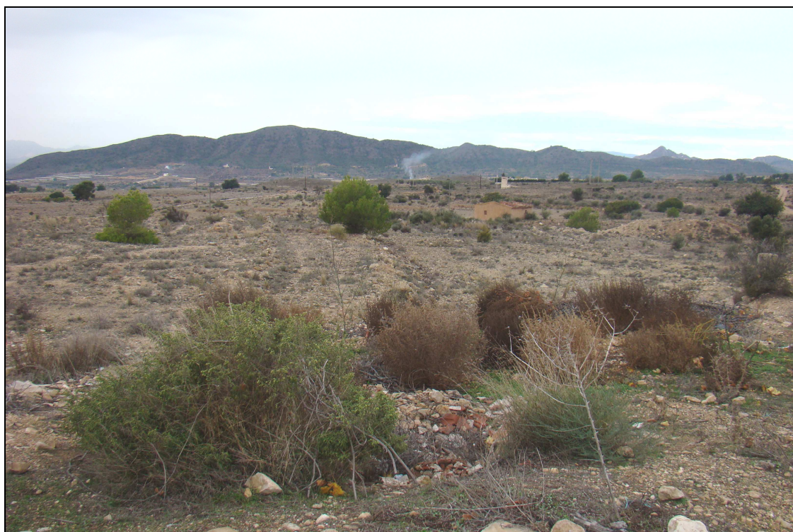
Vista general del área de intervención.