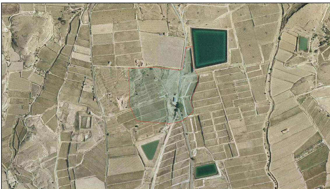
Vista aérea del área prospectada.