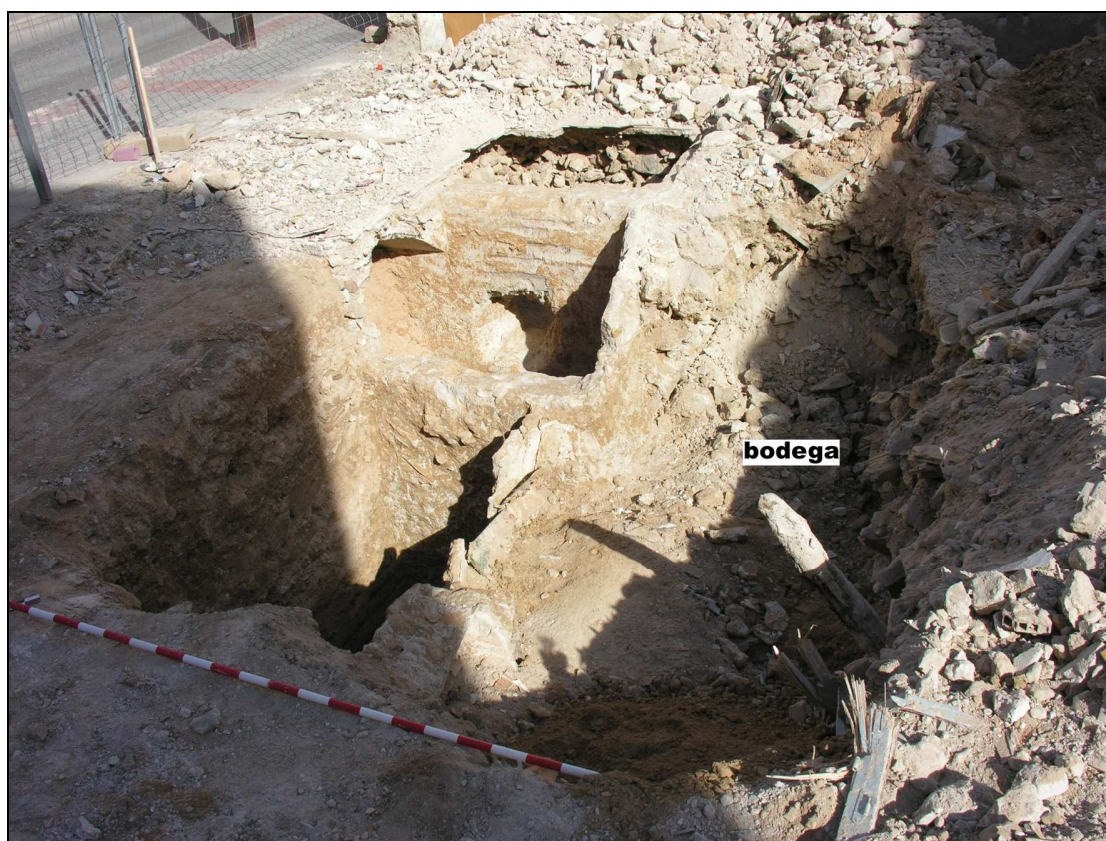
Vista del sondeo 2 una vez finalizado.