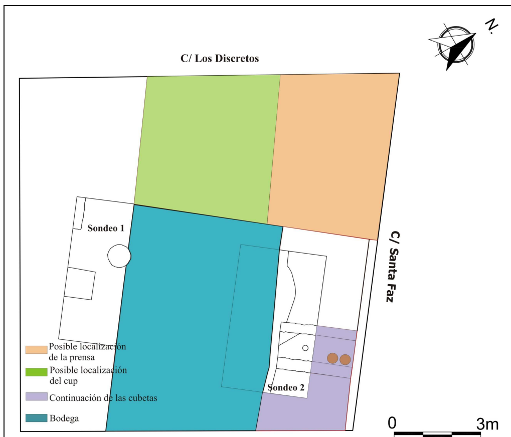
Plano de localización de los sondeos, las estructuras y las compartimentaciones del lagar.