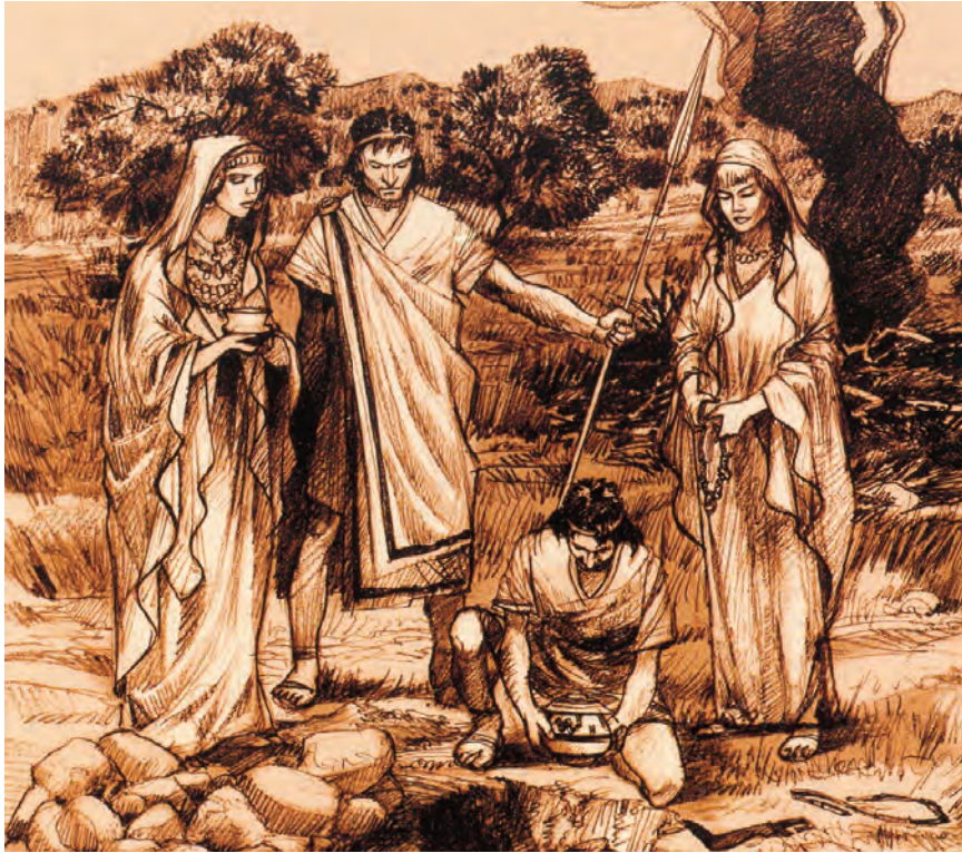
Figure 12. Scene of an Ancient Iberian funerary ritual.

Statuettes made of baked clay are sometimes known as “tanagras”. In the western Phoenician-Punic culture these figures were invested with strong magical-religious meanings. When found in sanctuaries or cemeteries, they are often interpreted as being votive offerings, probably representing the goddess being worshipped or acting as surrogates for the worshiper who is making the offering as an invocation for love, fecundity, victory in a dispute, etc. When found in domestic environments they are usually associated with femininity and child birth.