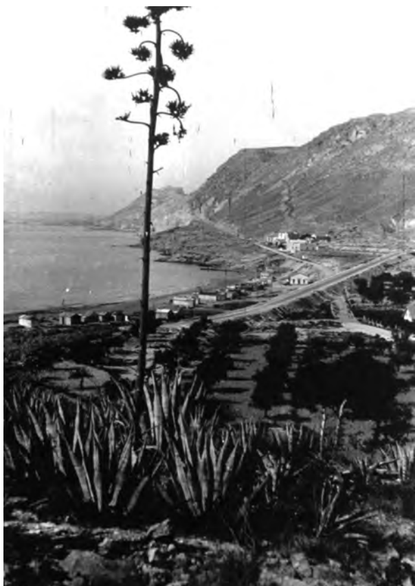
Figura 1a. La bahía de l'Albufereta en los años 30 del siglo XX.