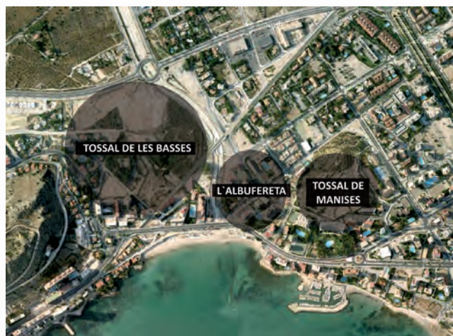
Figura 2. L'Albufereta y sus yacimientos.

En este valioso conjunto sobresale una interesante colección de pequeñas estatuas de terracota, es decir, moldeadas con arcilla, secadas al sol y cocidas en hornos, probablemente los mismos que se emplearon para la cerámica vascular.