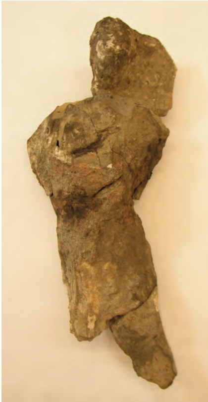
Figure 9. Female standing figure with a billowing veil and long robe carrying a child.

ned figure of a new born baby held in the main figure's arms and lap. The child appears to be reaching out with one hand to the left breast of its mother. Like the first figure, there are remains of iron oxide stuck to some areas of the figure, as well as white slip, which was probably applied before it was fired.