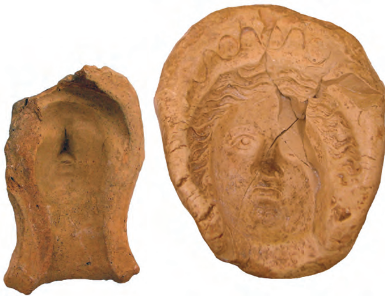
Figura 3. Motlles d'argila del Tossal de Manises (Alicante) i Foia de Santa Maria (el Campello).

Tradicionalment s'ha mantingut que la coroplàstia, o l'art d'elaborar escultura o relleu en terracota, és un "art popular" o "menor". És cert que aquestes manifestacions artístiques són obra d'un artesanat modest i anirien destinades a una clientela amb recursos econòmics limitats, encara que hi ha una gran diversitat de qualitats, acabats i decoracions.