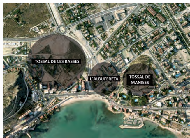
Figure 2. L'Albufereta and its archaeological sites.

One of the highlights of this rich collection of finds is an interesting group of small terracotta statues. These were moulded out of clay, dried in the sun and fired in kilns, probably using the same kilns that were used to make pottery vessels.