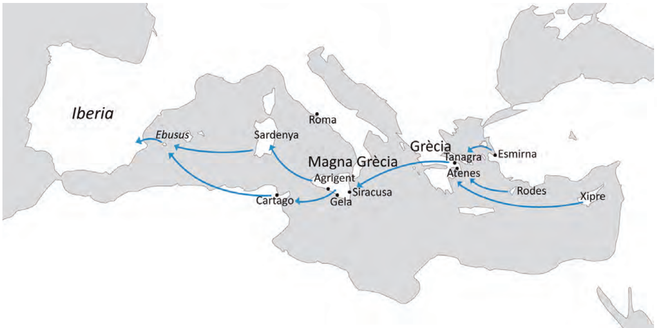
Figura 4. Mapa de difusió de la fabricació d'objectes de terracota pel Mediterrani antic.

els peveters o cremadors d'aromes en forma de cap femení, va ser assimilat per les ciutats púniques, des d'on es transmetrà a Cartago, Sardenya, Ebusus i Iberia (fig. 4).