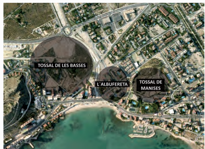
Figura 2. L'Albufereta i els seus jaciments.

En aquest valuós conjunt hi destaquem una col·lecció interessant d'estàtues petites de terracota, és a dir, modelades amb argila, asseccades al sol i cuites en forns, probablement els mateixos que es van emprar per a la ceràmica vascular.