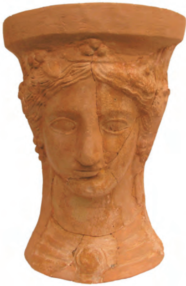
Figure 11. Incense burner in the form of a female head from la Illeta dels Banyets (el Campello).

These female figures have been traditionally identified with a fertility or mother goddess. Traditional classical-centrist interpretations have given them names derived from the Egyptian, Greek, Phoenician-Punic and Eastern pantheon of gods (Isis, Astarte, Demeter, Ceres etc...). These new representations appear to have co-existed with the native gods. In Alicante, the presence of Punic pottery and other objects has led to the interpretation that the figures found here are more closely associated with the Semite world rather than the Greek world.