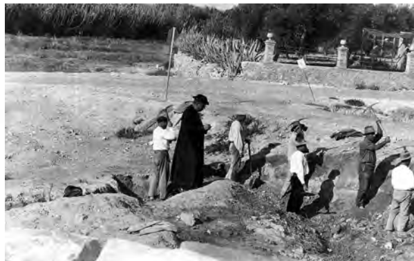
Figura 1b. Excavaciones de José Belda en la necrópolis.

Los objetos recuperados, como es habitual en las necrópolis ibéricas, son tanto cerámicos como metálicos o bien están elaborados en materias tan diversas como la pasta vítrea o el marfil.