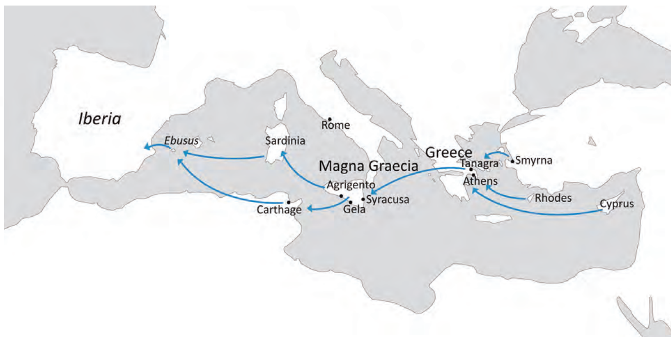
Figure 4. Distribution map of the manufacture of terracotta objects in the Ancient Mediterranean.

ners in the form of female heads – was adopted and assimilated by the Punic cities. From these, they spread to Carthage, Sardinia, Ebusus (Ibiza) and Iberia (fig 4).