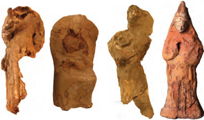
Figure 6. Selection of female terracotta figures from the Albufereta cemetery.

A series of female images stand out amongst the numerous terracotta figurines found in the Albufereta cemetery. These images contain various similarities and they appear to be related symbolically (fig 6). The four hollow terracottas are made of semi-purified clays and have the same dimensions (c. 25-30 centimetres high). The smooth back part of each figure is slightly convex and has a roughly cir-