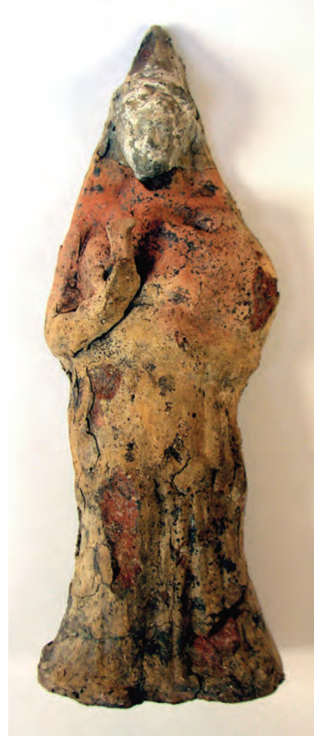
Figure 10. Standing figure with long robe and conical tiara, carrying a dove and a child in her arms.

Another parallel can be found in Sardinia and Sicily with the iconography of standing and enthroned goddesses – in particular the image of the nursing or nurturing goddess carrying a child, which it is sometimes breastfeeding. The parallels also extend to other Ancient Iberian cemeteries in the south-east of the peninsula, such as Cabecico del Tesoro (Verdolay, Murcia) and Coimbra del Barranco Ancho (Jumilla, Murcia). These predominantly date to the second half or end of the 3rd century BC. The parallels between all of these figurines have been interpreted as indicating that there was a mass production of figures using the same moulds. These products were then distributed by trade routes, driven by the great demand for these cult objects, above all in the Iberian area of Contestania.