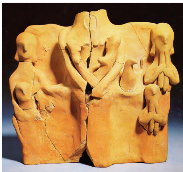
Figure 5. Terracotta pinax from la Serreta (Alcoi).

The tradition of making small terracotta figures can also be found in the Ancient Iberian culture. These figures however were always more schematic in appearance, indicating a more popular and private role (fig 5). This pre-existing custom of clay and metal votive offerings, could explain the rapid and widespread acceptance of these imported figures, leading to, from the 4th century BC, a special interest in Hellenistic style coroplasty.