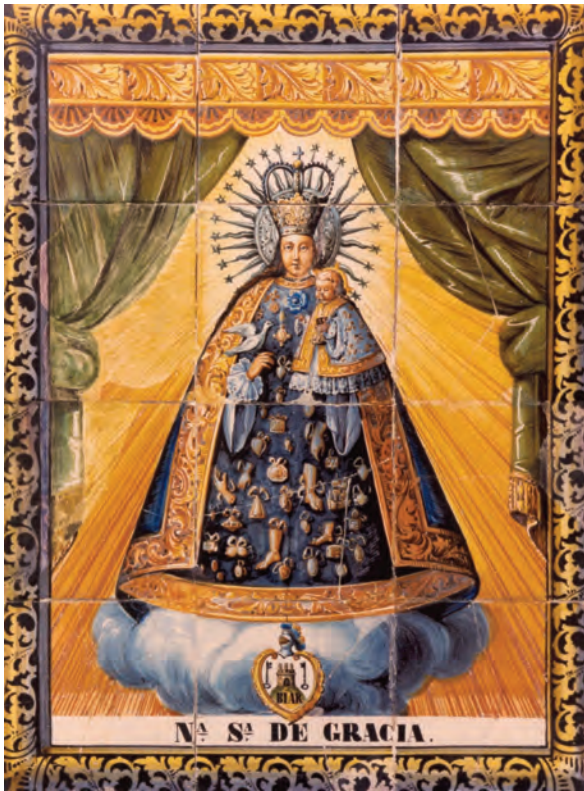
Figure 13. Ceramic panel of the Mare de Déu de Gràcia in Biar.

her cult. The dove links the female figures to funerary practices and it could be interpreted as a symbol of the “soul” or of its “journey” to the “after life”. Examples of figures carrying doves in their hands include the Iberian statue known as the Dama de Baza (interpreted as a representation of a goddess due to its costume and adornments) and a number of small bronze female votive offerings. These representations could perhaps symbolise the deceased who is asking for protection from the goddess.