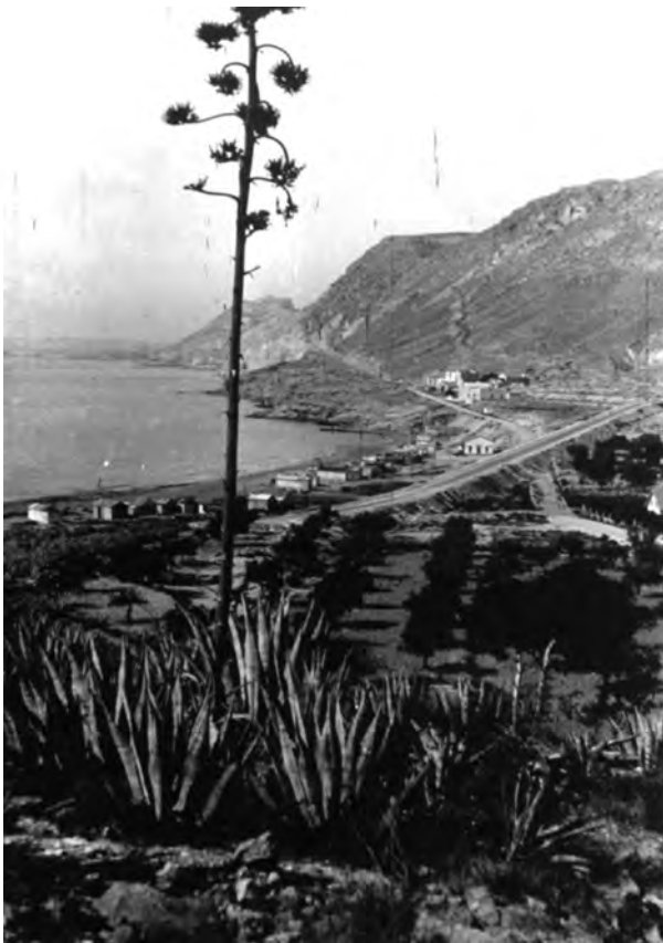
Figure 1a. Albufereta bay in the 1930s.