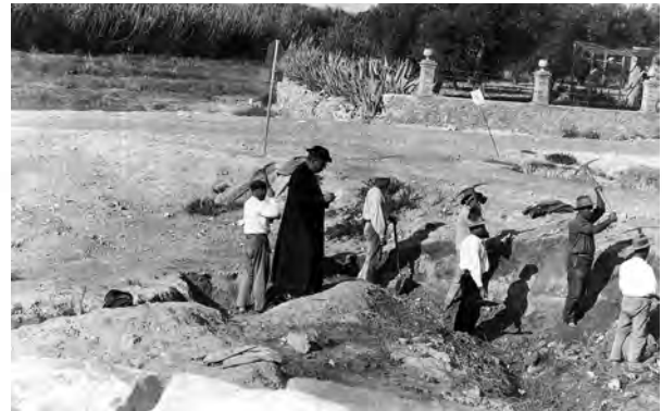
Figure 1b. Excavations by José Belda in the cemetery.

As is usually the case in Ancient Iberian cemeteries, most of the finds uncovered were pottery and metal objects, though some objects of other materials, such as glass paste and ivory, were also found.