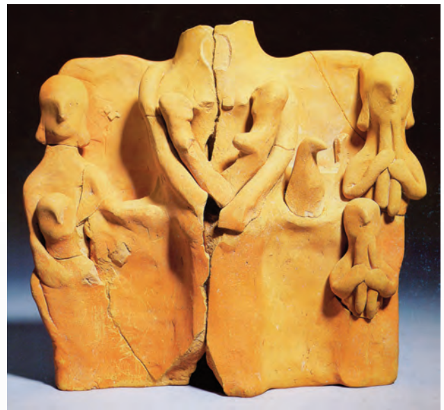
Figura 5. Pínax de terracota de la Serreta (Alcoi).

En la Cultura Ibèrica va existir també el costum de fabricar figures de terracota menudes, encara que sempre amb un aspecte més esquemàtic, la qual cosa denota un caràcter popular i privat (fig. 5). Aquest hàbit preexistent d'emprar exvots d'argila, encara que també de metall, va poder explicar l'acceptació ràpida i generalitzada de les figures importades, i s'hi constata, a partir del segle IV aC, un interès específic per la coroplàstia de caire hel·lènic.