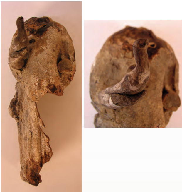
Figure 7. Pregnant terracotta female figure with a long pleated robe and holding a dove.

A series of female images stand out amongst the numerous terracotta figurines found in the Albufereta cemetery. These images contain various similarities and they appear to be related symbolically (fig 6). The four hollow terracottas are made of semi-purified clays and have the same dimensions (c. 25-30 centimetres high). The smooth back part of each figure is slightly convex and has a roughly cir-