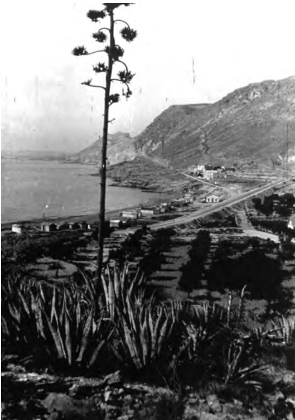
Figura 1a. La badia de l'Albufereta en els anys 30 del segle XX.