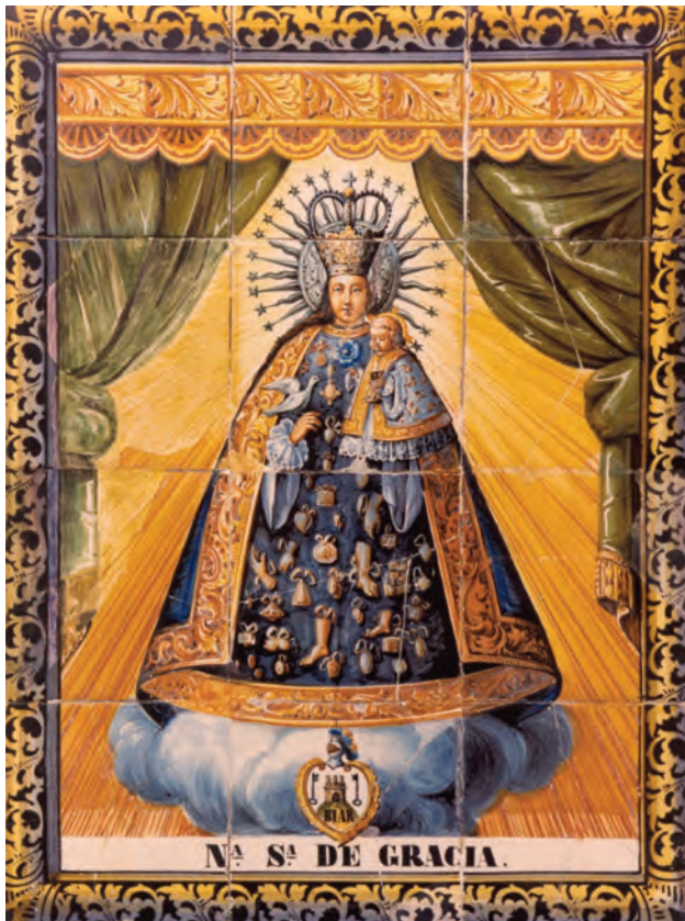
Figura 13. Panell ceràmic de la Mare de Déu de Gràcia de Biar.

tar-se com a símbol de l'“ànima” o del seu “viatge” al “més enllà”. L'escultura ibèrica de la dama de Baza, representada com una deessa a partir de la seua indumentària i ornamentació, així com alguns exvots femenins petits en bronze, porten coloms entre les seues mans, que devien simbolitzar el difunt, que es troba protegit d'aquesta manera per la divinitat.