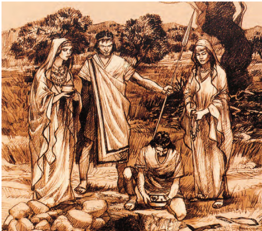
Figura 12. Escena del ritual funerari ibèric.

Les estatuetes de terrissa, de vegades anomenades “tanagres” o “tanagrines”, estan revestides en la cultura feniciopúnica occidental d’un fort caràcter magicoreligiós i s’han interpretat comunament en santuaris i necròpolis com a exvots, representacions de la divinitat o del mateix oferent, que sol·licita amor, fecunditat, victòria en una contesa, etc., encara que també es constaten en ambients domèstics en relació amb la feminitat i el part.