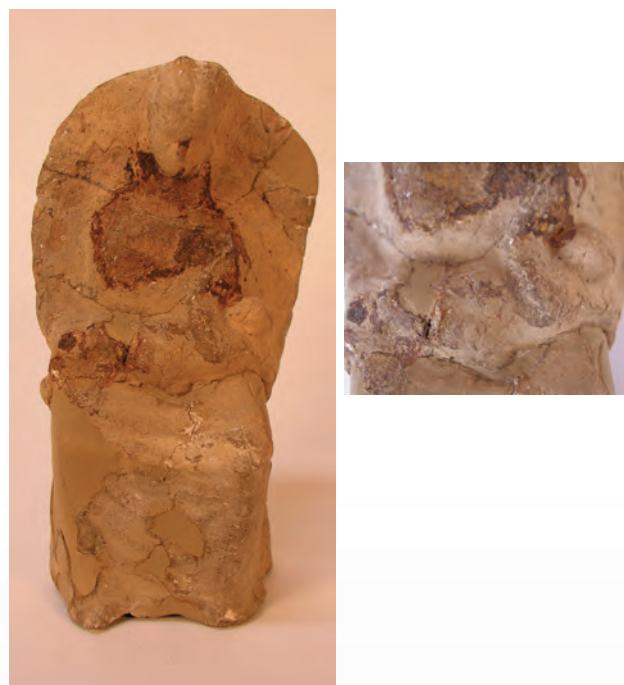
Figura 8. Imatge sedent sobre un tron i alletant a un xiquet.

En primer lloc comptem amb una figura estant (fig. 7), amb els braços apegats al cos i colzes doblegats cap avant en angle recte. El cap i gran part de la meitat inferior han desaparegut però sí se n'aprecien altres trets. La imatge vist una llarga túnica fins els peus, s'hi indiquen suaus plecs verticals en la part inferior, i subjecta amb la mà dreta, l'única que conserva, un colom esquemàtic amb les ales plegades. Els pits són poc prominents però de perfil s'intueix, sota la túnica, el ventre voluminós característic d'una embarassada.