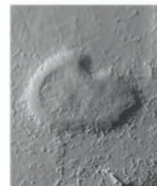
Figura 4. Monedes contramarcades de la col·lecció Enrique Llobregat. Monedes a x1,5 i contramarques a x3.

2010, nº 9). També hem trobat referències a troballes de monedes d'aquest taller a Santa Pola (Abascal, 1989, 23). Així que encara que les monedes d'aquesta seca són poc freqüents ací, no és anòmal trobar-les a les nostres comarques.