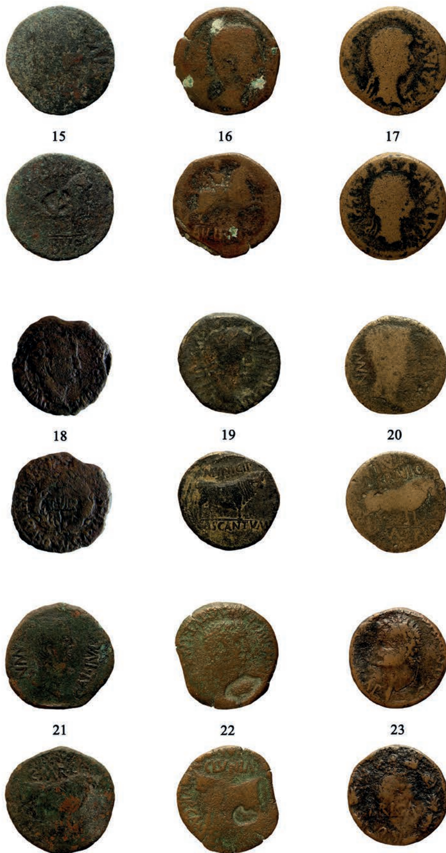
Figura 5. Làmina 2