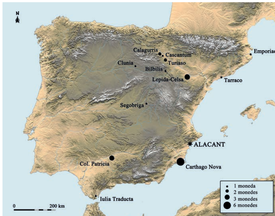
Figura 1. Mapa amb la distribució de les seques estudiades i el seu volum en la col·lecció.

pres esporàdiques de monedes trobades en jaciments de la zona.