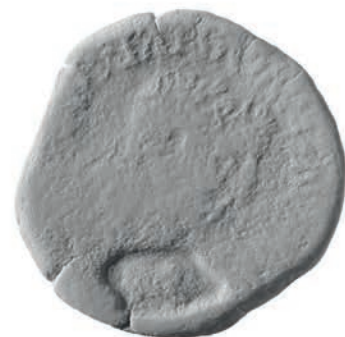
Cat. 22 anv.