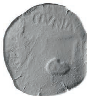
Cat. 22 anv.