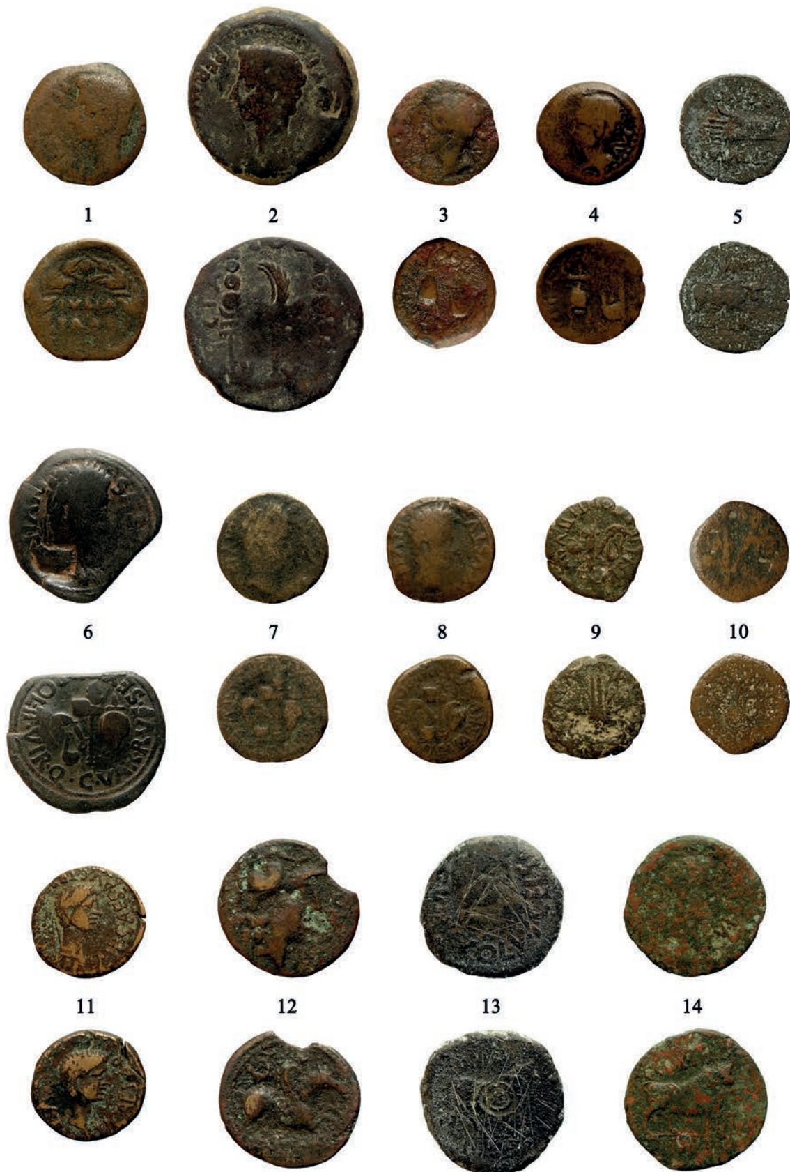
Figura 5. Làmina 1