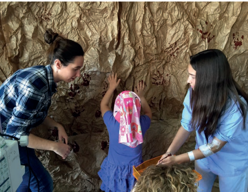
Figura 21. Un hospital de cuento . Actividades didácticas en colaboración con la Unidad Pedagógica Hospitalaria del Hospital General de Alicante.

una herramienta en beneficio de los niños hospitalizados durante largos periodos en el Hospital General de Alicante.