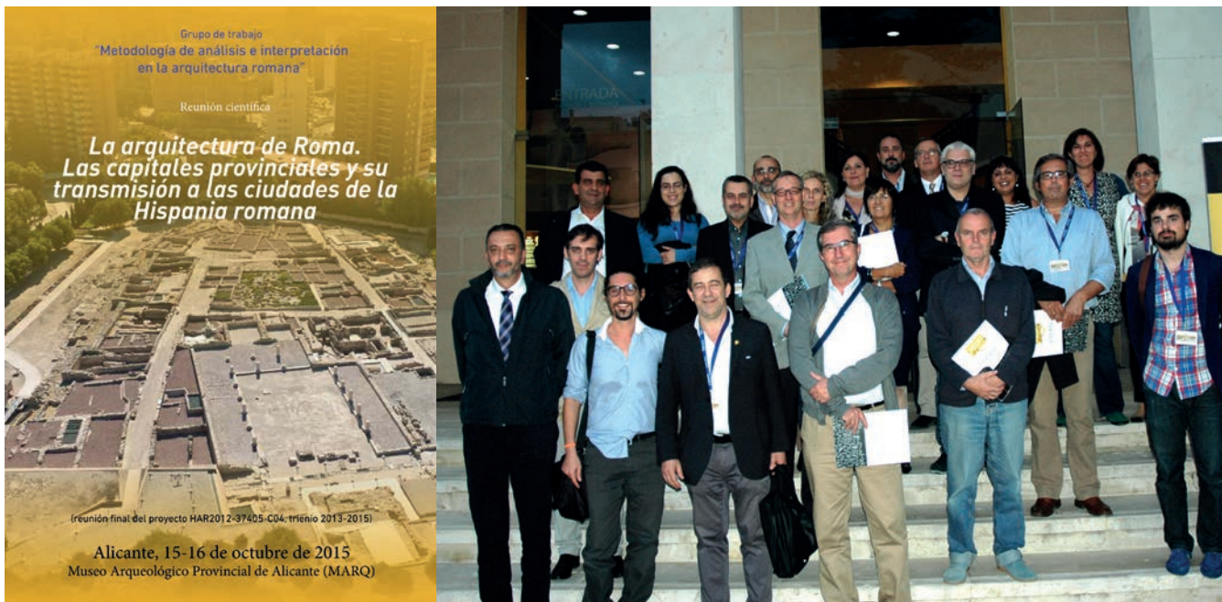
Figura 12. Ponentes de la reunión científica La Arquitectura de Roma. Las capitales provinciales y su transmisión a las ciudades de la Hispania romana celebrada en el MARQ los días 15-16 de octubre de 2015