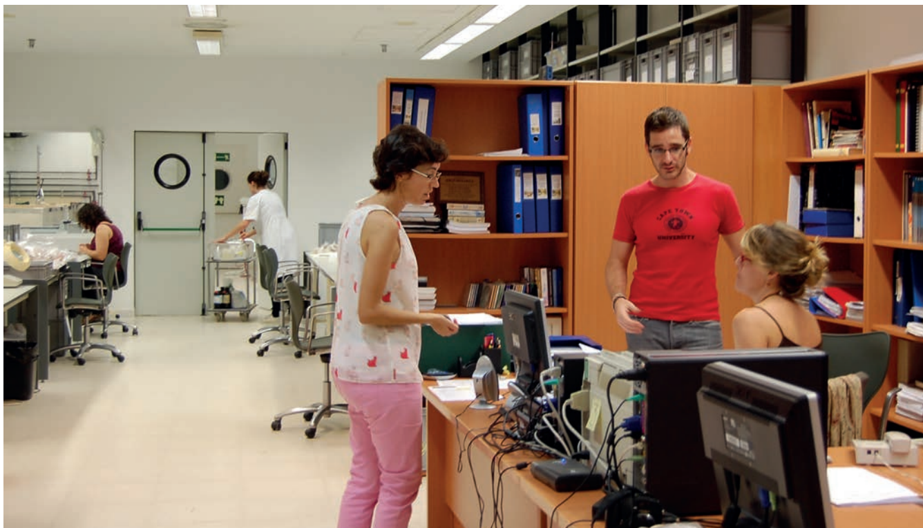
Figura 3. Área de Colecciones y Excavaciones. Departamento de Ingresos y Salidas.

cedimientos de calidad, ocupa buena parte de las tareas de los técnicos, que han revisado en este periodo un total de 550 fichas. Se ha iniciado además la revisión de las fichas correspondientes a las piezas de la exposición permanente y se han asignado nuevos números de CS a piezas seleccionadas de los armarios compactos.