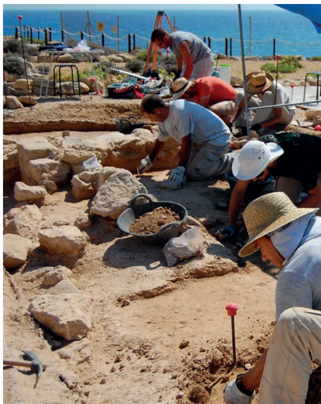
Figura 17. Excavaciones en la Illeta dels Banyets.

La intervención consistió en desbrozar la zona para visualizar las estructuras existentes y para localizar algún punto de entrada o salida de agua. A continuación se excavó el relleno arqueológico que colmataba la balsa y se procedió a la recogida de muestras para analizar en un futuro. Una vez