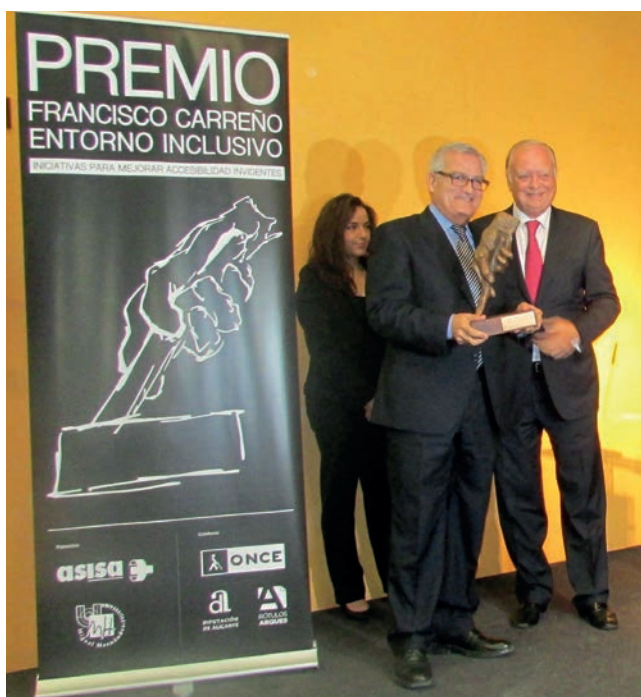
Figura 1. Concesión del I Premio Francisco Carreño.

El Departamento se ocupa del Control y Registro de las Colecciones : ingresos, salidas, ubicación, almacenaje y movi-