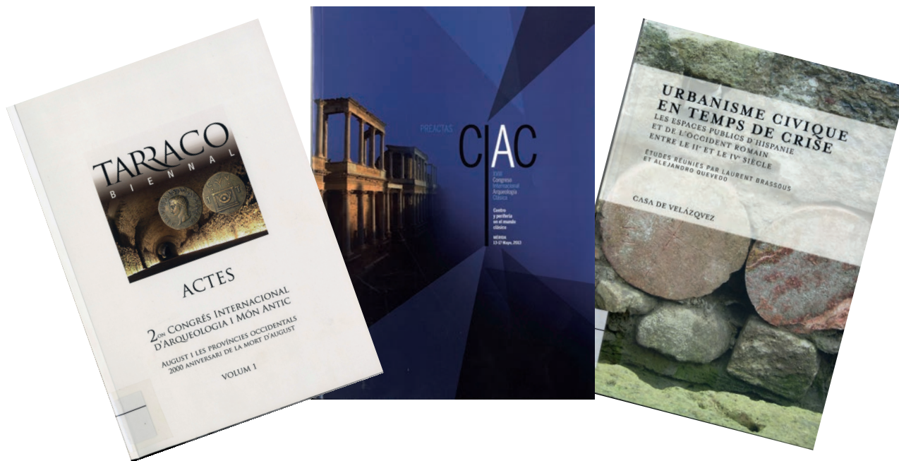
Figura 14. Publicaciones de 2015 con aportaciones científicas sobre las investigaciones de Lucentum.