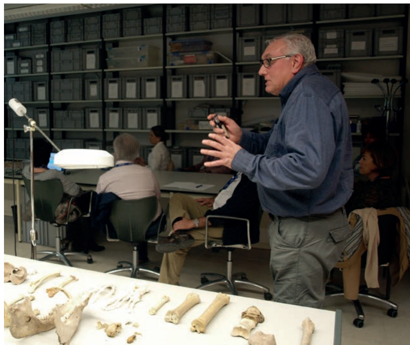
Figura 13. Los huesos también hablan. Jornadas de antropología física para profesores

Dirigido a Profesorado de Educación Infantil, Especial, Primaria y Secundaria