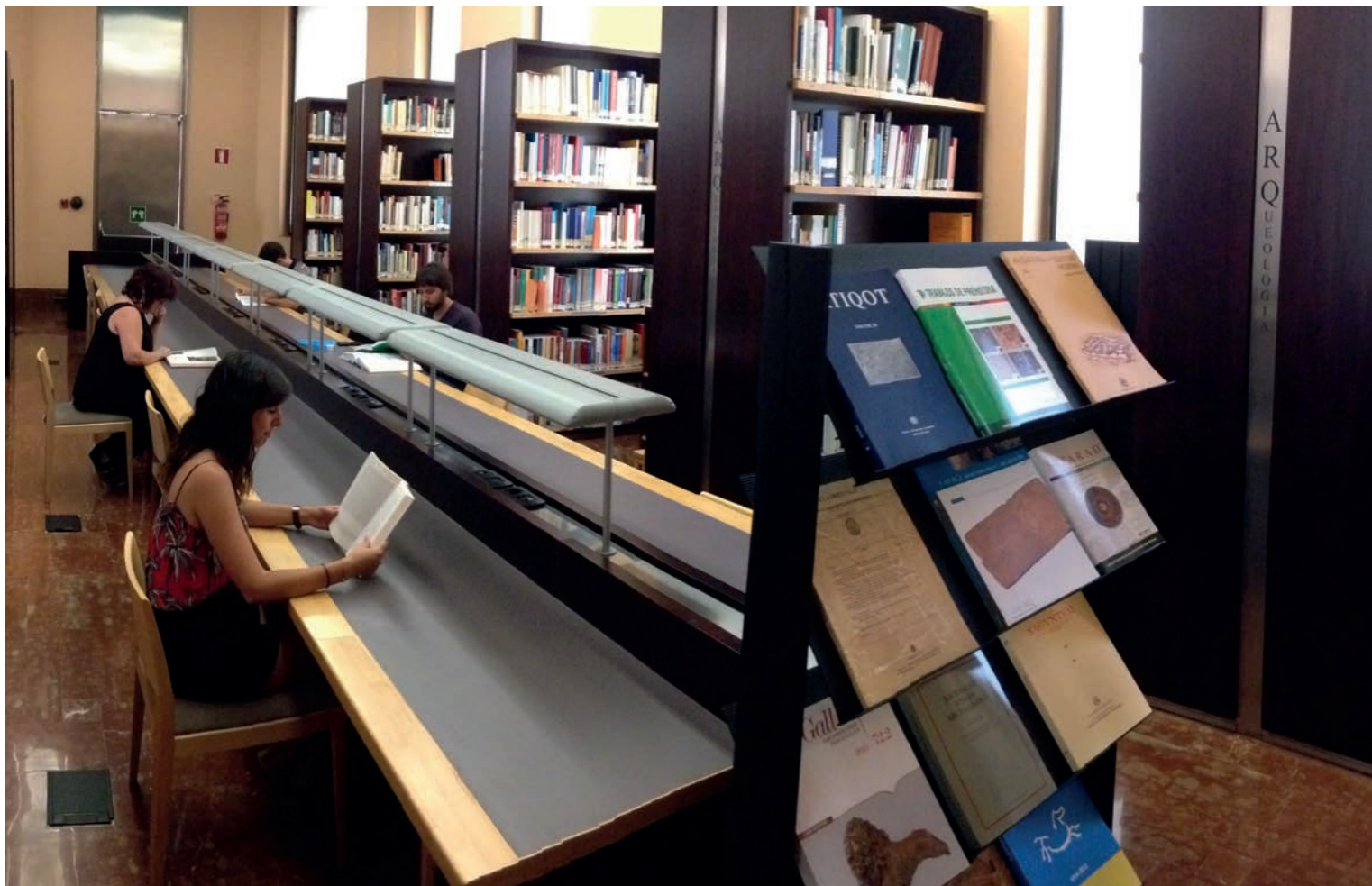
Figura 4. Sala de lectura de la Biblioteca del MARQ.

19 de ellos a memorias, Informes e Inventarios de Excavaciones.