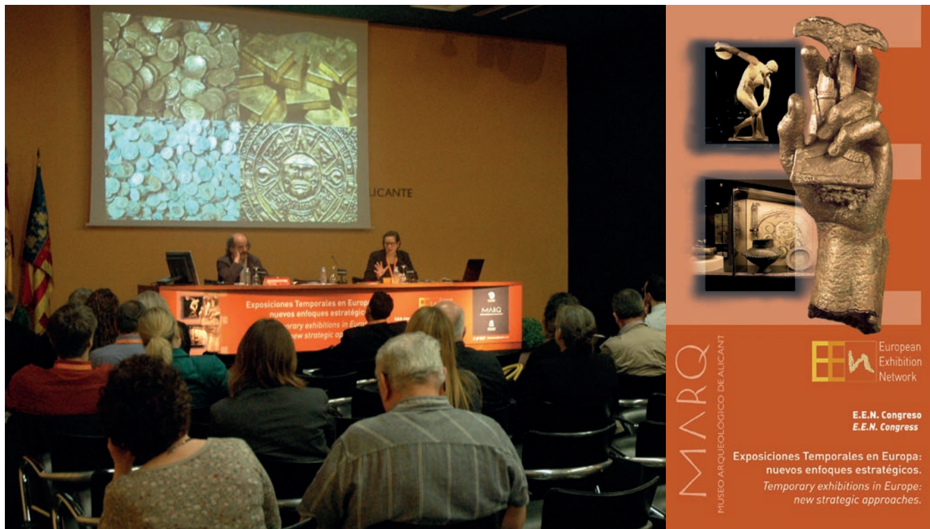
Figura 10. Congreso del European Exhibition Network (EEN) en el MARQ. Exposiciones temporales en Europa. Nuevos enfoques estratégicos.

Especialistas de instituciones universitarias (Cádiz, México, Murcia, Alicante, Barcelona, Valencia...), centros de investigación (CSIC-Consejo Superior de Investigaciones Científicas, Instituto Arqueológico Alemán...), instituciones museísticas (Museo del Louvre, Museo Estatal del Ermitage, Museo Histórico del Palatinado de Espira, Museo Arqueológico Municipal de Lorca, Museo del Teatro Romano de Cartagena, Museo de Historia Natural de Viena, Museo Drents de Assen, Centre d'Arqueologia Subaquàtica de Catalunya-CASC...), así como doctores e investigadores especializados,