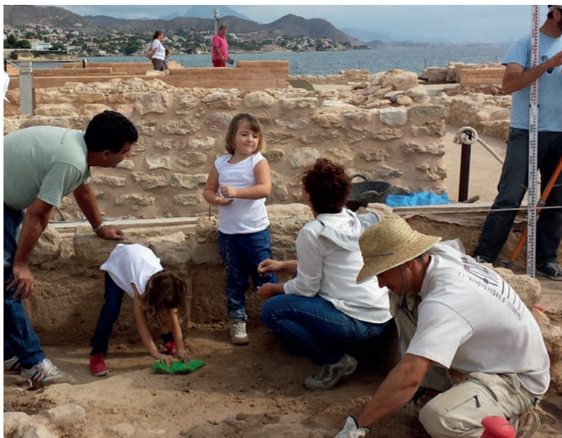
Figura 15. Illeta dels Banyets. Colaboración con la asociación APSA para elaborar un calendario para 2016.

tic «August i les províncies occidentals. 2000 aniversari de la mort d'August», Tarragona, día 25.