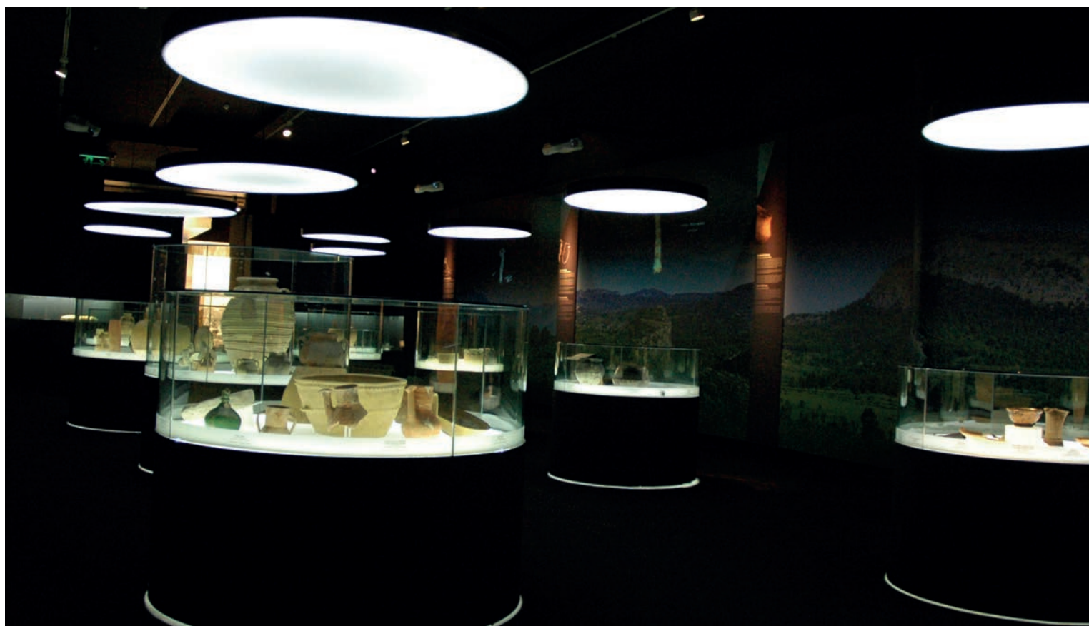
Figura 7. Exposición Cocentaina. Arqueologia i Museus .

Técnico del Museo Arqueológico Provincial de Alicante