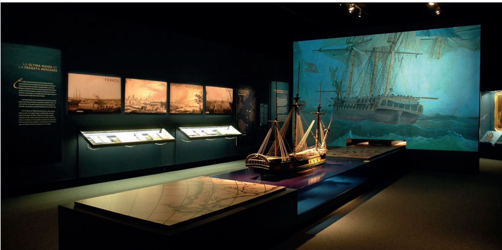
Figura 5. Exposición El último viaje de la Fragata Mercedes .

El Museo ha consolidado como línea expositiva destacada el Programa de Museos Municipales en el MARQ , una estrecha colaboración con museos de arqueología de la provincia de Alicante que ya cuenta con 12 ediciones (Crevillent, Xàbia, Novelda, Villena, Alcoi, Elda, Calp, Guardamar del Segura, La Vila Joiosa, Santa Pola, Orihuela y Cocentaina) y que contribuye a la mejora de su museografía mediante la restauración de piezas en el Laboratorio de Restauración del MARQ, la confección de paneles, producción audiovisual y catálogos que actualizan los conocimientos gene-