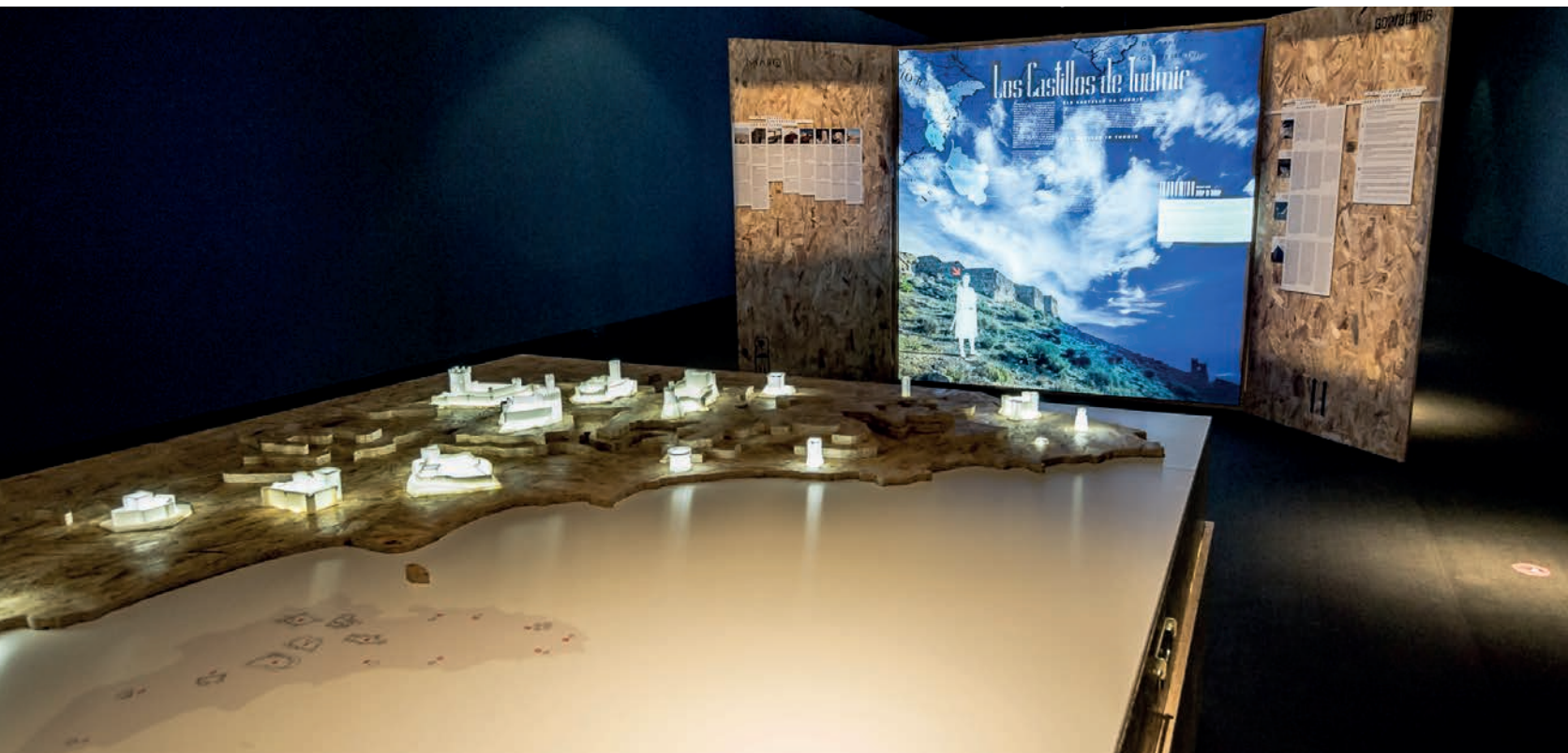
Figura 6. Exposición Guardianes de Piedra. Los castillos de Alicante .

rados por la investigación arqueológica en los territorios municipales. Asimismo, la exhibición en el MARQ de destacadas selecciones de las colecciones municipales favorece la divulgación del rico patrimonio cultural de los municipios alicantinos.