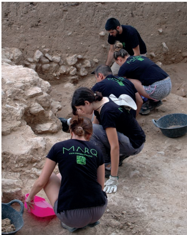
Figura 18. Excavaciones en la Puerta del Mar de Lucentum.

Se ha actuado en el área de la Puerta de Ifach, donde se ha acabado de descubrir un gran edificio de dos plantas, con ventanas geminadas en la planta superior y cubierta con arcos ojivales sostenidos por ménsulas de piedra. Actuaría como posible domus con una planta dedicada al servicio y cuerpo de guardia y una planta noble pavimentada con ladrillo. Además, se ha descubierto la primera puerta de ingreso a la pobla, de las 3 con las que cuenta el sistema de ingreso con un estado de conservación superior a los 3 metros de altura. También se ha actuado en la necrópolis donde se han descubierto nuevas tumbas y se ha definido el final del áreas funeraria, resultando un total de 57 tumbas. Por otra parte,