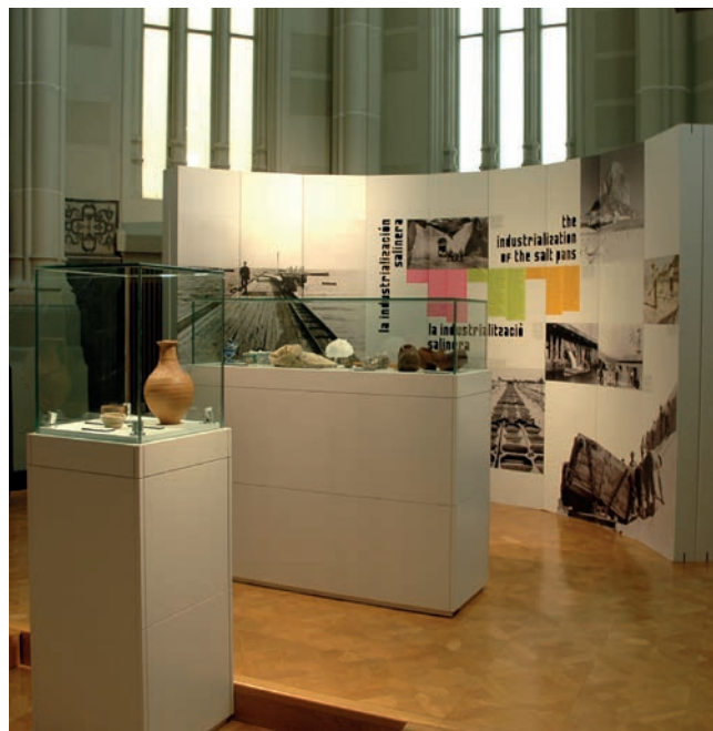
Figura 9. Exposición Alicante. Tierra y Mar de Sal.

La EEN-European Exhibition Network se constituyó en junio de 2011, en la ciudad austriaca de Linz, y está formada por un grupo de museos europeos de ámbito histórico-arqueológico que tiene como objetivo el intercambio de exposiciones, proyectos e ideas entre las distintas instituciones que lo inte-