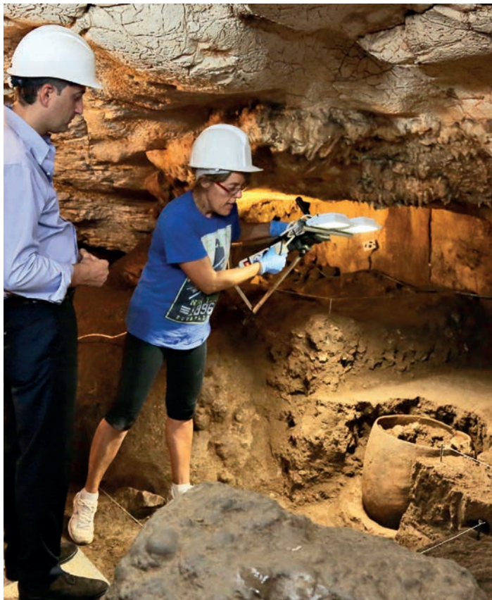
Figura 16. Descubrimiento de un recipiente neolítico en las excavaciones de la Cova del Randero de 2015.

La Illeta dels Banyets y los viveros romanos de la costa mediterránea española. Cuestión de Conservación. MARQ. Museo Arqueológico de Alicante: Diputación Provincial de Alicante.