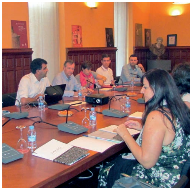
Figura 11. Workshop sobre los Contextos de destrucción de la IIª Guerra Púnica.

LA ARQUITECTURA DE ROMA, LAS CAPITALES PROVINCIALES Y SU TRANSMISIÓN A LAS CIUDADES DE LA HISPANIA ROMANA.