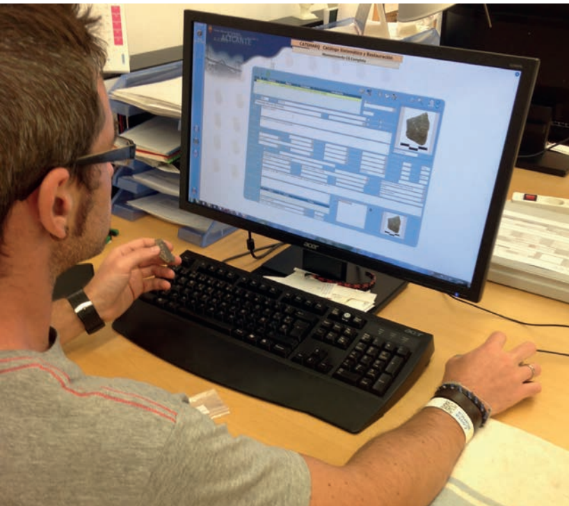
Figura 2. Elaboración de las fichas del Catálogo Sistemático del MARQ.

mientos de los fondos arqueológicos, ejerciendo una gestión normalizada de sus actividades mediante procedimientos de calidad, que ha permitido la realización de mejoras en los trabajos desempeñados y en su documentación. A este departamento corresponde la gestión de los Almacenes, trasladando en este periodo 240 cajas a formatos normalizados, para optimizar su labor, actualizando los estadios de los Armarios Compactos, del almacén Anforario, un espacio de almacenaje diseñado para las piezas de gran volumen difíciles de ubicar en espacios estandarizados, y del almacén Fondo Histórico, y redactando un informe sobre la situación actual del espacio para albergar material arqueológico en las distintas salas de almacenes del MARQ. En este periodo se gestionó el ingreso de 270 cajas provenientes de 15 yacimientos arqueológicos de la provincia, además de otros dos provenientes de cesión/donación, así como los movimientos internos de 112 piezas. También se han atendido la cesión de 2 piezas a sendas instituciones y la de 297 piezas destinadas a 7 exposiciones.