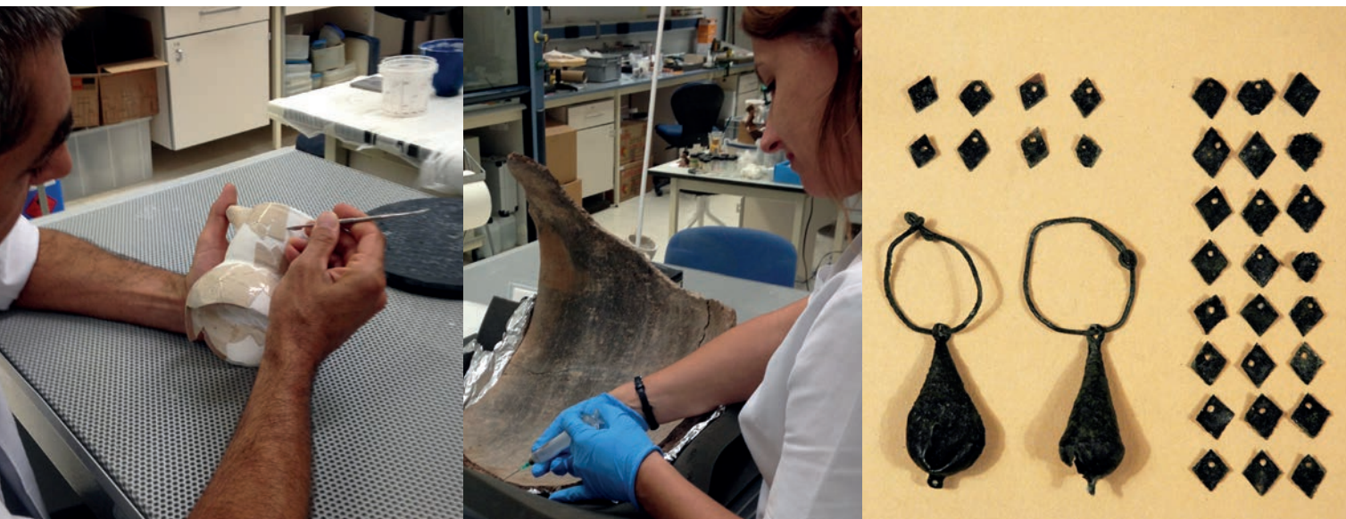
Figura 20. Trabajos de restauración de materiales arqueológicos de la provincia

un código abierto. El uso generalizado de smartphones y tablets y la capacidad que estos tienen de leer los códigos QR mediante la instalación de una aplicación ha abierto un nuevo mundo de posibilidades.