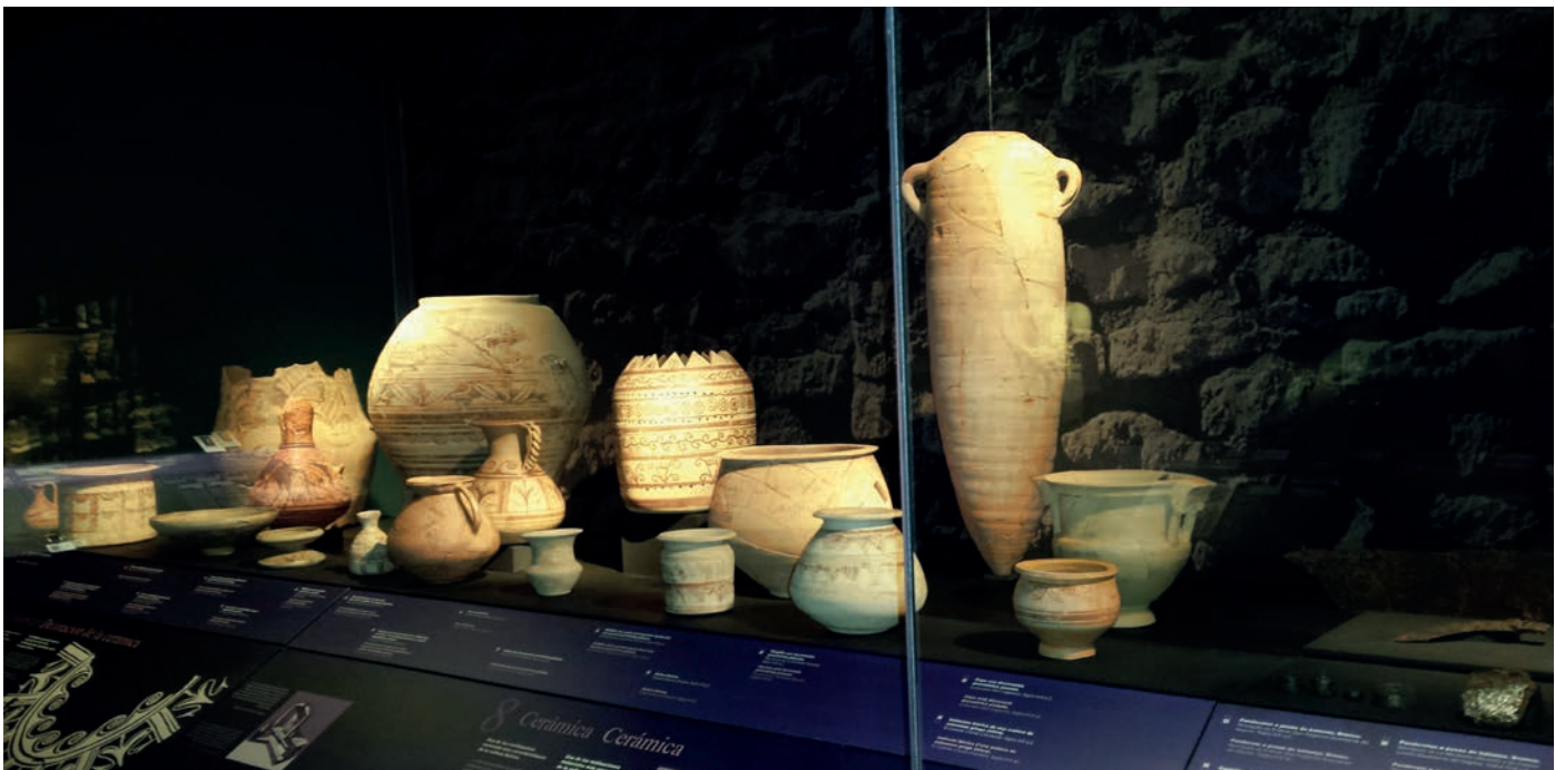
Figura 1. Nueva iluminación LED en una de las vitrinas de la exposición permanente del MARQ. Sala de iberos.

La Diputación Provincial de Alicante está particularmente implicada en el fomento y preservación, para el disfrute público, de los yacimientos arqueológicos y monumentos alicantinos, bajo su titularidad o la de terceros. La investigación e interpretación de los restos, y la valorización de los mismos mediante intervenciones para su conservación y accesibilidad persigue la transformación de estos recursos históricos y monumentales en productos culturales y turísticos rentables para la sociedad. En este convencimiento, la Institución provincial, a través de las Áreas de Arquitectura (Unidad Orgánica 33) y Cultura (Unidad Orgánica 21), y ésta a través del MARQ (Unidad Orgánica 35), establece, como objetivo esencial de la cooperación con la Fundación MARQ, la garantía de recuperación, investigación, conservación y accesibilidad para el conocimiento y disfrute social de los yacimientos arqueológicos. La red de yacimientos arqueológicos y monumentos alicantinos engloba aquellos que son de su titularidad: el Tossal de Manises/Lucentum, en Alicante y La Illeta dels Banyets en El Campello, así como los monumentos Torre de Almudaina y Cava Gran de Agres. Además colabora con el Ayuntamiento de Castell de Castells en la preservación y difusión del Conjunto de Arte Rupestre Prehistórico del Pla de Petracos y con el Ayuntamiento de la Torre de les Maçanes en la puesta en valor del conjunto fortificado islámico y su entorno, adecuándolo para la visita pública.