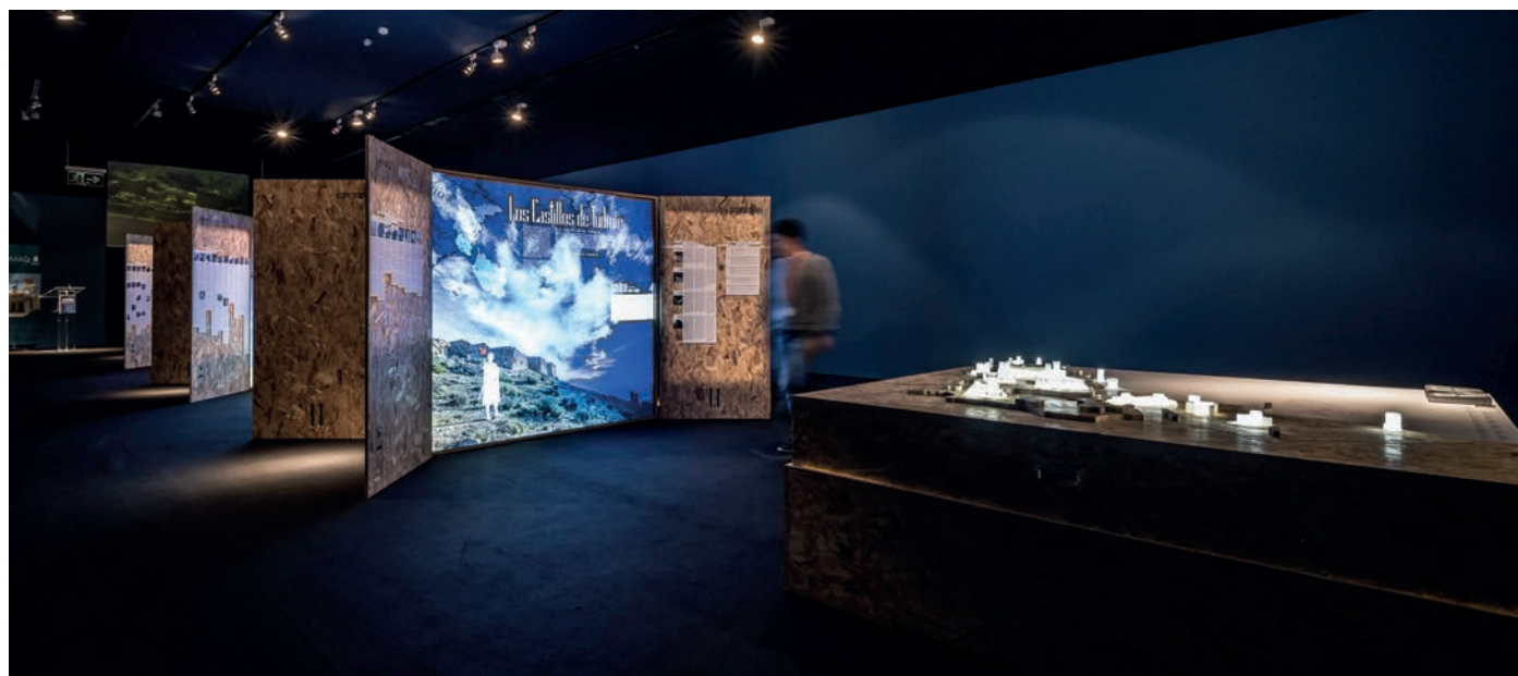
Figura 7. Vista de la exposición "Guardianes de Piedra. Los castillos de Alicante" realizada en el MARQ.