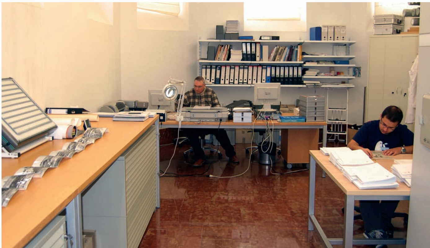
Figura 3. Archivo Documental y Técnico del MARQ.

de la Sala Edad Moderna y Contemporánea de la exposición permanente del MARQ.