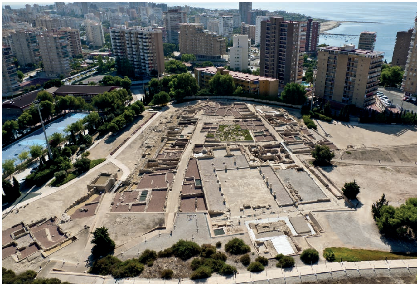
Figura 4. Vista aérea del parque arqueológico del Tossal de Manises/ Lucentum .

Además de ocuparse de la visita de alumnos de grado y de Máster, han atendido otras visitas relacionadas con la divulgación del yacimiento: