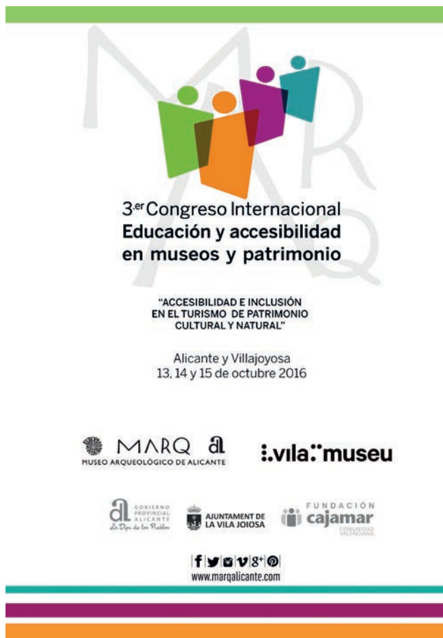
Figura 10. Cartel del 3er Congreso Internacional de Educación y Accesibilidad en Museos y Patrimonio, celebrado en el MARQ (13-15 de octubre de 2016).

Congreso EEN. Exposiciones Temporales en Europa: nuevos enfoques estratégicos. Museo Arqueológico de Alicante: MARQ (7-8 de mayo de 2015)/EEN Congress. Temporary Exhibitions in Europe: New Strategic Approaches. Archaeological Museum of Alicante: MARQ (May 7th-8th 2015). A. BIRNIE, J. A. SOLER DÍAZ y M. H. OLCINA DOMÉNECH (ed.).