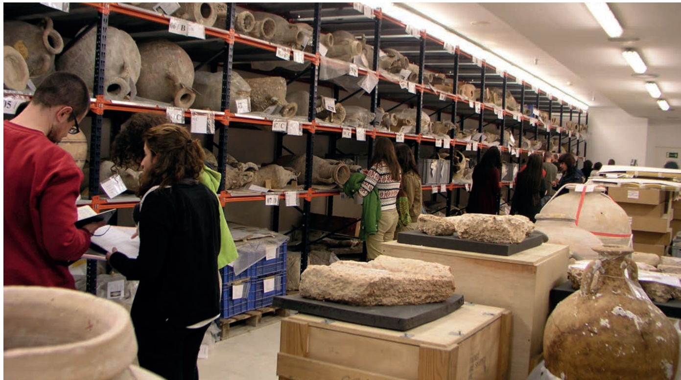
Figura 14. Visita a los almacenes del MARQ realizada en el marco del Curso de Formación para Conservadores y Ayudantes de Museos organizado por la Subdirección de Museos Estatales.

arquitectura, obras de arte, monumentos y sitios históricos, museos... El MARQ participó con el respaldo y promoción de las propuestas relacionadas con la difusión del patrimonio, desarrolladas principalmente por centros educativos a lo largo del curso, integrando en esta campaña la celebración en octubre del Día de la Comunidad Valenciana (50 participantes) y los juegos y rutas por las exposiciones del MARQ Patrimonio y Comunidades (160 participantes).