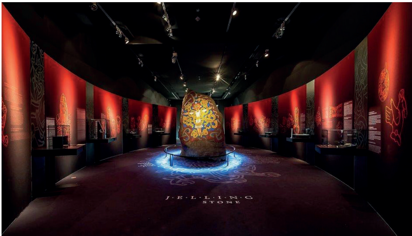
Figura 6. Sala 3 de la exposición "Vikingos. Guerreros del Norte. Gigantes del Mar".

arqueológicos, yacimientos gestionados directamente por la Diputación de Alicante: el Tossal de Manises y La Illeta dels Banyets y vinculados al museo desde sus orígenes, han aportado interesantes novedades científicas y monumentales.