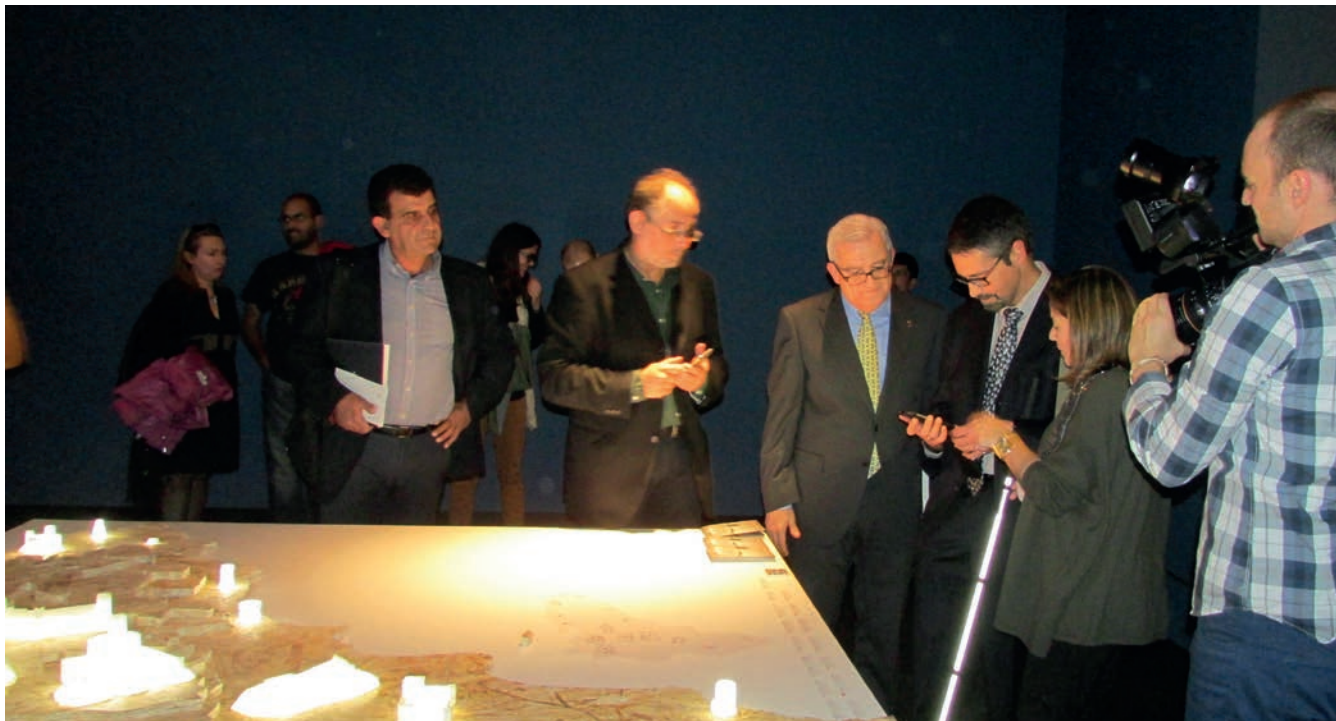
Figura 12. El director del CRE de la ONCE de Alicante comprobando la accesibilidad en la exposición "Guardianes de Piedra".

sos, o números monográficos de las mismas de especial interés para los investigadores.