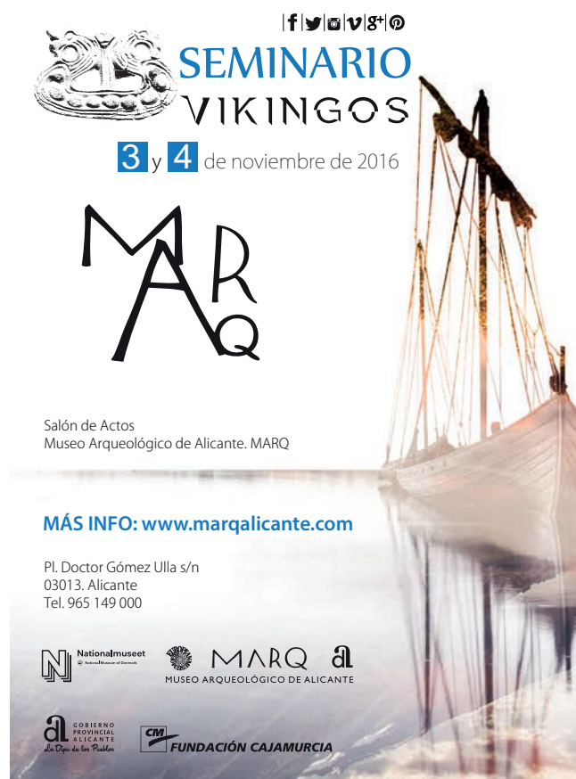
Figura 11. Cartel del seminario "Vikingos. Guerreros del Norte. Gigantes del Mar", celebrado en el MARQ (3-4 de noviembre de 2016).