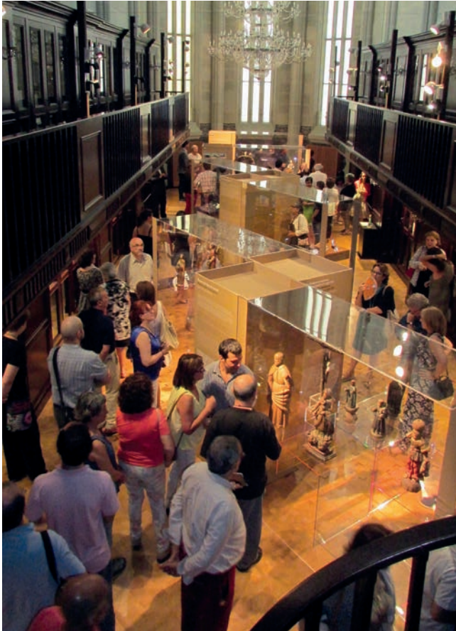
Figura 8. Exposición "Uruguay en Guaraní. Presencia indígena misionera" realizada en la Biblioteca del MARQ.

MARQ Museo Arqueológico de Alicante - Diputación de Alicante - Fundación CV MARQ.