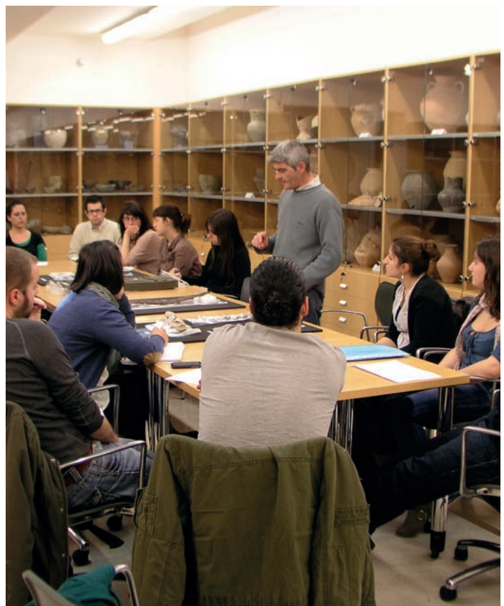
Figura 13. Clase práctica del máster de Arqueología Profesional y Gestión Integral del Patrimonio realizada en el Almacén de Investigadores del MARQ.