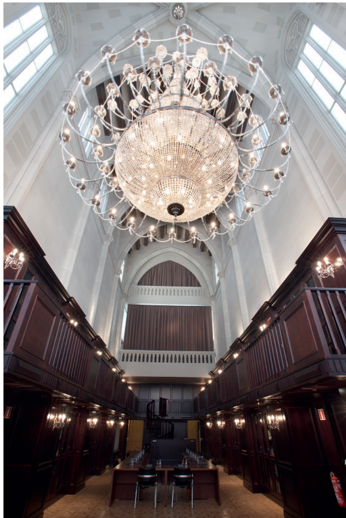
Figura 9. Vista de la Sala Central de la Biblioteca del MARQ.

MARQ Museo Arqueológico de Alicante - Diputación de Alicante - Fundación CV MARQ - Fundación Banco Sabadell - Ayuntamiento de Ayuntamiento de Cocentaina.