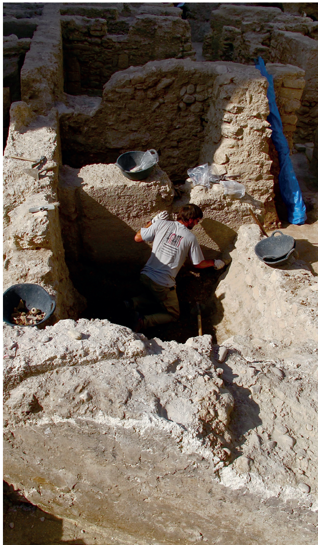
Figura 6. Vista de la excavación Plaza de la Fruta 14 de Elche, en el año 2014.

tivas licencias de obras, lo que supuso un cambio sustancial en la visión que de la arqueología tenían desde el ámbito empresarial, llegando a incorporarse como un proceso evaluable en costes y tiempo integrado en la dinámica general de la edificación.