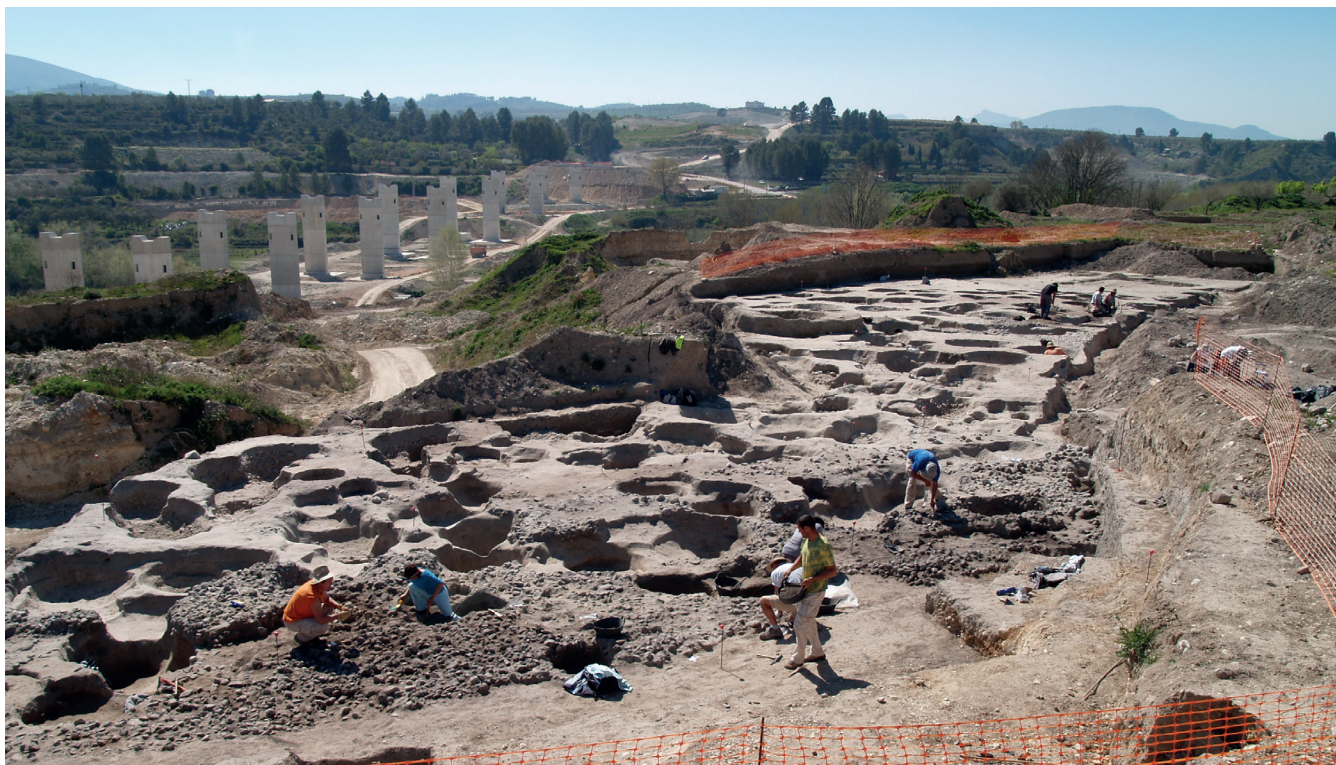
Figura 1. Vista general de la excavación del yacimiento de Benamer de Muro de Alcoí en el ámbito de la Autovía Central, en el año de 2009.

los gaseoductos, tanto en sus troncos principales como los ramales secundarios, oleoductos, los trasvases, la mejora y sustitución de los sistemas de riego, los tendidos eléctricos, las instalaciones de redes de comunicaciones, los parques eólicos y los paseos marítimos entre otros.