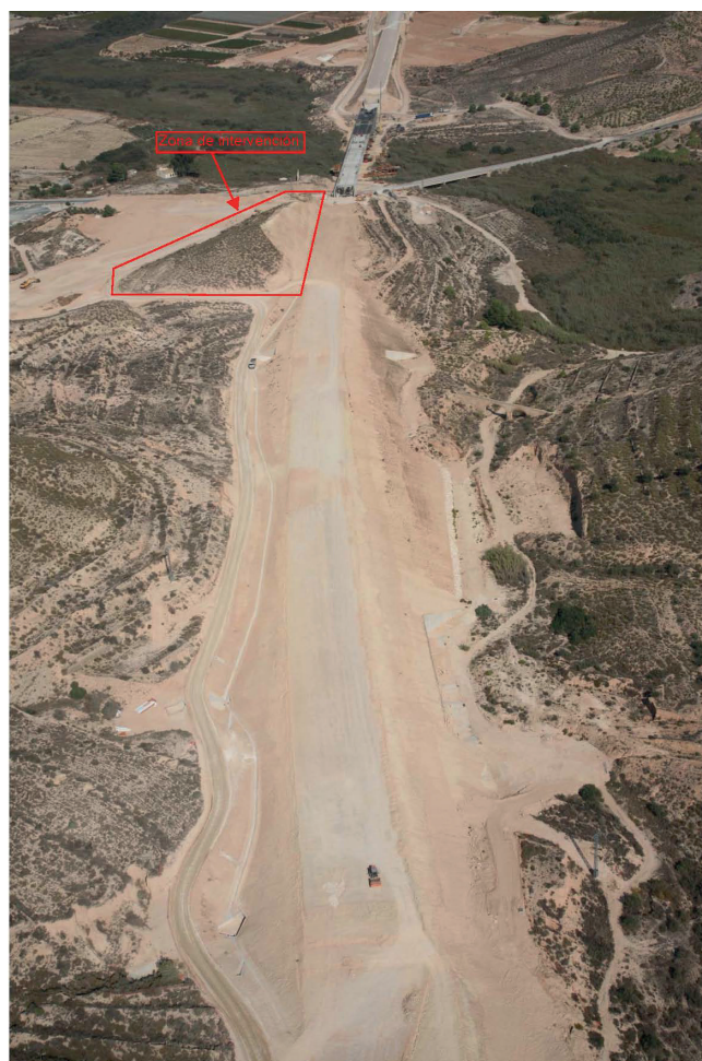
Figura 2. Vista aérea del seguimiento arqueológico del tramo del Ave Monforte del Cid a Aspe a su paso por el Barranco de Coca, en Aspe, en el año 2013.

El artículo 47, sobre la formación de los catálogos de bienes y espacios protegidos, en el que establece que deben ser redactados por equipos pluridisciplinares en cuya composición participarán necesariamente titulados superiores en las disciplinas de arquitectura, arqueología, historia del arte y etnología que garanticen la solvencia técnica de los trabajos.