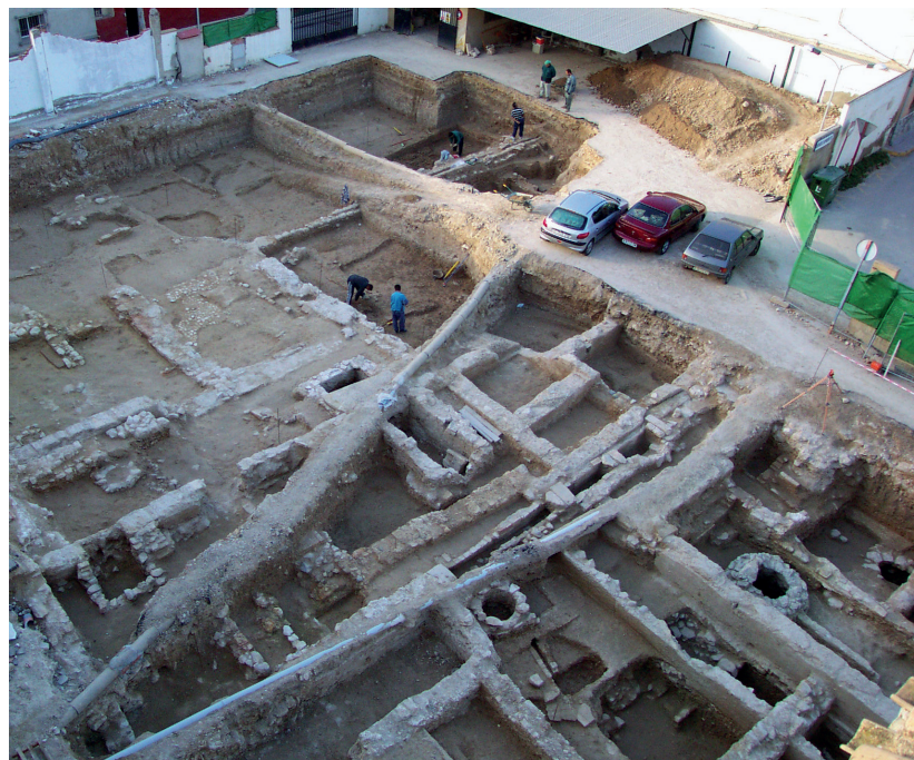
Figura 4. Vista de la excavación del Patio del Palacio del Marqués de Arneva de Orihuela, en el año 2000.

Entre las acciones pendientes está, por una parte, el ofrecer al público en general la consulta en línea, necesaria para que la sociedad se beneficie de todo el trabajo realizado y se cumpla con la política de simplificación de procedimientos administrativos de la Generalitat Valenciana. Y por