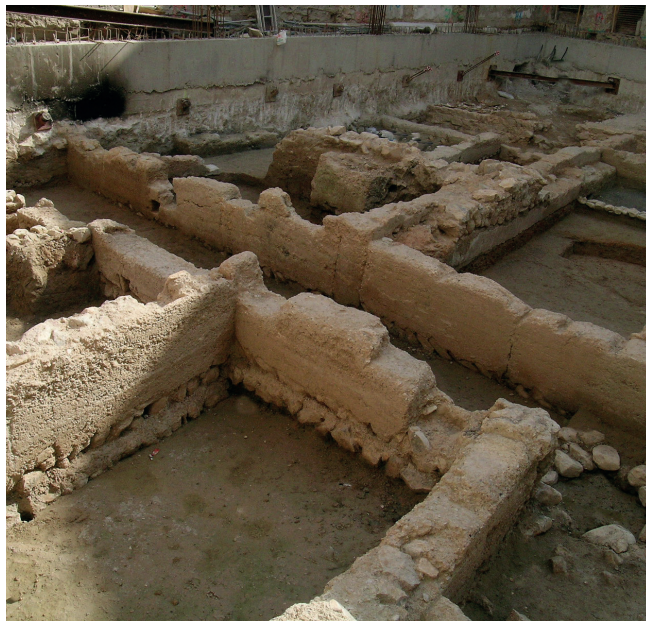
Figura 7. Vista de la excavación en la Calle Calderón de la Barca 14 de Orihuela en el año 2009.

mento en los costes de reparación y edificación. Es en estos pequeños núcleos urbanos donde actualmente existe un mayor peligro de desaparición y destrucción del patrimonio arqueológico, el cual por su reducido tamaño y por su menor entidad tienen una mayor probabilidad de desaparecer para siempre. Para ello habrá que adoptar mecanismos diferentes a los previstos legalmente en la actualidad, pues la figura del promotor tiene un significado muy diferente a la que habitualmente hemos estado acostumbrados, y solo mediante programas de colaboración y cooperación financiera se podrá actuar en la dirección correcta.