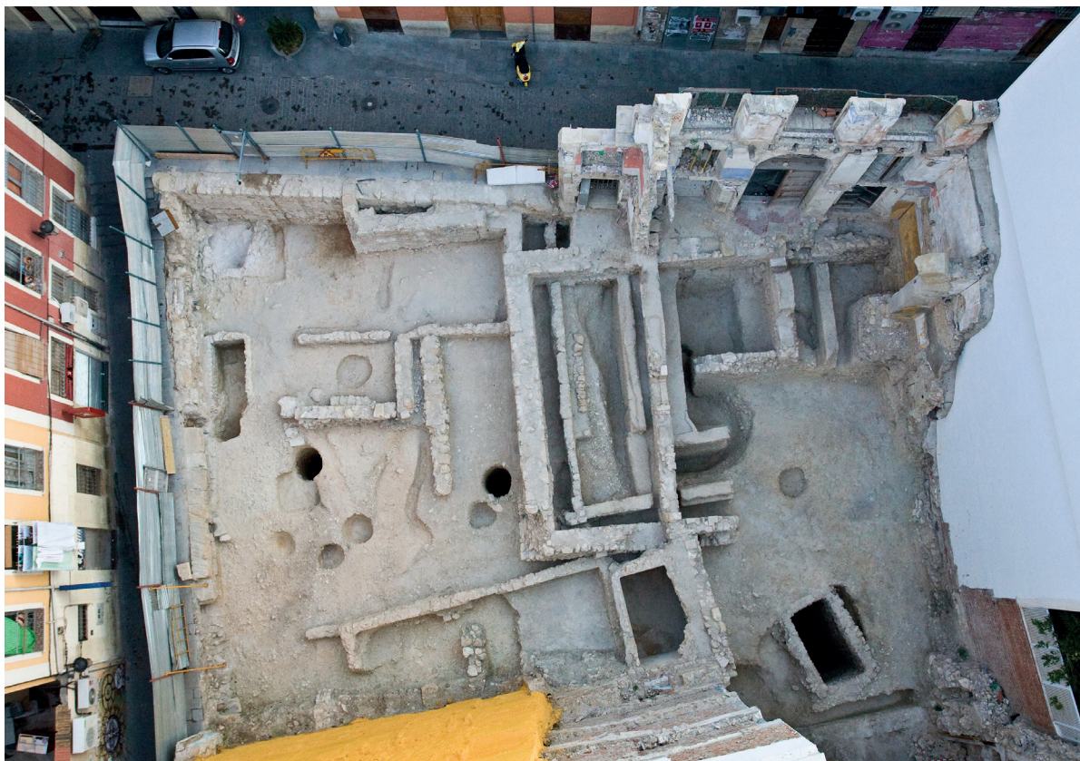
Figura 5. Vista de la excavación Calle Virgen Belén nº10 de Alicante en el año 2007.

cia de obras en los solares de los cascos históricos o zonas arqueológicas delimitadas en los planeamientos, hasta los planes parciales de varios millones de metros cuadrados, pasando por los planes generales, los catálogos de bienes y espacios protegidos y los estudios de impacto ambiental, tanto terrestres como marítimos. Fue sin lugar a dudas un frenesí que se tuvo que afrontar con los medios técnicos y humanos disponibles en el servicio territorial de cultura de Alicante, que solo esta formado por un arqueólogo, por lo que la firme convicción personal de que era necesario confiar en el buen criterio y profesionalidad de los directores de las intervenciones, se torno en una necesidad imperiosa que con el paso de los años se ha mostrado como el mejor camino en el profesionalización de las direcciones técnicas y en la constatación del grado de compromiso ético de la gran inmensa mayoría de la profesión, frente a aquellos que presagiaban y auguraban la falta de criterio de los directores ante las presiones de los poderes fácticos y empresariales, la codicia económica y la relajación ética.