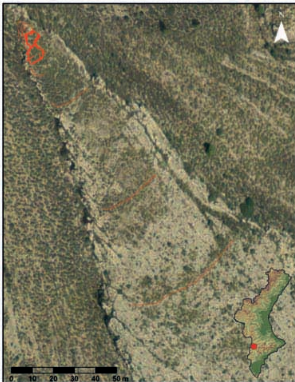
Figura 1. Localización del asentamiento e indicación de las estructuras murarias.

tro pequeños vasos. De la cueva occidental se recuperaron los restos de 2 individuos adultos a los que debe asociarse un ajuar compuesto por una punta de flecha de sílex, varias cuentas de collar (una sobre Dentallium y dos sobre mineral verde), un arete de plata y varios fragmentos cerámicos pertenecientes a un pequeño vaso.