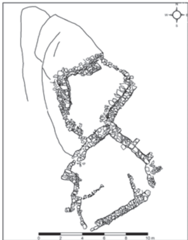
Figura 2. Estructuras definidas en la terraza superior.

social en la cuenca del Vinalopó ” financiado por la Universidad de Alicante y “ Espacio y Tiempo: el horizonte campaniforme en las comarcas meridionales valencianas ” (GV/2013/002) financiado por la Conselleria d’Educació, Cultura i Esports de la Generalitat Valenciana.