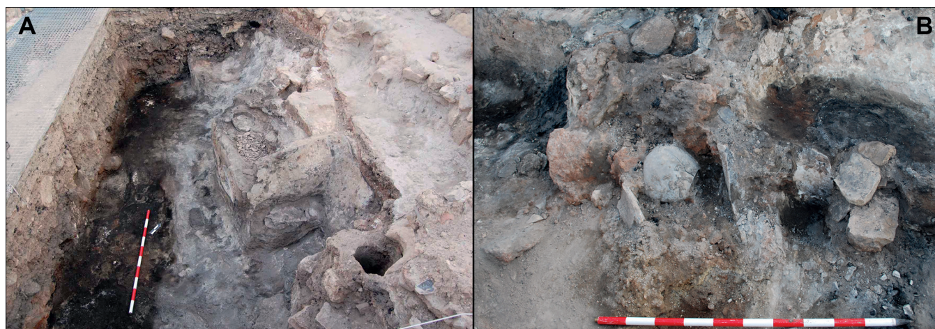
Figura 2. Departamento XXVII. A.- Banco central durante el proceso de excavación. B.- Banco adosado con materiales caídos sobre pavimento.

departamento, aunque más próxima al muro sur, apareció una pequeña cubeta de tendencia subcircular con unas medidas conservadas de 40 x 28 cm.