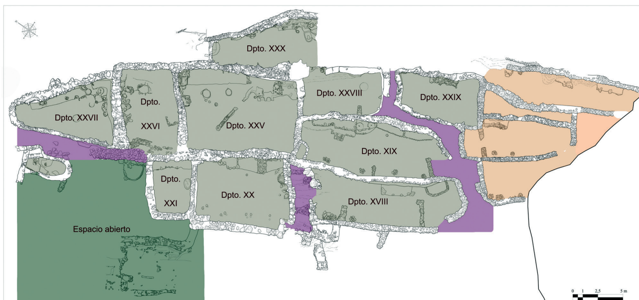
Figura 1. Planta general del yacimiento.

Los trabajos emprendidos en este sector del yacimiento permitieron definir, tras la retirada de la capa vegetal y de