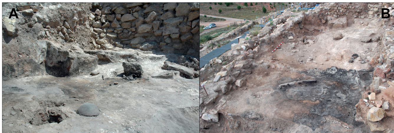
Figura 4. Departamento XXIX. A. Fase antigua con bancos y materiales sobre pavimento en sector Oeste. B.- Estructuras asociadas a la fase antigua en el sector Este.

suelo, ya que se encuentra a una cota más baja que la zona Oeste. El tabique sólo alcanza la mitad del departamento y, junto a un banco de unos 15 cm de altura, forma un pequeño espacio en esquina que muy probablemente estuvo destinado al almacenaje de productos y materiales contenedores o de trabajo. Así parecen indicarlo la elevada concentración de restos de recipientes cerámicos (la mayoría de tipo contenedor cuyos tipos y acabados más groseros contrastan con los de la otra zona), la presencia de semillas de cereal (inexistentes en otras áreas de la vivienda) y la existencia de fibras vegetales sin trabajar. Junto a la zona de almacenaje se ubica una cubeta hundida u hogar, rodeada parcialmente por un borde de barro, que podría señalar que este espacio también se dedicó a las actividades culinarias o relacionadas con el fuego.