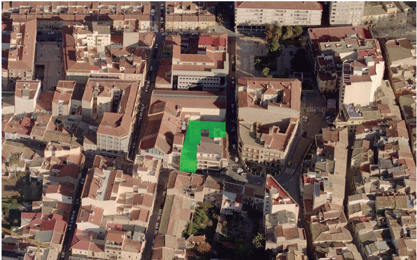
Figura 1. Localización del solar en el núcleo urbano de Petrer.

autonómica en materia de patrimonio cultural. A pesar de ello, por la proximidad al área protegida y ante la posibilidad de que aparecieran restos de los que no se tuviera constancia, desde el Museo Dámaso Navarro se realizaron visitas periódicas a los trabajos de excavación del sótano del futuro edificio. Durante las primeras semanas no se apreció ninguna afección a restos patrimoniales, hasta que a finales de septiembre se pudo observar en el perfil norte del terreno cómo existían estratos de tierra que por su tonalidad y composición pudieran ser arqueológicos. Comprobados estos restos se confirmó que era un vertedero o basurero excavado en el terreno, relleno de tierra y materiales de cronología romana (ladrillos, tejas, fragmentos de plato, ollas, etc.).