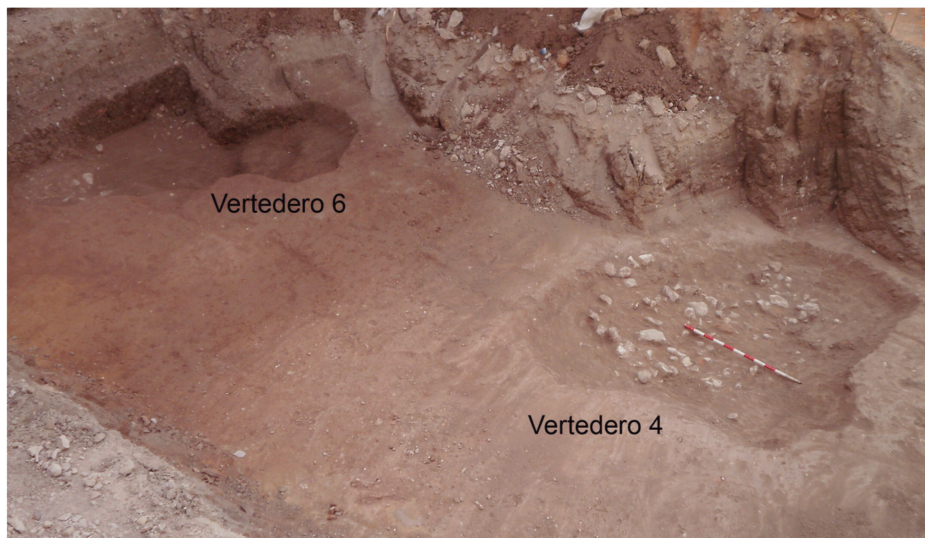
Figura 3. Proceso de excavación de los vertederos 4 y 6.

jando el terreno, varios pozos circulares de aproximadamente un metro de diámetro. En uno de ellos, junto a restos de escombros, aparecieron botellas de vidrio de refresco de zarzaparrilla de la marca 1001 y una botella de café licor de la marca Martínez, de Alcoy. Ambas bebidas eran habituales en la década de los sesenta y setenta. Además de los pozos, otros elementos que se identificaron fueron dos cubetas rectangulares, una de ladrillo y otra de piedra. Estas estructuras se utilizaban de basurero hasta la década de los setenta del siglo pasado.