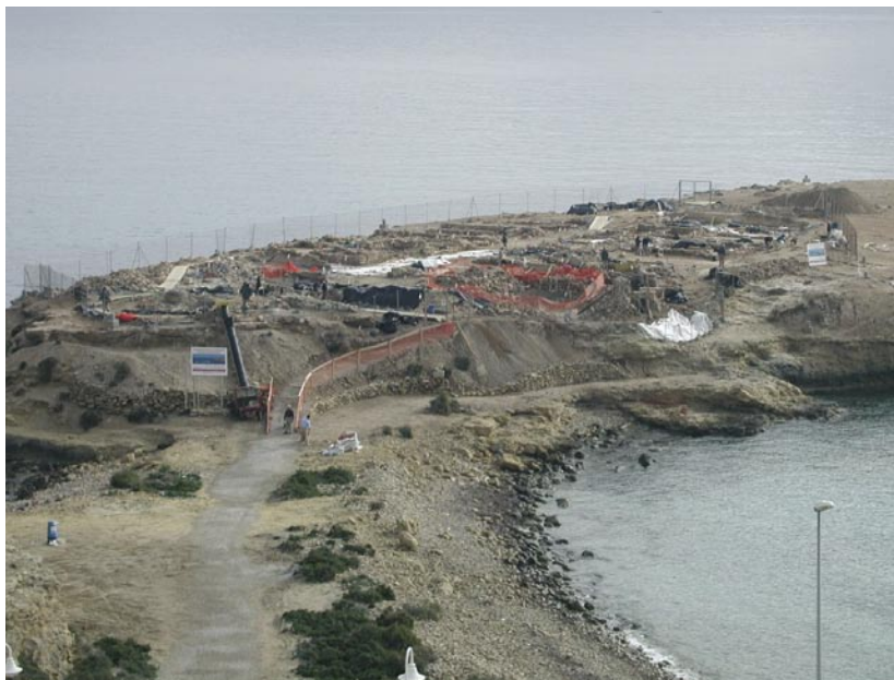
Figura 14. Vista general de los trabajos de excavación y restauración de la Illeta dels Banyets, El Campello, Alicante.

Con el montaje de la Sala de Arte Rupestre, bajo la dirección del arqueólogo Jorge A. Soler Díaz y el arquitecto Rafael Pérez Jiménez, se consigue vincular del todo al municipio de Castell de Castells con el santuario neolítico. Éste, se completó con la inauguración asimismo de la exposición de la colección museográfica de etnología del Ayuntamiento de Castell de Castells. Hasta finalizar el año 2003 había recibido 1.753 visitantes.