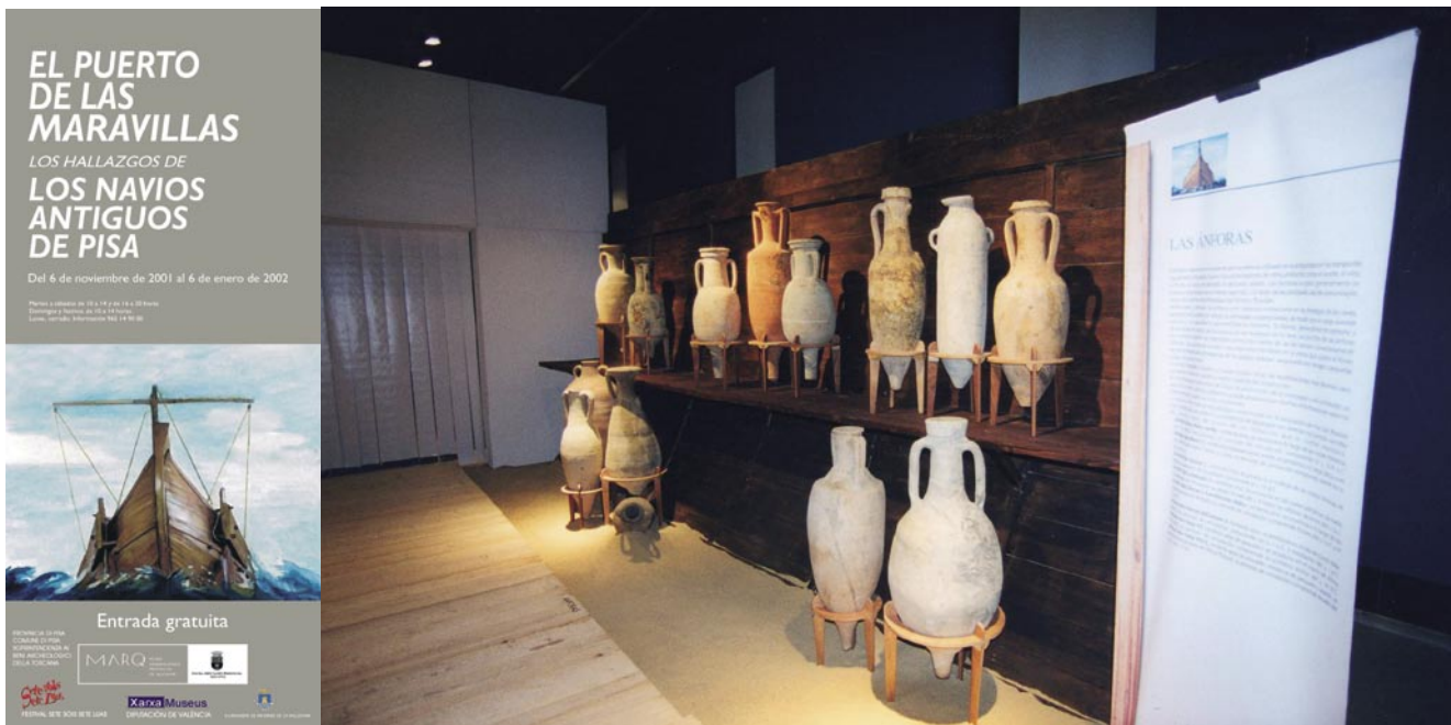
Figura 6. Exposición "El Puerto de las Maravillas. Los hallazgos de los antiguos."

de realizar intercambios culturales. Recoge el resultado de unos trabajos centrados en el yacimiento subacuático más importante del momento. Esta exposición, es la primera muestra internacional que el MARQ acoge, con el objetivo de continuar en esta línea de intercambios culturales con otros países del Mediterráneo.