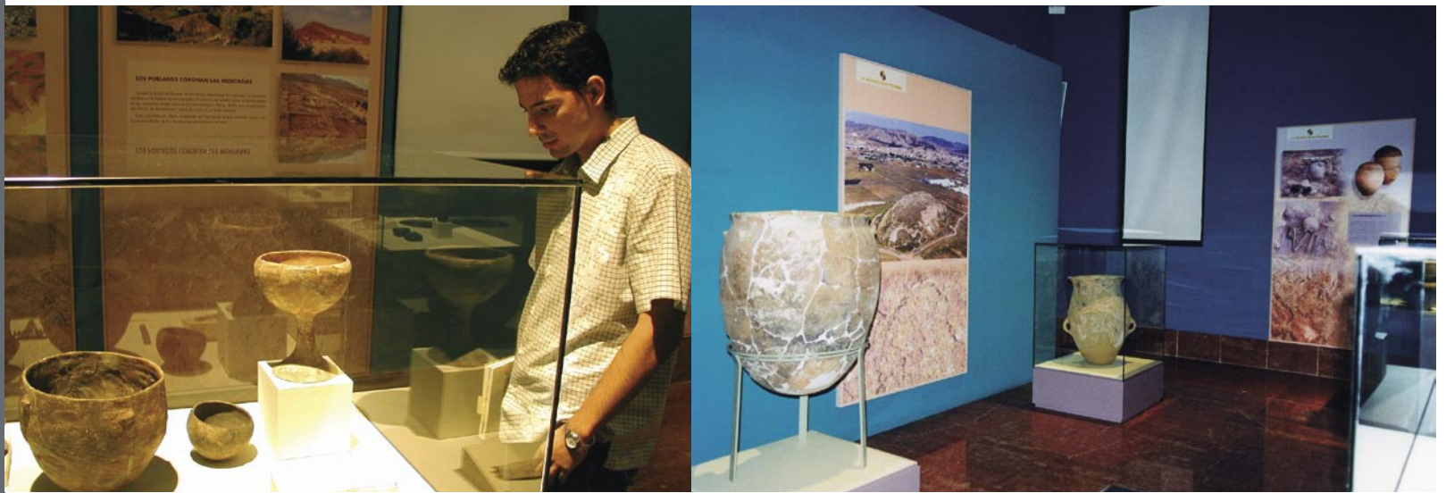
Figura 5. Exposición "...Y acumularon tesoros. Mil años de historia en nuestras tierras".

cultura ibérica. Se ofrecía una amplia panorámica de la cultura material de las distintas sociedades que convivieron durante ese periodo, dedicando una especial atención a la Cultura Argárica y a la Cultura del Bronce Valenciano.