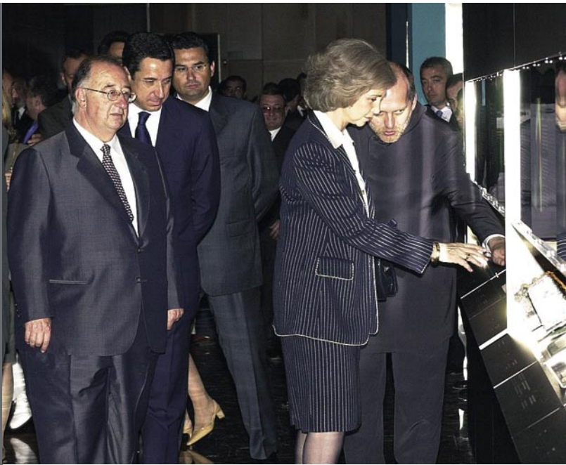
Figura 1. S. M. la Reina Doña Sofía en una de las salas del MARQ durante su visita inaugural al museo.

Pero aquí no acabaría el proyecto técnico que nos permitía contar por vez primera con cuatro salas de exposición permanente -Prehistoria, Cultura ibérica, Cultura romana y Edad Media-, harán falta, casi dos años más para completarlo.