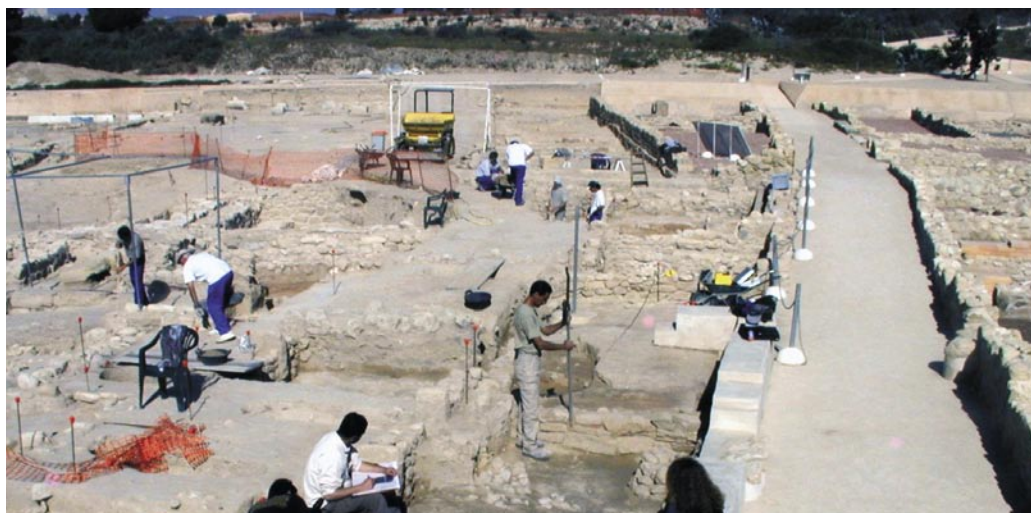
Figura 15. Vista general de los trabajos de excavación y restauración en el Tossal de Manises, antigua ciudad romana de Lucentum .

del Estado) consistentes en excavar, restaurar, consolidar y musealizar el mismo. El proyecto se ha llevado a cabo conjuntamente entre el Área de Arquitectura de la Diputación de Alicante y el MARQ.