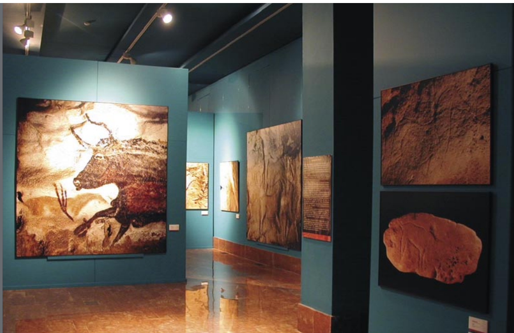
Figura 7. Exposición "Nacimiento del Arte en Europa".

del Tossal de la Roca en Vall d'Alcalá, de la cova del Parpalló en Gandía y del abric d'En Melia de Castellón.