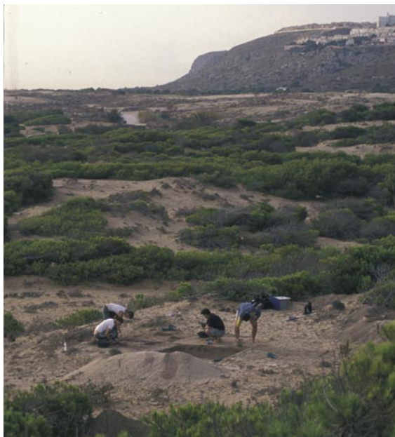
Figura 16. Actuaciones arqueológicas en la Playa del Carabassí (Elche, Alicante).

prospecciones en la playa del Carabassí y el Clot del Galvasny, en dos ámbitos diferentes del área en estudio.