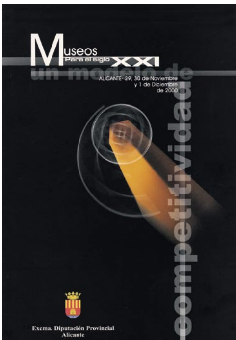
Figura 11. Cartel anunciador de las jornadas Museos para el siglo XXI. Un modelo de competitividad , celebradas en el MARQ en noviembre de 2000.