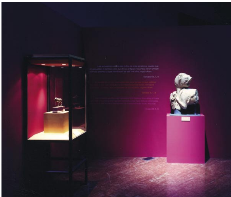
Figura 2. Exposición "Argantonio, Rey de Tartessos".

Comunidad Valenciana MARQ, ha propiciado, entre otras muchas cuestiones, la realización de numerosas actividades a lo largo de este periodo 2000-2003, que, a continuación se describen, de manera somera.