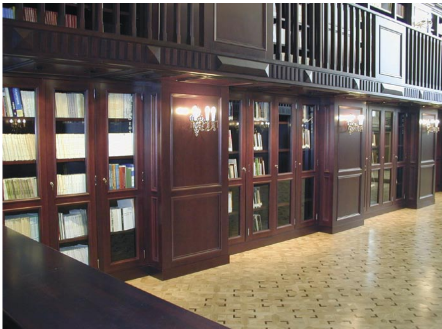
Figura 20. Detalle de la Sala Central de la Biblioteca del MARQ.

Además, se trataron en el Taller de Restauración del MARQ un número sin determinar de piezas de otros yacimientos y de los fondos del Museo.