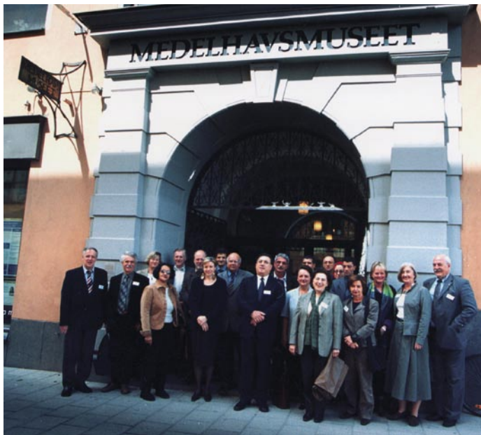
Figura 23. Segunda reunión del proyecto Museums in the Mediterranean Region en el Medelhavsmuseet de Estocolmo, en mayo de 2004.