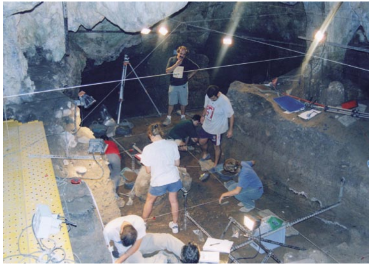
Figura 17. Excavaciones en la Cova d'En Pardo (Planes, Alicante).