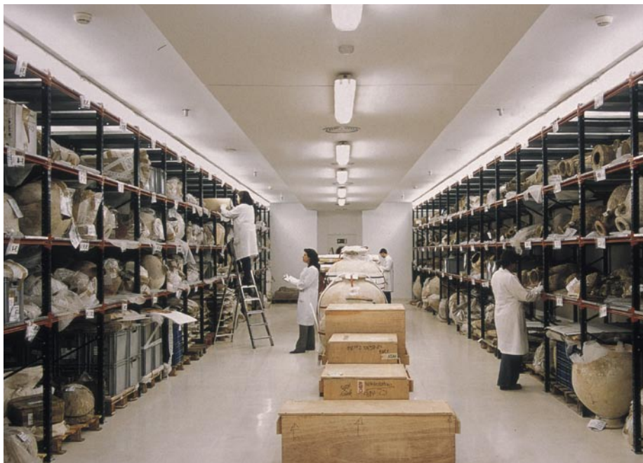
Figura 18. Vista general de una de las salas de los Almacenes del MARQ.