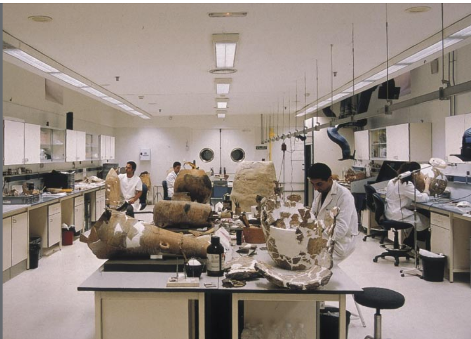
Figura 19. Trabajos de reintegración y recomposición de piezas arqueológicas en el Laboratorio de Restauración del MARQ.

La preparación de piezas cedidas para exposiciones externas, como algunas tinajas de la Iglesia de Santa María de Alicante o un ánfora del Tossal de Manises, con destino a Valencia y Sagunto, respectivamente.