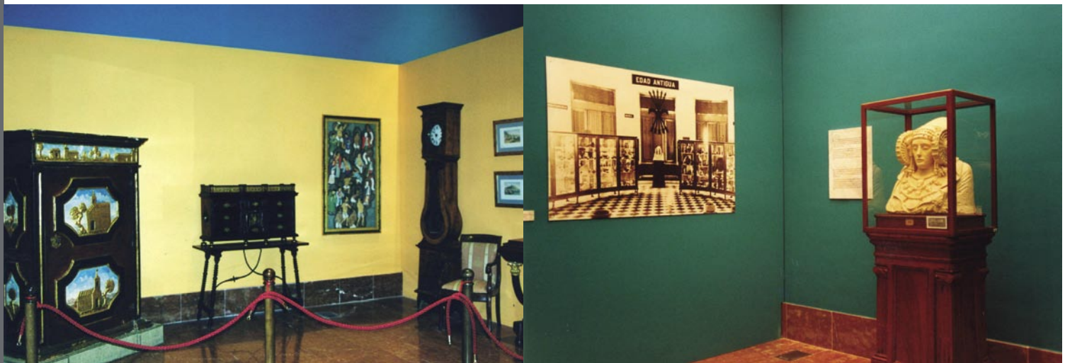
Figura 3. Exposición “Legados del MARQ”.