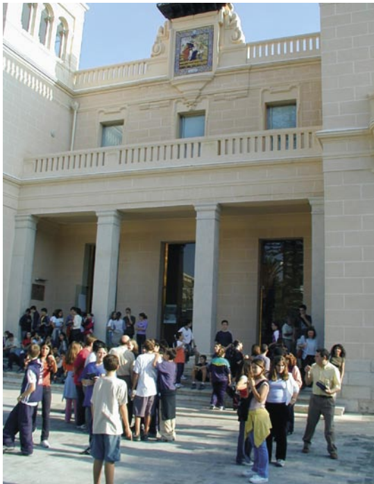
Figura 24. Visita de escolares al MARQ.

de más fácil explicación ya que al ser escenografías con reproducciones nos permite que se puedan tocar sin afectar a la conservación de los objetos. En el banco de las Ciencias, donde las piezas son susceptibles de ser tocadas, colocamos algunos de los pies de objetos en escritura Braille.