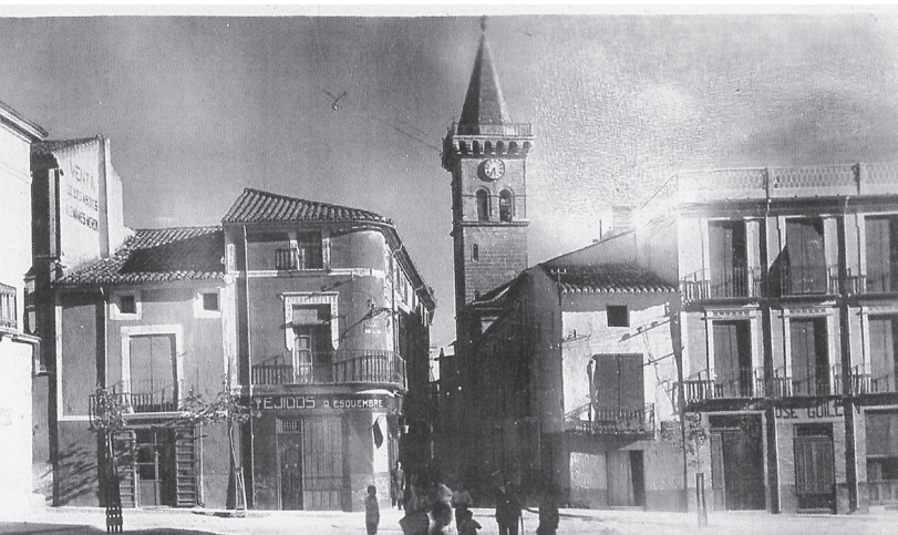
Figura 3. La Puerta de Almansa, lugar emblemático de Villena situado en la intersección de las calles Ramón y Cajal, Juan Chaumel y Joaquín María López. Año 1920.

ca de la puerta de Almansa, así como en la gran parcela donde estuvo el Colegio Carmelitas, cuyo lado norte da a la calle Revueltas, por donde se suponía discurría una parte de la cerca.