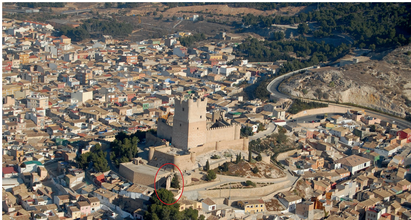
Figura 1. Restos de la muralla levantada por don Juan Manuel en el siglo XIV.