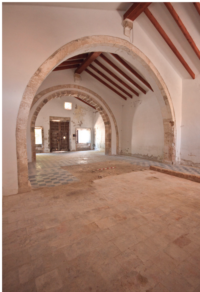
Figura 2. Interior de l'ermita des de l'oest.

Probablement per intentar pal·liar, més que fora en part, aquesta dolenta situació, però també per augmentar l'espai del cementeri (Xàbia era un poble amb una demografia creixent que va passar dels 3.654 habitants de l'any 1843 als 5.785 de l'any 1857), l'any 1849, l'alcalde de Xàbia, Antoni Català, va comprar a Cristòfol Español tres fanecades de terra per ampliar el cementeri (G.Cruaños, Efemerides, núm. 289. 1986). Amb aquestes obres, el cementeri va adquirir les dimensions que encara manté, bastint-se ara els primers grups de nínxols (situats sobre la paret oest) destinats als