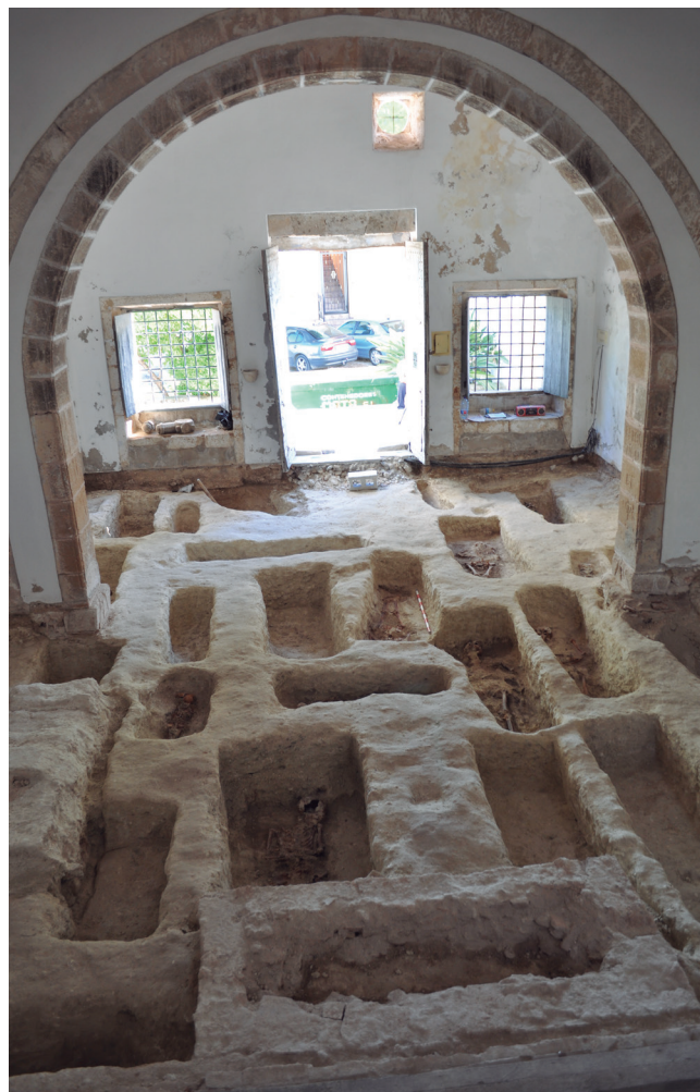
Figura 3. Interior de l'ermita amb les fosses excavades.

Per tal de continuar el projecte de rehabilitació de l'ermita de Sant Joan i del cementeri vell, iniciat ja fa més de deu anys, es va plantejar substituir el paviment de l'ermita, la qual cosa suposava la realització d'una excavació arqueològica per documentar les possibles restes que pogue-