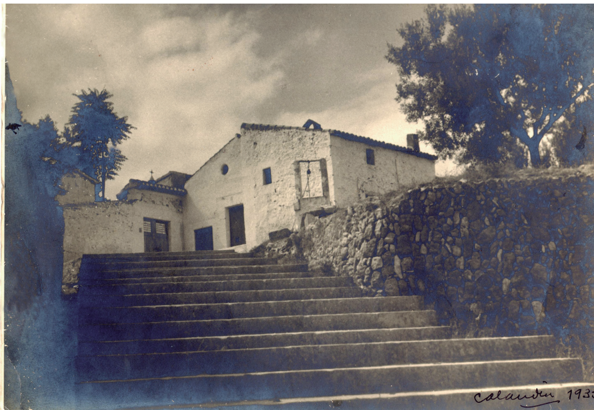
Figura 1. Ermita i escala de Sant Joan, imatge de 1935.

ordes i recomanacions dictades des de les altes institucions de l'administració, però no va ser fins a l'any 1817 quan va ser inaugurat el cementeri de Sant Joan. Així, consta a l'anotació 258 de les "Efemérides" recopilades per G. Cruaïnes. Hi llegim: