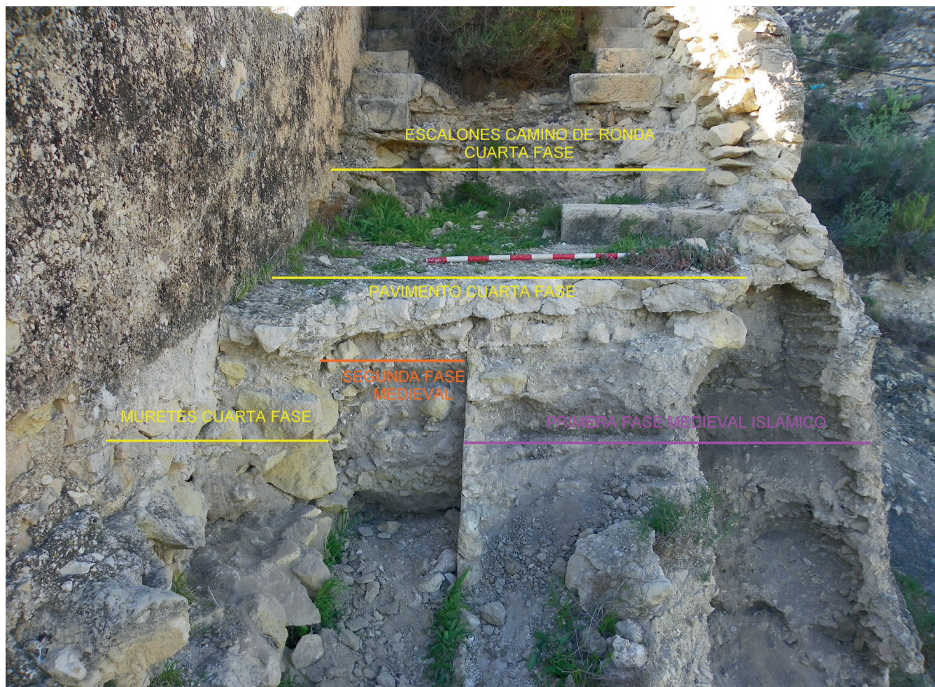
Figura 2. Distintas fases constructivas documentadas en el lienzo de la muralla.

sa de cal (2-3 cm.). La argamasa que lo forma es la misma que se utiliza para unir los sillarejos del camino de ronda y parece contemporáneo a éste. Por lo tanto nos hallamos ante la última remodelación de la muralla, el pavimento pertenece a esta fase constructiva y funcionaría con ella.