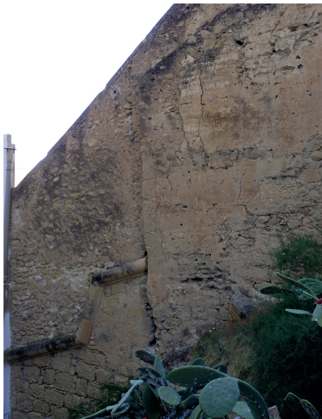
Figura 3. Tercera fase, s.XVI. Se aprecia la moldura propia de la muralla y los baluartes de época renacentista.

desgracia, todo el material recuperado es poco significativo, tratándose en su mayoría de fragmentos informes sin decoración. Así pues, lo único que podemos decir es que el muro fue construido en época islámica, sin poder afinar más su datación desde postulados arqueológicos.