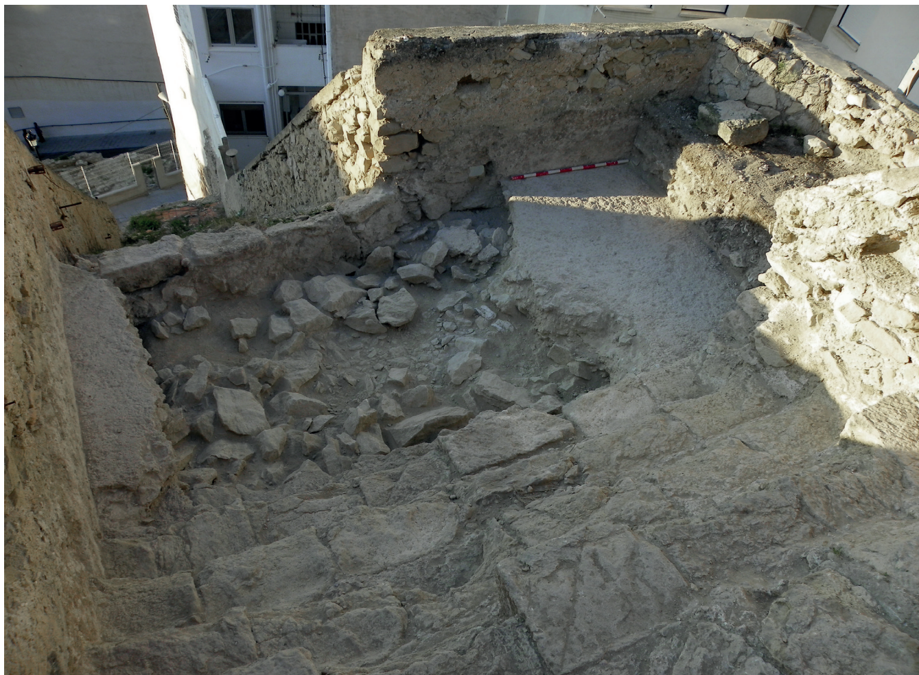
Figura 4. Foto final de la excavación del pequeño sondeo realizado junto a la Torre Bajomedieval, en el paseo de ronda.

modificación se halla recogida en las fuentes en El Memorial del Duque de Calabria, que a continuación citamos textualmente (Rosser, 1990: 52):