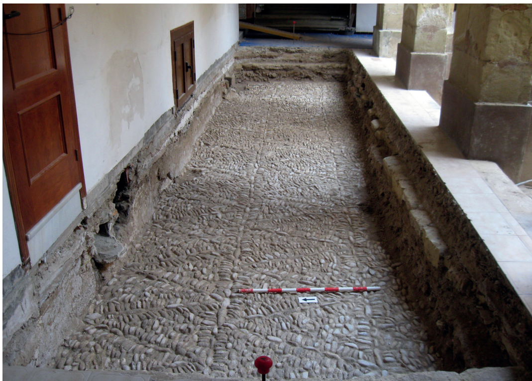
Figura 2. Vista general del pavimento de cantos rodados encontrado en el sondeo del claustro.

rodados (Fig. 2). Los siguientes restos arqueológicos descubiertos corresponden a finales del siglo XVII / principios de XVIII , momento en el que podríamos adscribir un nivel de enterramientos documentado en el Huerto y en el interior de las habitaciones perimetrales (Fig. 3). Un elemento cronológico que podría aportar información sobre su datación es un fragmento de plato vidriado del taller de Manises, decorado con el escudo de la orden de la Merced, que podría corresponder a la primera mitad del siglo XVIII (Benedito et al. 2007). No tenemos evidencias del momento en el que deja de utilizarse el cementerio, pero debemos situarlo en función de la Real Cédula de Carlos III (1787) por la que se prohibían los enterramientos en el interior de las iglesias y se ordenaba que se construyeran los cementerios fuera de las ciudades