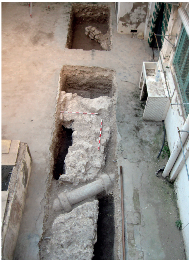
Figura 4. Detalle de los restos constructivos documentados en el sector C del huerto.

primeras correspondían a individuos en conexión anatómica y sin grandes alteraciones tafonómicas, siendo las segundas paquetes de huesos resultado de un transporte total o parcial de ciertos restos de su lugar original a otro, formando osarios. Se registraron veinticinco enterramientos del primer tipo y cuatro del segundo, además de ser común hallar restos humanos descontextualizados en niveles de relleno, particularmente los superiores.