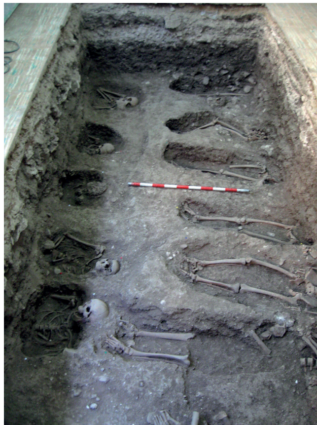
Figura 3. Nivel de enterramientos documentado en la habitación 2.

Hemos documentado enterramientos en las Habitaciones 2, 3, 4 y 5, y en los sectores B y C. Se ha comprobado la existencia de inhumaciones primarias y secundarias. Las