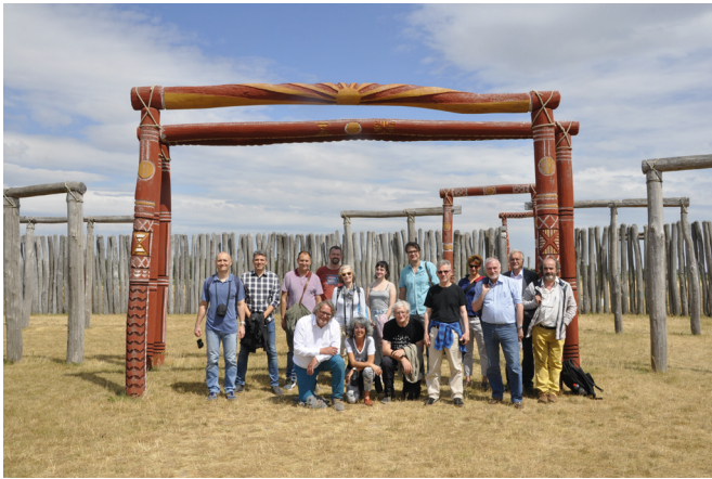
Figura 13: Participantes en el congreso internacional New Perspectives on European Prehistory II celebrado en el Museo Estatal de Prehistoria de Halle (Alemania).

fundamentalmente en un programa de exposiciones temporales de carácter provincial, nacional e internacional, que ha dado enorme prestigio al MARQ y que es desarrollado con la participación activa de la Unidad de Exposiciones y Difusión del MARQ y del equipo técnico del museo, con la colaboración y patrocinio de la Fundación de la CV MARQ y de otros profesionales de la arquitectura y el diseño. Este programa ha permitido conocer y disfrutar