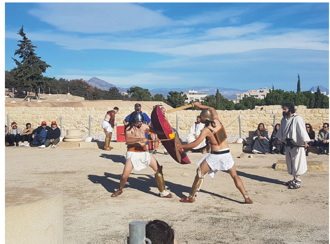
Figura 8: Combate de gladiadores durante las IV Jornadas de Recreación Histórica celebradas en la ciudad de Lucentum.

En cuanto a divulgación, se ha reeditado las IV Jornadas de Recreación Histórica Lucentum , que se realizan con el objetivo de acercar esta ciudad romana, origen de Alicante, a todos nuestros visitantes, contribuyendo a la puesta en valor el yacimiento (Fig. 8). Hasta 1.510 participantes han podido disfrutar de la recreación de la vida cotidiana en una ciudad romana tales como el despertar de un magistrado, la higiene diaria, la Salutatio de los clientes a su patrono, ceremonias religiosas y toma de auspicios, desfiles militares, luchas de gladiadores, etc. Todo ello en el magnífico escenario que se genera, años tras año, gracias a