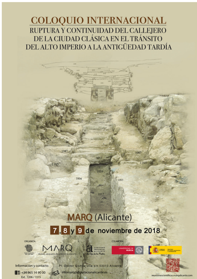
Figura 7: Cartel anunciador del Coloquio Internacional Ruptura y Continuidad de a ciudad clásica en el tránsito del Alto Imperio a la Antigüedad Tardía que se celebró en el Salón de Actos del MARQ los días 7 al 9 de noviembre de 2018.

en el Congreso Internacional Ruptura y continuidad del callejero de la ciudad clásica en el tránsito del Alto Imperio a la Antigüedad Tardía , cuyas actividades tuvieron lugar en el Salón de Actos del MARQ los días 7-9 de noviembre de 2018 (Fig. 7) con la presentación de la comunicación Evolución del viario de Lucentum (Alicante) y la presentación de la comunicación La cerámica decorada de estilo ilicitano en el Tossal de Manises (Alacant): secuencia y contexto en el XVIII Seminario de Arqueología e Historia Vasa Picta Ibérica. Talleres de Cerámica del Sudeste Hispánico. Siglos II A.C. a I D.C. Homenaje al Profesor Ricardo Olmos Romero, celebrado la ciudad alicantina de Elda.