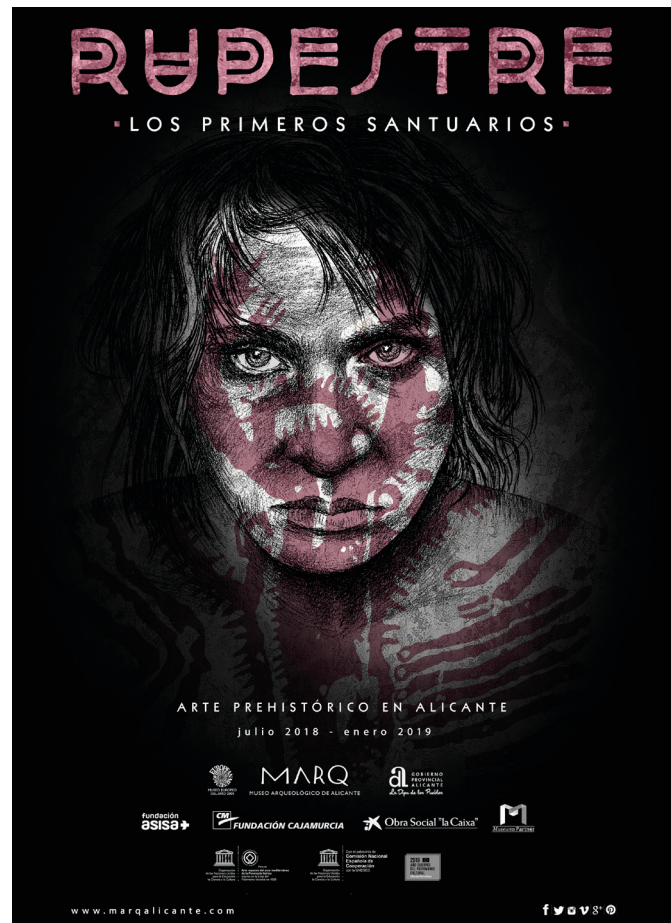
Figura 15: Cartel anunciador de la exposición temporal Rupestre. Los primeros santuarios .