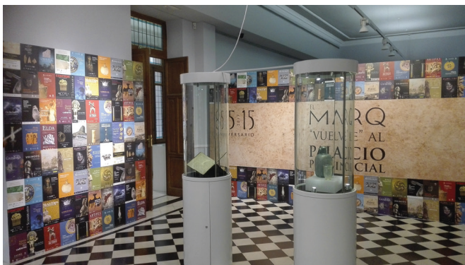
Figura 19: Detalle de la exposición temporal 85/15 El MARQ "vuelve" al Palacio Provincial celebrada en el mes de septiembre en la antigua sede del museo en la planta baja del Palacio de la Diputación.

Entre ellas, algunas tan emblemáticas como el libro de actas de la Comisión Provincial de Monumentos en la que se estableció la creación del Museo Arqueológico Provincial, un vaso cerámico con decoración impresa de la Illeta dels Banyets de El Campello, uno de los pebeteros con forma de cabeza femenina de época ibérica del Tossal de la Cala de Benidorm, un candelabro de bronce de los siglos X-XI de la Calle Historiador Palau de la ciudad de Denia o la réplica de la Dama de Elche realizada por el escultor valenciano Ignacio Pinazo en el año 1908.