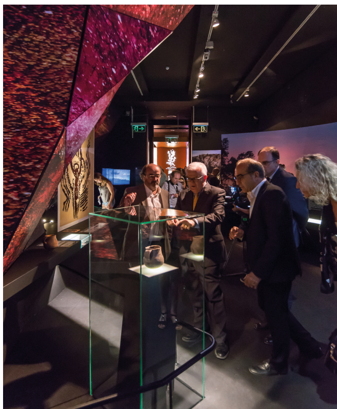
Figura 16: Inauguración de la exposición Rupestre. Los primeros santuarios en las salas de exposición temporal del MARQ.

Además, la oferta expositiva ha ocupado el espacio expositivo ubicado en el vestíbulo dedicado a mostrar piezas o conjuntos de