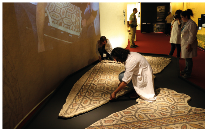
Figura 5: Trabajos de colocación de los fragmentos del mosaico romano de Villa Petraría durante el montaje de la exposición Petrer, Arqueología y Museo .

En el primero de los casos, las salidas están justificadas para formar parte, por un lado, de exposiciones temporales de otros museos como ocurrió con la cesión temporal de la mano de bronce de Lucentum al Museo Arqueológico Nacional (MAN) para la exposición temporal El poder del pasado: 150 años de arqueología española . También podemos destacar la cesión temporal de la reja romana de la Illeta dels Banyets (El Campello), que formó parte