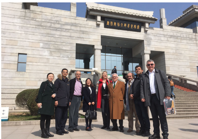
Figura 3: Foto de la expedición del MARQ en la puerta del Museo de los Guerreros de Terracota y Caballos de Qin Shihuang en Xi'an (China) durante la visita realizada en el año 2018.

Pero, sin duda, 2018 será el año en el que se pusieron los cimientos de lo que será una de las muestras más importantes que hayan pasado por las salas del MARQ con el viaje de una delegación del Museo Arqueológico de Alicante y de la Fundación CV MARQ, encabezada por el Vicepresidente segundo y Diputado de Cultura de la Diputación de Alicante a la ciudad china de Sahaanxi, en la región de Xi'an (Fig. 3), para gestionar la producción de una exposición sobre los Guerreros de Xi'an , los míticos e inmortales guerreros del ejército funerario de terracota del mausoleo monumental del primer emperador chino de Qin Shihuang , un descubrimiento realizado en el año 1974 y que ha sido declarado Patrimonio de la Humanidad siendo, a día de hoy, uno de los hallazgos arqueológicos más importantes del mundo.