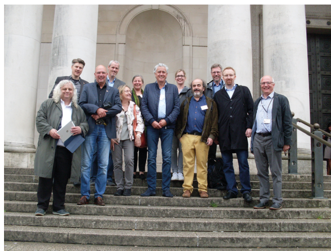
Figura 2: Foto de grupo de los participantes en la 10ª reunión del EEN en Cardiff.

La 10ª reunión de la plataforma se realizó en junio de 2018 en la localidad de Cardiff (Reino Unido) y contó, aparte del MARQ, con el Amgueddfa Cymru-National Museum Wales (Reino Unido), el Drents Museum de Assen (Holanda), el Historisches Museum der Pfalz (Speyer, Alemania), el Landesmuseum für Vorgeschichte (Halle/Saale, Alemania), el Liechtensteinisches Landesmuseum (Vaduz, Liechtenstein), el MAMUZ SchlossAspurn/Zaya – Museumszentrum Mistelbach (Austria), y el Moesgård Museum de Aarhus (Dinamarca). El resultado más notable de la reunión de Cardiff (Fig. 2) fue la decisión de producir en el MARQ la exposición Iran - Cradle of Civilizations , que en aquellos momentos se exhibía en el Drents Museum de Assen, siendo una excelente muestra para que protagonizara el programa de exposiciones del MARQ en 2019.