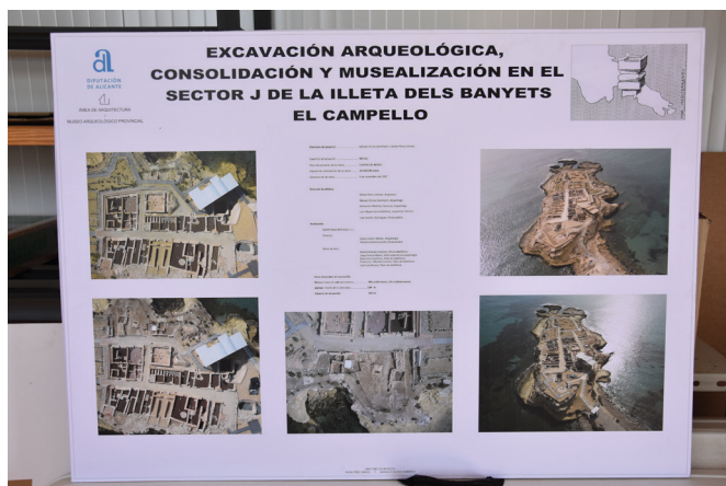
Figura 9: Uno de los paneles informativos colocados en el yacimiento de la Illeta dels Banyets (El Campello).

Por último, se ha colaborado en las actividades encaminadas a dar apoyo a asociaciones culturales que promocionan, difunden y defienden nuestro patrimonio, como sucedió con la VIII edición de la Ruta Morisca, que en esta ocasión discurría entre el sur de La Vila Joiosa y el Norte de El Campello, siendo la Illeta dels Banyets el final del recorrido. Nuestra participación consistió en una visita al yacimiento el sábado 10 de febrero de 2018 y una conferencia en la clausura de las jornadas, que se celebró en la Biblioteca Municipal de El Campello el día 24 del mismo mes.