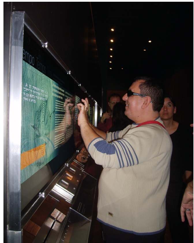
Figura 24: Lectura de los textos táctiles en braille colocados para mejorar la accesibilidad en los paneles de la colección permanente del MARQ.

El MARQ colabora a través de este proyecto con asociaciones alicantinas que atienden a personas con disfuncionalidad como ONCE, FESORD, APESOA, ASOCIDE C.V., Asociación VIDA LIBRE, APSA, ASPALI o la Asociación Alicantina Síndrome de Down, convirtiéndose en un referente en materia de accesibilidad. El MARQ