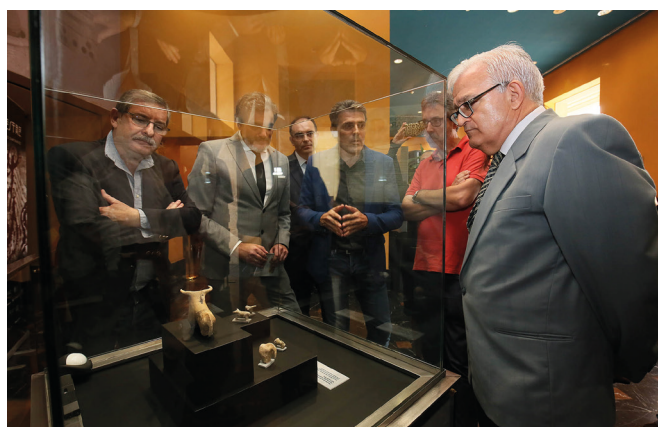
Figura 18: Inauguración de la muestra Los Toros del Argar. Figurillas de arcilla de la Edad del Bronce en el vestíbulo del museo.