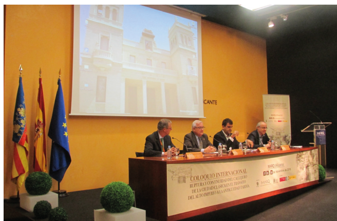
Figura 12: Acto de inauguración del coloquio internacional Ruptura y Continuidad de la ciudad clásica en el tránsito del Alto Imperio a la Antigüedad Tardía que se celebró en el Salón de Actos del MARQ los días 7 al 9 de noviembre de 2018.

Organizadas por el MARQ, en solitario o con otras instituciones científicas o técnicas, hasta la fecha se ha realizado cerca de una cincuentena de reuniones, además de un buen número de conferencias que versan sobre el patrimonio que custodia el MARQ, su contextualización en el ámbito nacional e internacional o sobre los contenidos de las exposiciones temporales del Museo. En este año 2018, se han realizado en el Salón de Actos del MARQ varias reuniones científicas de enorme repercusión, como el coloquio internacional que tuvo lugar los días 7, 8 y 9 de noviembre dedicado