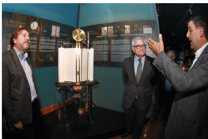
Figura 4: Momento de la inauguración del Mareógrafo Thomson en la Sala de Edad Moderna y Contemporánea de la Colección Permanente del MARQ.

Precisamente una de las donaciones de 2018, dada su relevancia, ha sido incluida en la exposición permanente de la Colección del MARQ: el Mareógrafo Thomson , que se muestra en la Sala de Edad Moderna y Contemporánea (Fig. 4). Una copia exacta del modelo original instalado en el puerto de Alicante para medir el nivel del mar, fabricado por la casa londinense Negretti & Zambana, donado por el Instituto Geográfico Nacional de España.