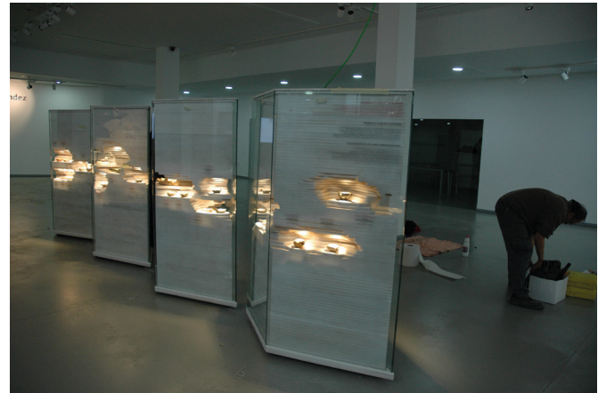
Figura 20: Montaje de la exposición itinerante Luz de Roma en la sala de exposiciones del Museo del Enclave de la Muralla (MUDEM) de Molina del Segura.

Por otra parte, la producción expositiva se incrementa con el programa de exposiciones itinerantes, que continúan su recorrido por el territorio provincial. Estas muestras son de pequeño formato y permiten trasladar algún aspecto histórico, arqueológico o patrimonial a las poblaciones de la provincia de Alicante con un mon-