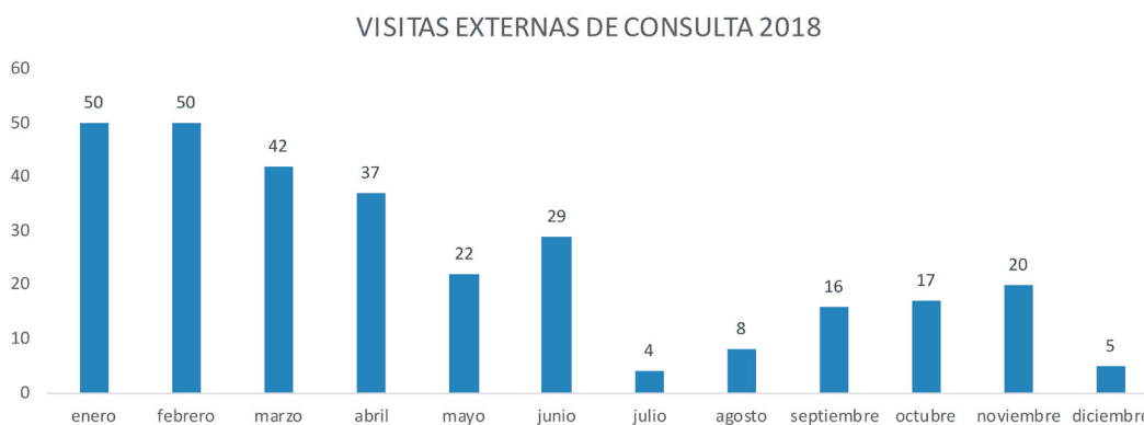
Figura 6: Evolución de las visitas externas de consulta en los almacenes del MARQ durante el año 2018.

Además, han continuado las labores de mejora y renovación de la documentación del resto del Fondo Numismático. Durante este año 2018, se han realizado estos trabajos con un doble objetivo. Por una parte, se ha trabajado para tener incorporada la colección numismática al Catálogo Sistemático del MARQ, traspasándose las fichas de 501 monedas desde la base de datos Catálogo Monetario a la base de datos del Catálogo Sistemático. Por otra parte, se ha estado trabajando en ordenar las colecciones numismáticas