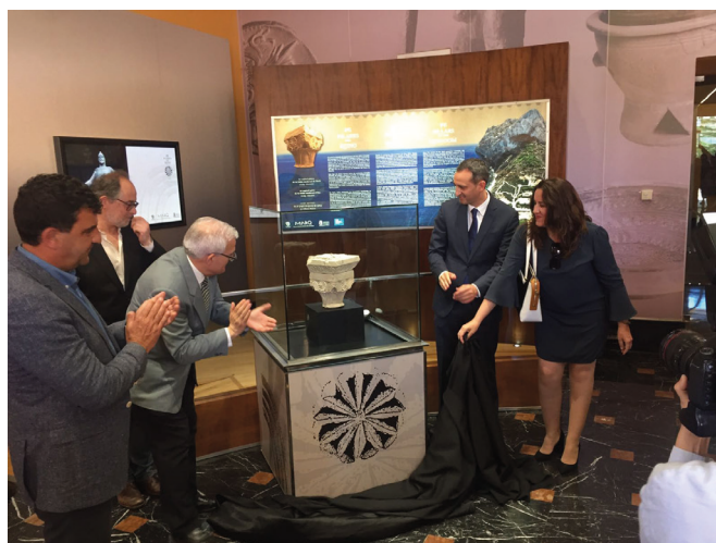
Figura 17: Inauguración del Capitel gótico de la Pobl de Ifach en el vestíbulo del museo.

Dos exposiciones han ocupado esta tribuna expositiva durante el año 2018. La primera fue Los Pilares del Reino. El capitel gótico de la Pobl medieval de Ifach , entre los meses de mayo y septiembre de 2018, siendo comisariada por José Luis Menéndez Fueyo en la que se mostraba el hallazgo de un capitel gótico fechado en la primera mitad del siglo XIV que fue hallado en uno de los edificios del poder feudal de la Pobl de Ifach en la localidad de Calp, un yacimiento en el que el MARQ lleva trabajando desde el año 2005 (Fig. 17).