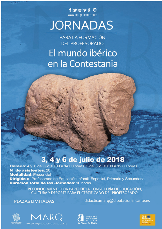
Figura 22: Cartel de las Jornadas para la formación del profesorado dedicadas al Mundo ibérico en la Contestania.

gramación centrada en los yacimientos del MARQ y en las exposiciones temporales como Petrer. Arqueología y Museo pero, sobre todo, en el Día Internacional de los Museos (DIM), dedicado este año a los Museos Hiperconectados (Fig. 23). Asimismo, la campaña Veranea en el Marq ha estado centrada en la exposición Rupestre. Los Primeros Santuarios , mientras que la campaña navideña se ha dedicado a la exposición Plastihistoria de la Humanidad .