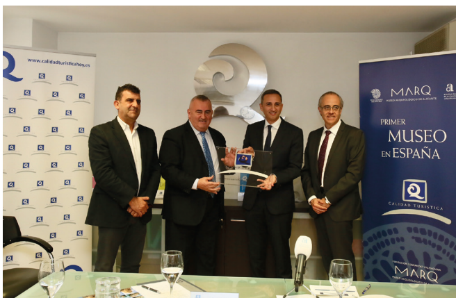
Figura 1: Acto de entrega de la Marca Q de Calidad Turística al MARQ.

Este reconocimiento, que se une a otros galardones y certificaciones obtenidos en estos últimos 15 años, no ha sido labor de un solo día. Queda lejos la inauguración oficial del MARQ-Museo Arqueológico de Alicante en su nueva sede en 2002, donde se gestó la implementación de un sistema de gestión que ha transformado el Museo en un centro de referencia cultural y turística en colaboración con todos los sectores de la sociedad alicantina.