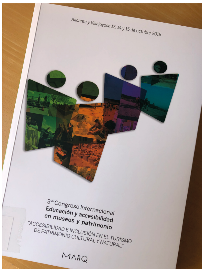
Figura 11: Ejemplar de las Actas del III Congreso Internacional de Educación y Accesibilidad en museos y patrimonio. Accesibilidad e inclusión en el Turismo de Patrimonio cultural y natural celebrado en el MARQ.

Para desarrollar esta función, el MARQ desarrolla una serie de líneas editoriales, que han ido incrementando al paso de los años para dar respuesta a necesidades de difusión científica y divulgación de trabajos, tanto los generados por su equipo técnico como por investigadores externos, sobre museografía, la colección, investigación y preservación de yacimientos arqueológicos y, en general, temas relevantes del Patrimonio arqueológico de la Provincia y la labor museística.