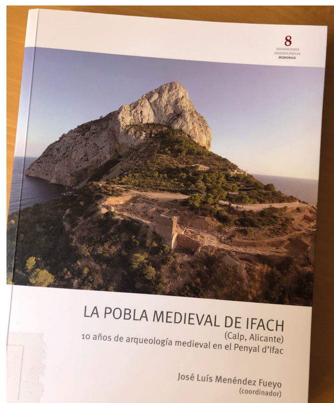
Figura 10: Ejemplar del libro La Población medieval de Ifach (Calp, Alicante). 10 años de arqueología medieval en el Penyal d'Ifach (2005-2015) .

La labor de difusión científica y divulgación del patrimonio que el MARQ conserva y exhibe, se canaliza a través de la publicación de catálogos y monografías de sus fondos (Ley 4/1998 de Patrimonio Cultural Valenciano, Tit. IV, Art. 68.2 y Orden de 6 de febrero de 1991. Art. 3), que dan a conocer los trabajos de investigación arqueológica y museográfica y de catalogación de fondos y divulgación. En la actualidad el Museo ha editado un centenar de títulos en varias series: Catálogo de Fondos del Marq, Excavaciones Arqueológicas, Mayor, Trabajos de Arqueología, Varia y Actas de Congresos y Jornadas . Además, el Museo edita una revista propia MARQ. Arqueología y Museos , de la cual lleva editados 10 números y uno monográfico. Parte esencial de la edición de las publicaciones del MARQ se distribuye entre el Museo Arqueológico (ediciones técnicas y científicas) y la Fundación C.V. MARQ (ediciones divulgativas), si bien corresponde al MARQ la coordinación y revisión de las publicaciones de la Fundación (básicamente en los catálogos de exposiciones).