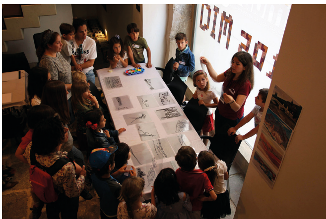
Figura 23: Actividades didácticas realizadas en el MARQ durante los actos del Día Mundial de los Museos (DIM) en 2018.

gramación centrada en los yacimientos del MARQ y en las exposiciones temporales como Petrer. Arqueología y Museo pero, sobre todo, en el Día Internacional de los Museos (DIM), dedicado este año a los Museos Hiperconectados (Fig. 23). Asimismo, la campaña Veranea en el Marq ha estado centrada en la exposición Rupestre. Los Primeros Santuarios , mientras que la campaña navideña se ha dedicado a la exposición Plastihistoria de la Humanidad .