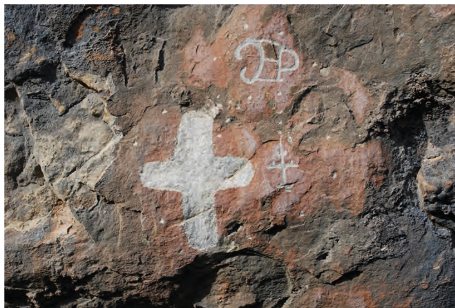
Figura 21. Yacimiento de Cova Fosca de Segària, cuya boca se encuentra completamente cubierta por pintadas recientes por debajo de las cuales se adivinan grabados más antiguos, si bien su observación resulta sumamente complicada por dicho motivo