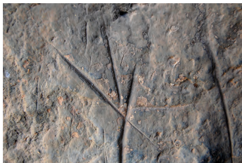
Figura 1. Grabados picados de Al Patró (Vall de Gallinera, Alicante)