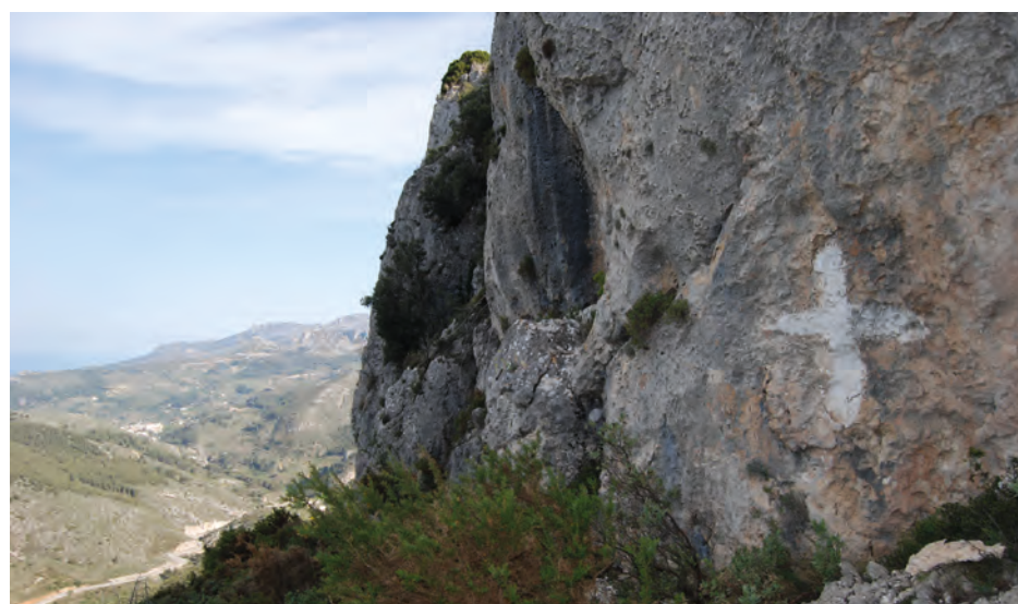
Figura 13. Estrella de cinco puntas incisa del Barranc dels Bassiets (L'Orxa), ubicada en una pared rocosa junto a un antiguo camino de herradura