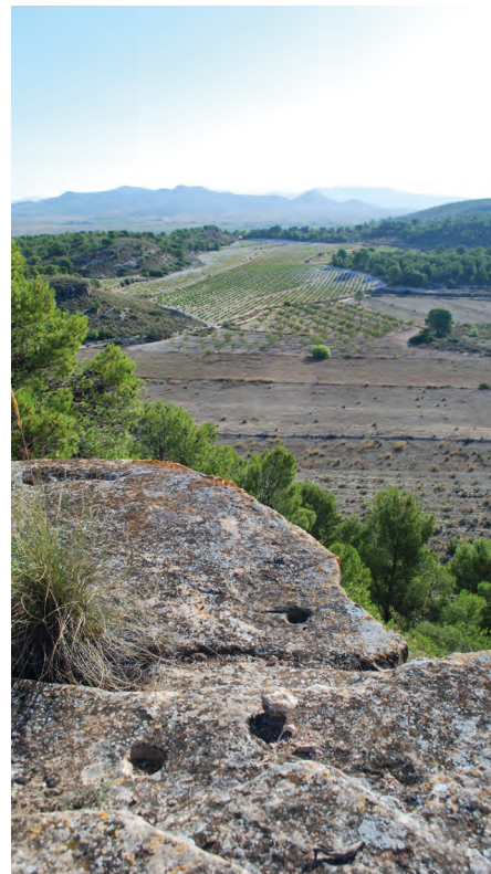
Figura 5. Conjunto de pequeñas cazoletas picadas en una superficie horizontal en la serra de Forná (Benimassot, Alicante)