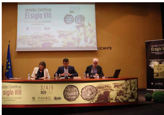
Figura 9: Inauguración de las Jornadas Científicas El siglo VIII: procesos de islamización y materialidad en el Mediterráneo en el Salón de Actos del MARQ Museo Arqueológico de Alicante.

cializados, han colaborado con el MARQ Museo Arqueológico de Alicante en la difusión científica del Patrimonio Arqueológico.