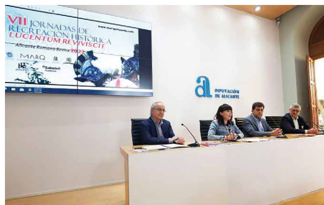
Figura 1: Presentación de las VII Jornadas de Recreación Histórica Lucentum Reviviscit .

Los trabajos llevados a cabo en 2022 desde el Tossal de Manises se han centrado en la finalización del Plan General de Investigación del Tossal de Manises «Excavaciones del camino de acceso a las ciudades antiguas del Tossal de Manises» (2018-2021), con la musealización y puesta en valor tanto de la Puerta del Mar (excavada en 2015-2016) como del complejo defensivo de la Puerta Oriental (objeto del plan de actuación 2018-2021), abordados conjuntamente por el Área de Arquitectura de la Diputación Provincial y el MARQ. Con esta intervención se han incorporado al recorrido público del yacimiento los restos de la puerta urbana romana que abría el antiguo municipio hacia la bahía de La Albufereta, acompañados de un nuevo panel informativo que describe sus principales rasgos, características y evolución. A su vez, en la Puerta Oriental, se ha procedido a actuar sobre los restos descubiertos y estudiados en 2018-2021, incorporándolos al recorrido didáctico del yacimiento y ofreciendo con la nueva cartelería los resultados de las nuevas investigaciones, completando la puesta al día de la información del yacimiento al público la renovación de 16 carteles del recorrido por el parque arqueológico.