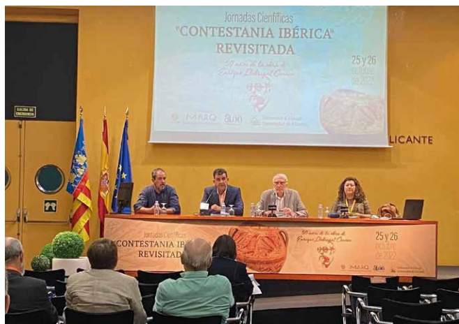
Figura 8: Inauguración del seminario Contestania Ibérica Revisitada en el Salón de Actos del MARQ Museo Arqueológico de Alicante.