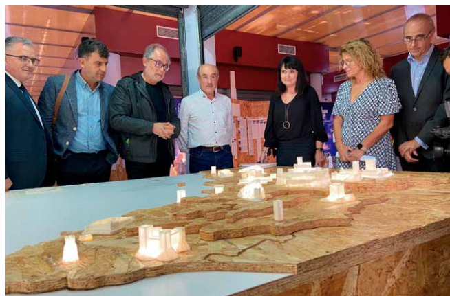
Figura 6: Inauguración en el Mercado Municipal de Abastos de Rojas de la exposición itinerante Guardianes de Piedra. Los Castillos de Alicante .

Este año 2022, se han producido y ejecutado tres exposiciones: Gladiadores, Héroes del Coliseo (Fig. 3), una exposición ofertada por la empresa italiana Contemporánea Progetti, en la que se expusieron piezas, entre otros museos, del Museo Archeologico Nazionale di Napoli y el Parco Archeologico del Colosseo en Roma. La exposición, patrocinada por la Fundación C.V. MARQ, se inauguró el 14 de abril de 2022, teniendo su clausura programada el 20 de noviembre de 2021 (Fig. 4).