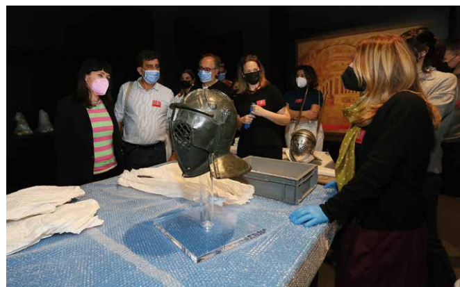
Figuras 3 y 4: Cartel y momento del montaje de las piezas de la exposición temporal Gladiadores, Héroes del Coliseo en el MARQ.

que ha dado enorme prestigio al MARQ Museo Arqueológico de Alicante y que es desarrollado con la participación activa de la Unidad de Exposiciones y Difusión del MARQ y del equipo técnico del museo, con la colaboración y patrocinio de la Fundación de la C.V. MARQ y de otros profesionales de la arquitectura y el diseño. Este programa ha permitido conocer y disfrutar de más de 170 exposiciones desde el año 2004, trayendo hasta la ciudad de Alicante importantes colecciones de la arqueología local, nacional e internacional que representan significativas manifestaciones culturales del pasado de la Humanidad.