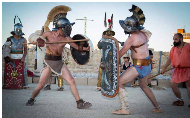
Figura 2: Recreación de una lucha entre gladiadores en el Parque Arqueológico de Tossal de Manises/Lucentum.

a los restos arqueológicos que éste exhibe, sucesos y acontecimientos propios de su fase romana. La Fundación MARQ organiza junto al Museo Arqueológico todos los años estas jornadas con la colaboración de la Fundación Banco Sabadell y la de la Asociación Cultural "Hispania Romana".