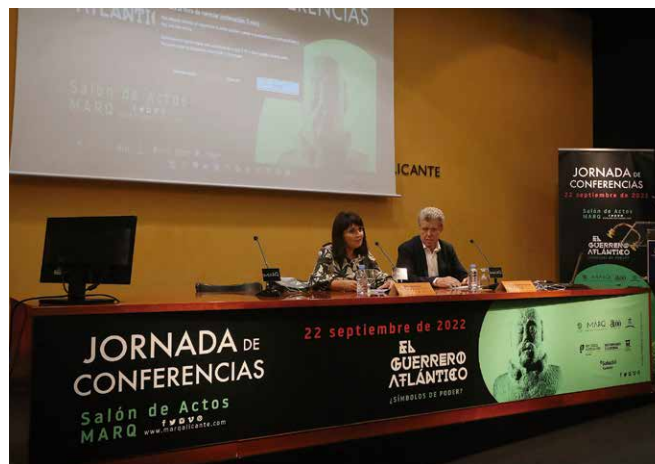
Figura 10: Inauguración de la Jornada de Conferencias Hispano-Lusas dedicada a la exposición El Guerrero Atlántico ¿Símbolos de Poder? celebrada en el Salón de Actos del MARQ.

La segunda cita fue el seminario El siglo VIII: procesos de islamización y materialidad en el Mediterráneo tiene por finalidad poner en común los nuevos conocimientos que actualmente se tienen en relación con los procesos de islamización temprana que se dan tanto en la península ibérica como en el Mediterráneo Occidental a partir de los siglos VII-VIII d.C. Las jornadas