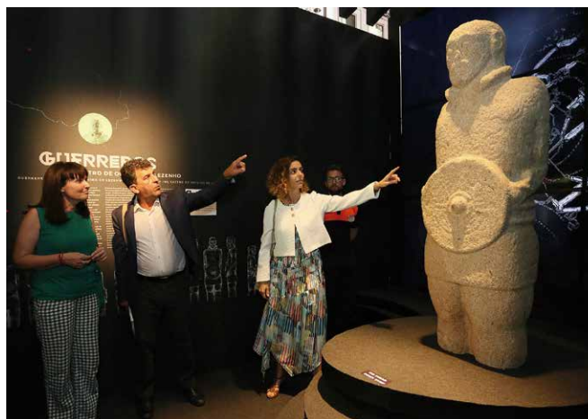
Figura 5: Inauguración en la Sala Noble de la Biblioteca del MARQ de la exposición El Guerrero Atlántico ¿Símbolos de Poder? .

que ha dado enorme prestigio al MARQ Museo Arqueológico de Alicante y que es desarrollado con la participación activa de la Unidad de Exposiciones y Difusión del MARQ y del equipo técnico del museo, con la colaboración y patrocinio de la Fundación de la C.V. MARQ y de otros profesionales de la arquitectura y el diseño. Este programa ha permitido conocer y disfrutar de más de 170 exposiciones desde el año 2004, trayendo hasta la ciudad de Alicante importantes colecciones de la arqueología local, nacional e internacional que representan significativas manifestaciones culturales del pasado de la Humanidad.